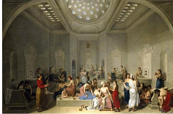
Şekil 1: Jean-jacques-Francois Le Barbier: A Female Turkish Bath or Hammam (1785)

Türe, Türk hamamları ile ilgili yaptığı bir çalışmada Roma, Bizans, Danişmentli, Selçuklu ve Osmanlı dönemlerinde yapılmış hamamlarla ilgili kaynaklar tespit etmiştir. Türklerin 11. yüzyıl sonlarında geldikleri bu coğrafyada kısa sürede hamam kültürünü benimseyip çok sayıda hamam yaptıkları tarihi kaynaklarda yer almaktadır. Hamam kavramı ile Türkler öyle bütünleşmişlerdir ki dünya literatürüne “Türk Hamamı” terimini yerleştirmişlerdir. İslamiyet’in temizliğe özel bir anlam atfetmesi, en temel ibadetlerinden biri olan namazla birlikte bedensel temizliğin zorunlu olması hamamın Türk kültürüne girişini kolaylaştırmıştır (Türe, 2012). Ayrıca Batılı ressam Jean-jacques-Francois Le Barbier tarafından 1785 yılında yapılan sanatsal bir resimde Türk Hamamı konu alınmıştır (Şekil 1).