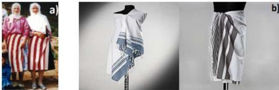
Şekil 2: a) Giyim eşyası olarak kullanılan peştamal (vanhabertv.com/yasmak-ve-peştamal-tarih-oldu, 2012), b) Hamam peştamalı (turksanatlari.com, 2010).

Hamam peştamalıının da farklı kullanım amaçları vardır. Bunlardan biri hamamda yıkanırken veya dinlenirken örtünme, diğeri de kurulanmaktır. Yıkanırken kullanılan peştamala su peştamalı , yıkanma işlemi bitip ıslak olanın çıkartılmasından sonra örtünmeye devam etmek için kuşanılana çıkma adı verilir (Şekil 3). Kurulanma amaçlı kullanılan ise sadece peştamal olarak isimlendirilir. Su peştamalı genellikle eni 80-100 cm boyu 170-190 cm olan saçaksız bezayağı dokuma ile üretilmiş su emicilik özelliği düşük olan pamuklu bir kumaştan yapılır. Rengi düz beyaz ya da beyaz, sarı, mavi, kırmızı ve siyah renklerin kombinasyonu kullanılarak çizgili veya ekose desenlerle dokunmuş olabilir. Uçları dikişli veya kesik olabilir, saçağı yoktur.