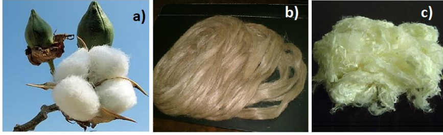
Şekil 4: a) Pamuk bitkisi ve lifi, b) Keten lifi, c) Bambu lifi (tekstilmuhendisi.net)

Bambu lifi kullanan birçok Türk firması büyük başarı sağlamış ve yurt dışında havlu, bornoz ve peştamal alanında söz sahibi olmuştur.