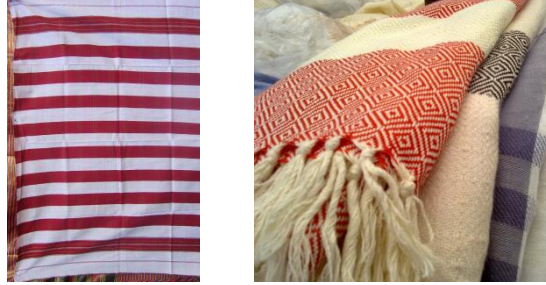
Şekil 3: Püskülsüz Su Peştamalı (çıkma), Püsküllü Peştamal (retailnews.com.tr, 2012)

(tufting) yaygın olarak kullanılması sebebiyle 90'lı yılların başlarında ve günümüzde azalan bir şekilde talep düşüklüğü yaşamıştır.