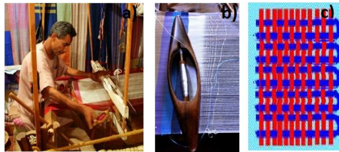
Şekil 6: a) El Dokuma Tezgahı b) Mekik c) Orijinal Kenar

Peştamallık kumaşlar seri üretim dışında, el dokuma tezgahlarında dokunurlar. El dokuma tezgahları tarihin en eski kumaşlarına tanıklık etmiş ve kaliteli kumaşlar üretilmesine olanak sağlayan ilkel makinelerdir. İşlem uzun ve emek yoğunudur fakat atkı ipliğinin kumaş kenarlarında kesilmeden ‘U’ dönüşü yapmasıyla oluşan orijinal kenar oluşur. Kesim yapılmadığı için kenar sökülmelerini önleyen kenarda sıklığın artırılması işlemine de gerek duyulmaz. Böylece diğer kenar türlerinde yaşanan sertlik hissi oluşmaz.