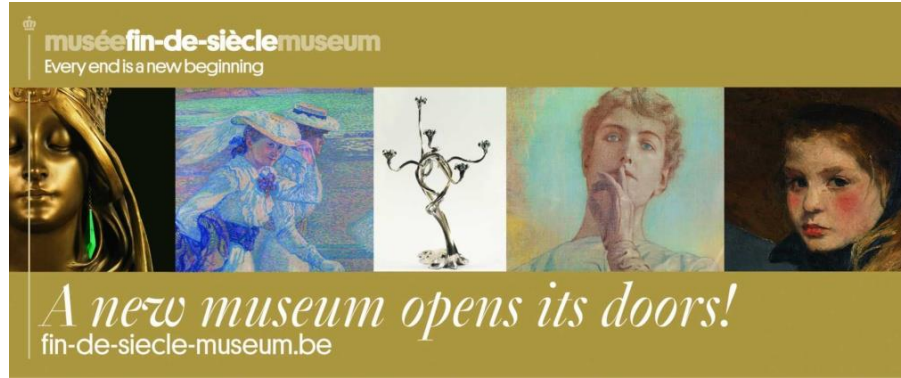
Foto 1: (2013). Fin de Siecle/Yüzyıl Sonu Müzesi Açılış Afişi (küçültülmüş formu), Brüksel, Belçika .