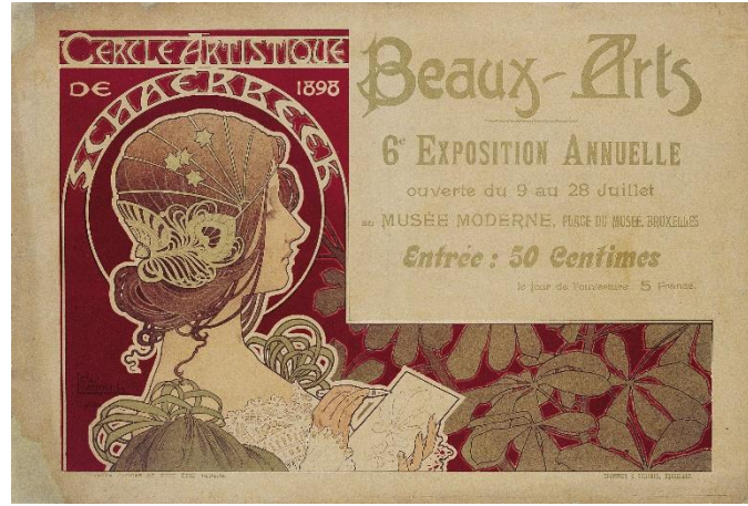
Foto 5: Privat Livemont, ( 1898). Schaerbeek Sanat Çemberi/Cercle Artistique de Schaerbeek. Brüksel, Belçika.

Bu semtte her yıl "Le Cercle Artistique de Schaerbeek" (Schaerbeek'in Sanat Çemberi/Grubu) adı altında sergiler açılır ve Livemont sık sık bu sergilere katılırdı. Sergilerindeki Art Nouvaeu afişleri ile kısa zamanda ünlenmiştir. Önemli ticari şirketler ürünlerini piyasaya sürmeden Livemont'un afişleri ile tanıtım yapmayı tercih ediyorlardı. (SCHOONBROODT. 2007, s. 8)