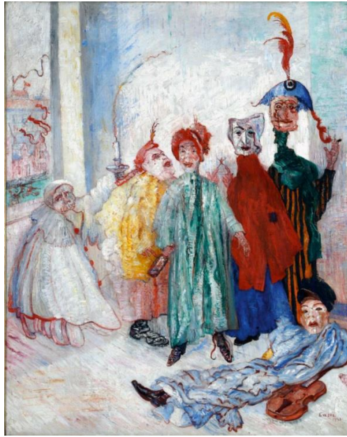
Foto 4: James Ensor, Tek Maskeler, 1892. Belçika Kraliyet Güzel Sanatlar Müzesi, Brüksel, Belçika.

James Ensor (1860-1949), önceleri realist resimler yapmış, sonra hayali-fantastik tarzda çalışmalarına devam etmiştir. Takıntı ve korkularını da yansıttığı resimlerinde bazı objelere mistik anlamlar vermiştir. Resimlerinde kullandığı maskeler ve karikatürlerle tablolarına farklı bir hava kazandırmıştır. 1880'lerde, maske tablolarında baskın olarak kullandığı obje olmuştur. Maskeler, Belçika'nın karnavallarında kullanılan folklorik havada olabildiği gibi bazen bir aile dramı etkisi de yarabilmektedir. Tablolardaki figürlerin maskelerle birleşerek, insan hatlarında maskelere ya da maskeye benzeyen yüzlere dönüştüğü görülüyor. (BERKS-MAIORNY, 2006:34). Eğitimi dışında Ostende şehrinde yaşamış olan sanatçı, dışavurumculuk ve gerçeküstü (surrealism) akımlarından etkilenmiştir. Etkilendiği sanatçılardan bazıları Paul Klee, Emile Nolde, George Grosz'dır. Les XX avant-garde grubuna dahil olarak, Avrupa'da dönemin ilerici sanat çalışmalarında yer almıştır. Kendine has özellikleriyle, zamanın çağdaşları ve modernitenin Belçika'daki öncülerinden sayılmaktadır.