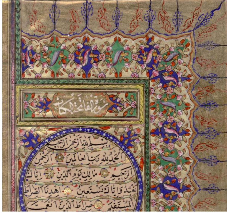
Foto.9: A6876 Envanter Numaralı Kur'an-ı Kerim'in serlevhası, detay