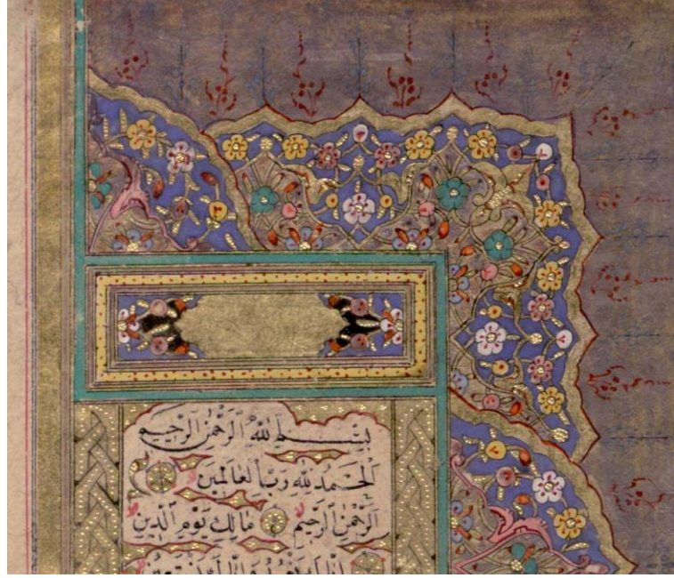
Foto.5: A6721 Envanter Numaralı Kur'an-ı Kerim'in serlevhası, detay