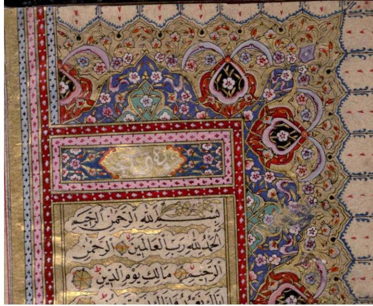
Foto.3: A7340 Envanter Numaralı Kur'an-ı Kerim'in serlevhası, detay