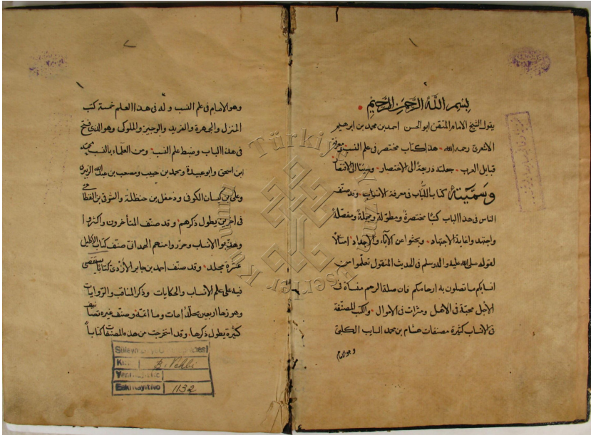
Ek-1 Yazma Nüshadan Bir Görünüm.