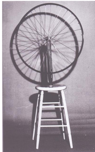
Resim 1: 1913 Duchamp , "Bisiklet Tekerleği"

Duchamp sanat kavramını yaratılmış nesne düşüncesinden ayıran kişidir. Kavramsal Sanat dendiğinde akla ilk gelen kişi de kendisidir. Kavramsal Sanatın düşünsel temelleri Duchamp'ın hazır nene olgusuna , özellikle "çeşme" adlı eserine dayandırılabilir. Sanat nenesi ve gündelik nesnelere arasındaki farkı ortadan kaldırmaya yönelik deneysel bir sistem üretmiştir. Bicycle Wheel adlı çalışmasında ironik bir şekilde heykele özgü bir dil kullanmıştır. Çalışmasında kaide ve heykeli oluşturan nesne arasındaki astlık ve üstlük düzenine itiraz ettiği kadar . geleneksel heykelin ustaca yapılmış bir parodisidir. Bilinen en önemli eseri 1917 'de New York Bağımsız Sanatçılar Topluluğunun sergisine gönderdiği Fountain'dir. Duchamp'a göre onu sanat eseri kılan üzerine imza atması ve müze duvarına tutturarak işlevi dışında kullanmasıdır. Bu durumda bir pisuar sanat yapıtına dönüşebilir.