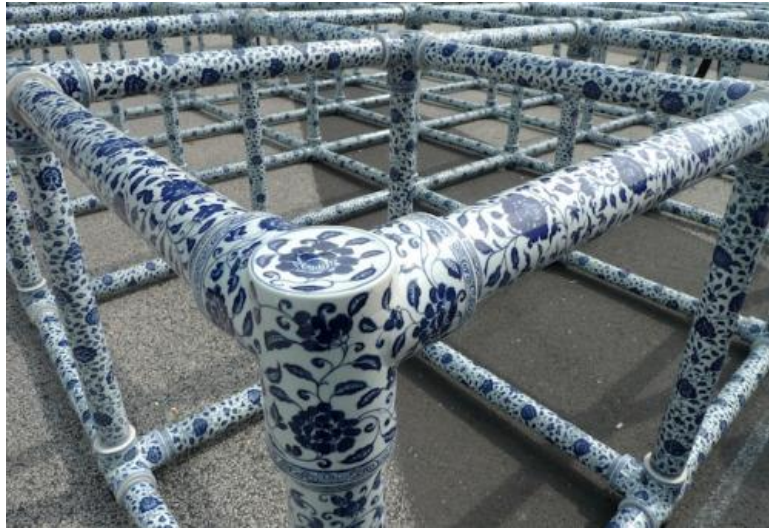
Resim 2: Ai Weiwei ,”Field (Saha)”

AiWeiwei günlük yaşamın yapılarını sanat eserlerine dönüştürür. Sanatçı "Field" adlı çalışmasında geleneksel Çin porseleni kullanır. "Sun flower Seeds" çalışması da Çin'de gerçek boyutlarda ve elde şekillendirilmiş 100 milyon ay çekirdeği kullanmıştır. İzleyiciyi "made in chine" fenomeni ile yüz yüze bırakarak günümüzün ekonomik ve kültürel değişimini sorgular.