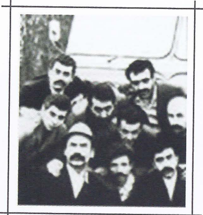
Foto . 1- Otobüs yolcuları mola sırasında bir de hatıra fotoğrafı