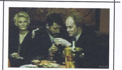
Foto . 4- Seks Klübünde, tuvalette tanıştığı İsveçli ile.