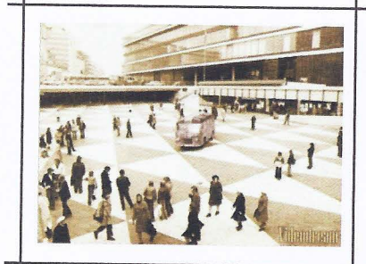
Foto . 2- Otobüs Stockholmün en önemli meydanına bırakılmıştır.