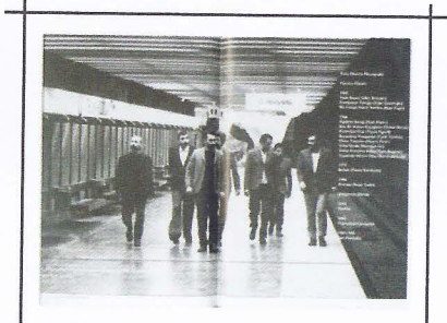
Foto . 3- Kaçaklar metro koridorunda yürürlerken