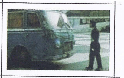
Foto . 5- Otobüs dikkatleri üzerine çekince Polis müdahale ediyor.