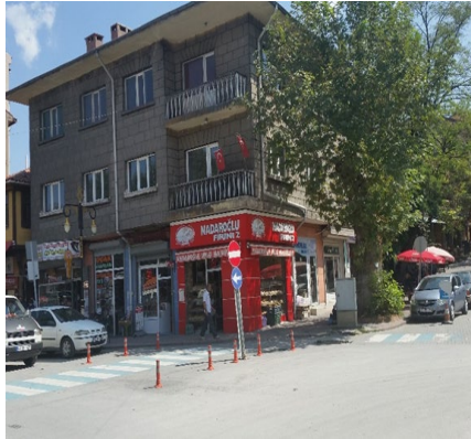
1953'te Kapan'ın yıkılarak yerine yapılan vakıf Apartmanı