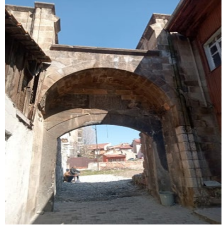
Kapan Hanı'nın Kemerli Giriş Kapısı