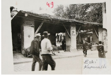
1953'ten Önceki kapanaltı Şimdiki Vakıf Apartmanının Bulunduğu Yer