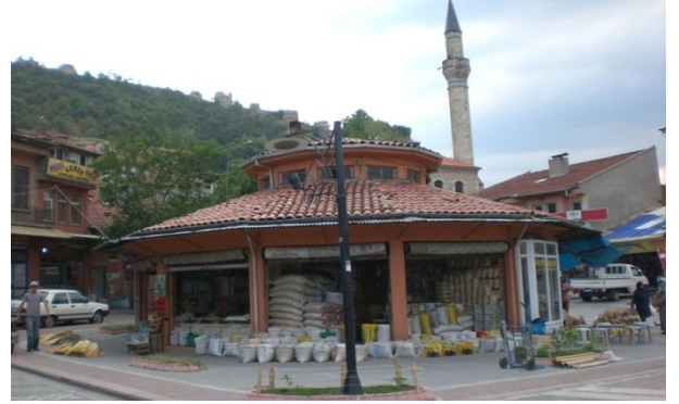
1991 Yılında Yapılan Kapan Binası. Aynı Zamanda Kütahyalıların "Kapanaltı" dedikleri Tahıl pazarı