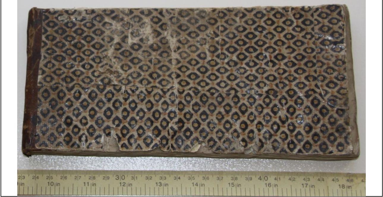
Fotoğraf 1. Başkâtib-zâde Râgıb Bey Âile Mecmû'ası ciltleme şekli.

Cönklerin özelliklerine bakıldığında Başkâtib-zâde Râgıb Bey Âile Mecmû'ası bu özelliklerin bir kısmını ihtivâ etmektedir. Sayfa yapıları, cilt yapıları, numaralandırma kısmı benzemektedir. Başkâtib-zâde Râgıb Bey Âile Mecmû'ası'nın cilt kısmına bakacak olursak (Fotoğraf:1);