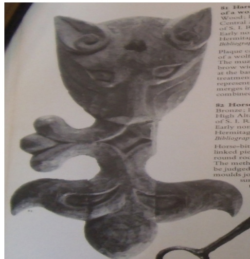
81. Head of a wolf Wood; 16 Central Asia of S. I. R. Early nom Hermitage Bibliograph Plaque car of a wolf. The muse brow wid at the base treatment representa merges in combined 82. Horse Bronze; 16 High Alta of S. I. R. Early nom Hermitage Bibliograph Horse-bit linked pie round rod The meth be judged moulds jo sur ti