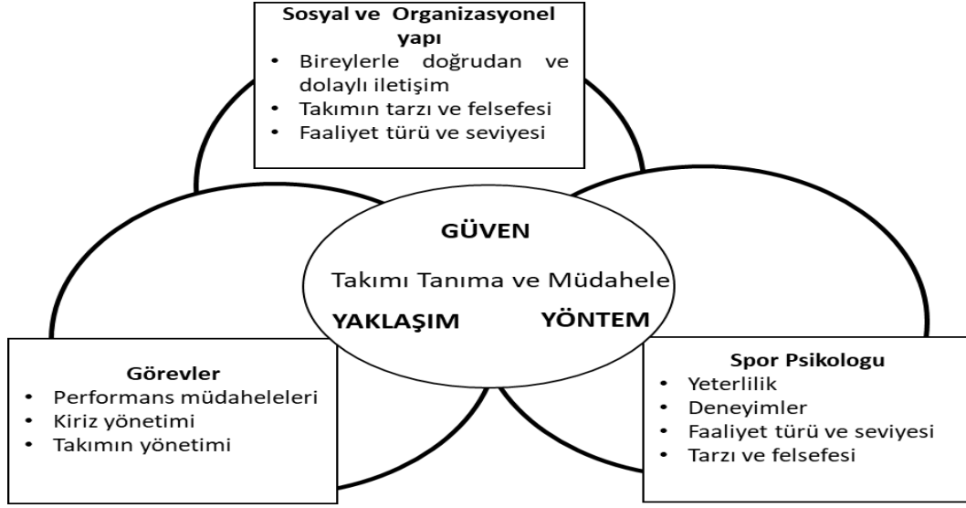
Şekil 2. Takımlarla çalışırken “Güven- Yaklaşım- Yöntem” oluşturmayı belirleyen durumsal bileşenler (Kleinert, ve diğ.,2012:422) ‘den uyarlanmıştır.

Spor takımlarında çalışacak olan bir danışmanın mesleği, bilgisi ve tecrübesi takımlarla çalışmak için çok önemlidir. Bu sebeple, bir spor psikoloğunun veya danışmanın davranışsal tarzını tanımlarken kendi kişisel kaynaklarını yansıtması gerekir. Ayrıca, kişisel kaynaklar ve yetkinlikler yalnızca teşhis veya müdahale araçları yani teknik yeterlilik hakkında değil, aynı zamanda iletişim ve iş birliği becerileri yani sosyal yeterlilik açısından çok önemlidir. Teknik ve sosyal yeterlilik, hem hangi tür araçların uygulanacağına ilişkin kararı hem de teşhis ve müdahale için hedef grubun kararını etkiler. Ayrıca, teknik ve sosyal yeterlilik şeffaflık yani, teşhis ve müdahale düşüncelerini netleştirmek ve izlenebilirlik yani koçluk sürecinin adımlarını açıklamak ile bağlantılıdır (Poczwadowski, ve diğ.,1998).