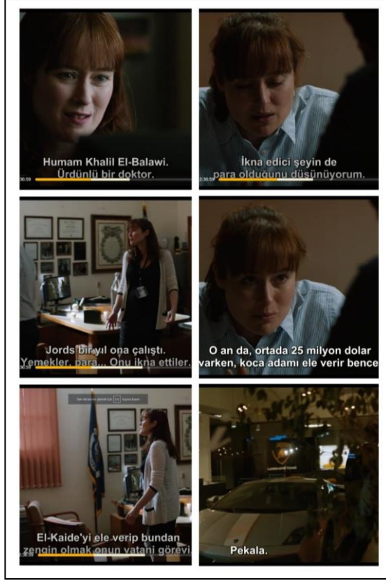
Görsel 4. Filmde Amerikalılar para ile doğuluları satın alabileceklerini düşünürler. Bu durumda doğulular ya da Müslümanlar parayı bulduklarında değerlerine sırt çevirebilecek insanlar olarak gösterilir.