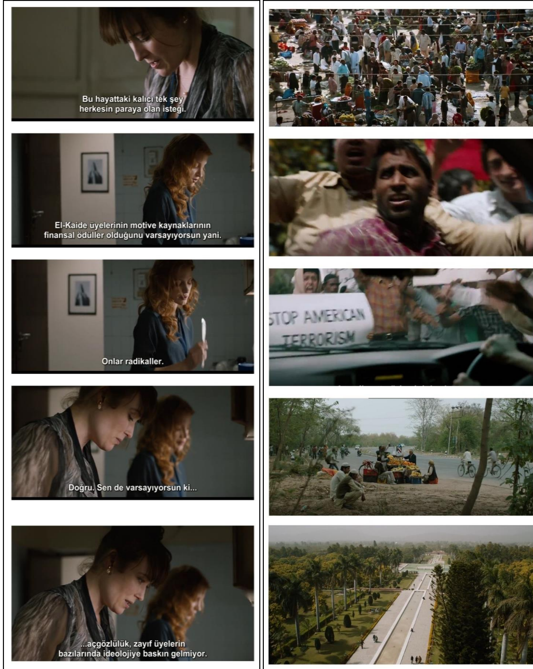
Görsel 5. Filmde Pakistanlılar ilk çağ insanları gibi, eğitimsiz, bilgisiz, donanımsız olarak gösterilirken anonim görüntüler, geniş plan açılar bu söylemi destekler nitelikte kullanılır. Birer radikal olarak tanımlanan doğuhular ya da Müslümanlar Amerikalıların sunacakları parasal motivasyonlarla kendi saflarına çekebilecekleri kişiler olarak görülür.