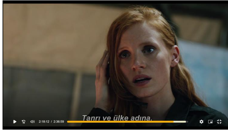
Görsel 2. Filmin kahramanı Maya, mücadele azmini ülke sevgisinden ve inançlarından aldığını gösterir.

Filmi tezinde ideolojik yönleriyle inceleyen Kaymaz'a göre (2018, s129) film terör saldırıları ile İslam'ı bira araya getiren bir kodlamaya sahiptir ve terörün kaynağı de kişileştirilerek Bin Ladin şeklinde sunulmuştur. Kaymaz (2018)'a göre filmde 11 Eylül'e doğrudan bir atıf bulunmamakla birlikte genel bir terör sorunundan bahsedilir ve bir dizi patlama ile terör faaliyetlerinin süre giden yapısına vurgu yapılır. Amerikalılar filmde oldukça kararlı, bilgili, tutkulu, etkili düşüncelere ve inanca sahip kişiler olarak sunulur.