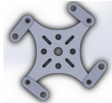
Şekil 4. Gövde-Kol ilk montaj (Body-Arm first assembly)

Dronun sorunsuz bir şekilde havada kalabilmesi için ağırlığın, motor güçlerinin, gövde yapısının ve uçuş kontrolünün rolleri çok önemlidir. Drona kullanılacak motorların ve ESC (Elektronik Hız Kontrolü)'lerin uyumlu olması, herhangi bir fiziksel hatanın olmaması durumunda, dron sorunsuz bir şekilde uçacaktır.