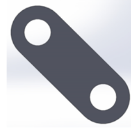
Şekil 3. Hareketli kol ön tasarımı (First design of movable arm)

Gövde ön tasarıma montaj edilecek hareketli kollar Şekil 3’de gösterilmektedir. Ana gövde ile kolların bağlantı yerlerine montaj edilecek olan servo motorlar sayesinde kollar saat yönünde ve tersi yönde hareket edecektir.