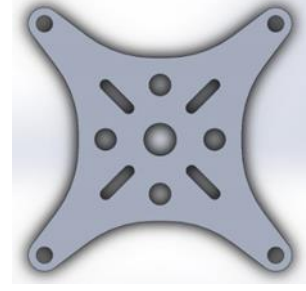
Şekil 2. Dron gövdesi ön tasarımı (First design of drone frame)

Aşağıda Şekil 2’de dronun gövde ön tasarımı yer almaktadır. Bu tasarıma hareket eden kolların eklenmesi ile gövde tasarımı son halini almış olacaktır.