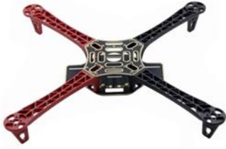
Şekil 1. Quadcopter gövdesi (Quadcopter frame)

Şekil 1’de piyasada yaygın kullanılan ABS (Akrilonitril Bütadien Stiren) plastikten üretilmiş quadcopter gövdesi görülmektedir. Bu çalışma ile quadcopter gövdesinin kollarına yerleştirilen mafsal ve motor sayesinde, kolların hareket etmesi sağlanacak ve dron havada iken gövde şekli değiştirilecektir.