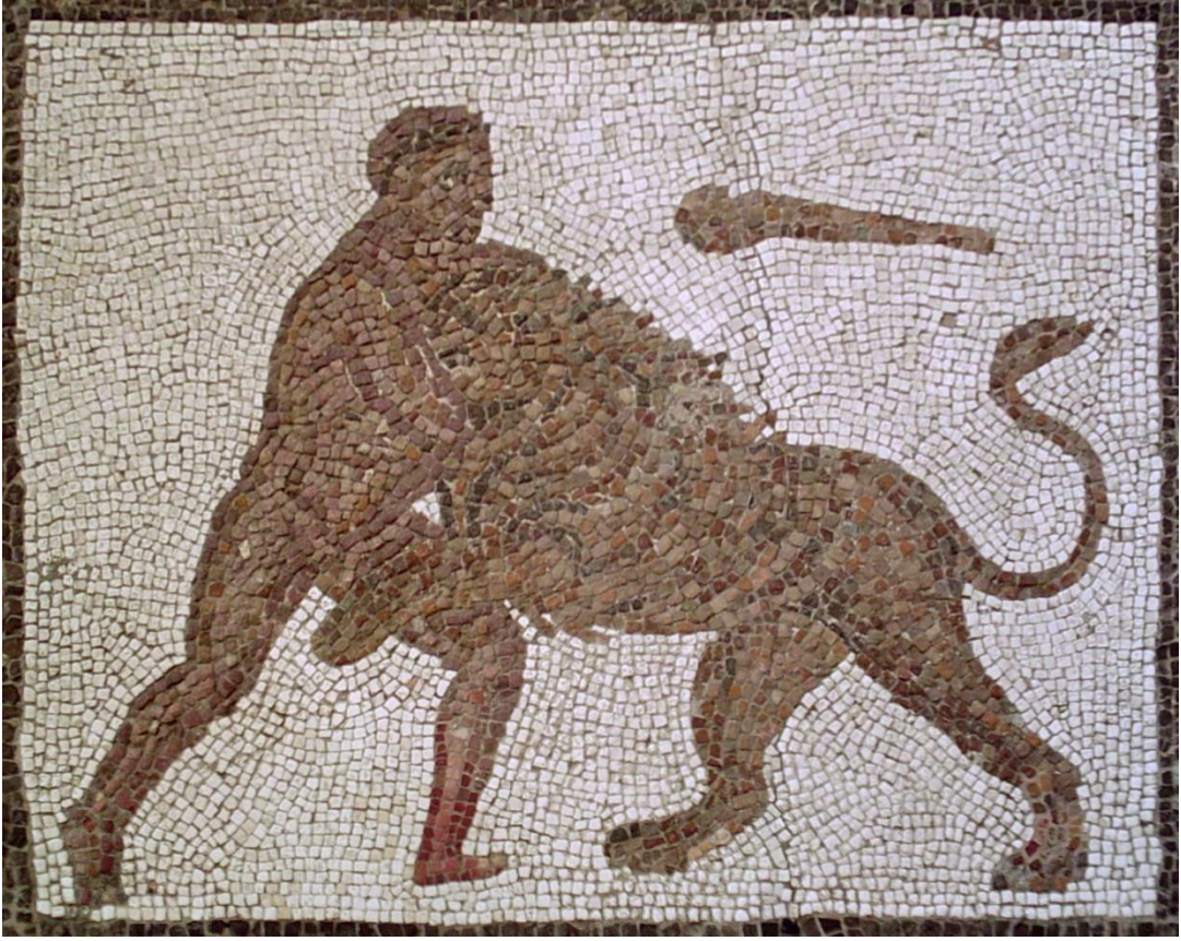
Resim 2: National Museum of Spain, Madrid Müzesi'nde M.S. 3. yüzyıl Roma İmparatorluk Dönemi'ne ait Hercules'in Nemea Aslanı'nı öldürürken sahnelendiği mozaik. ( https://www.theoi.com/Gallery/Z26.1G.html , 9 Mayıs 2021).