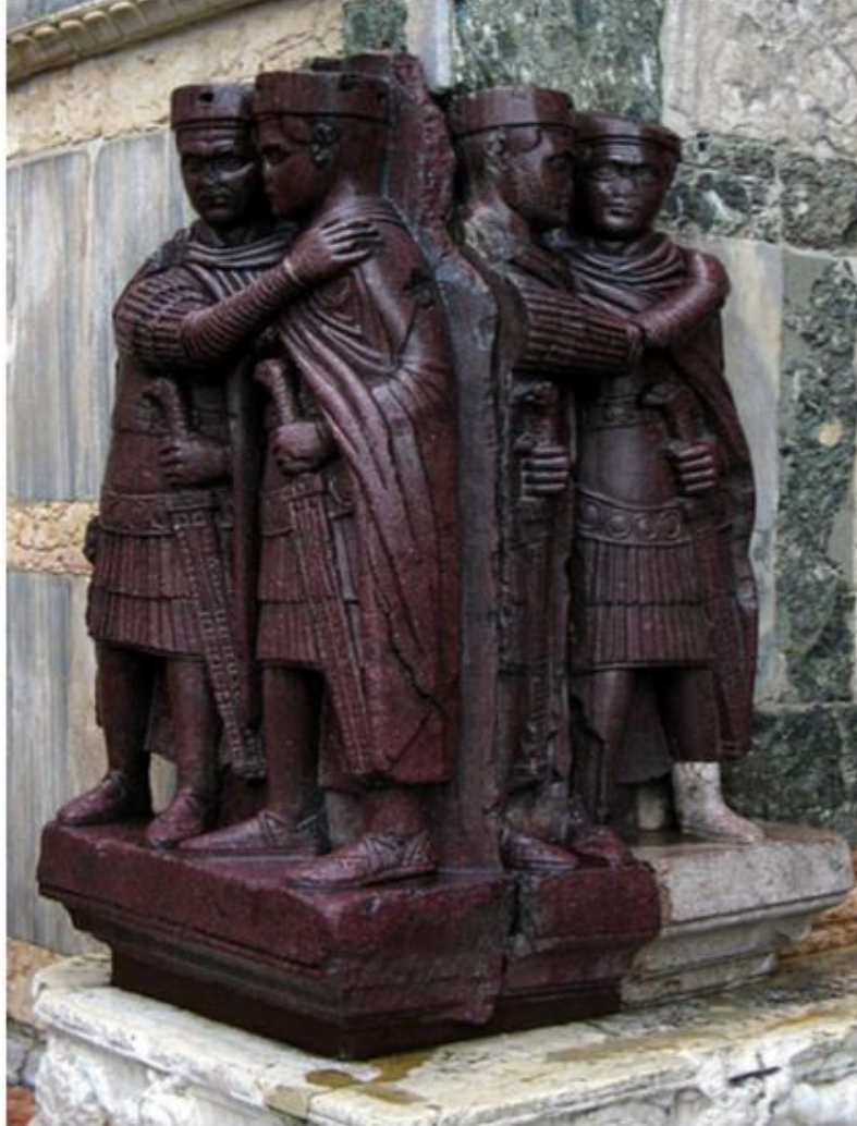
Resim 1: Venedik'te bulunan San Marco Bazilikası'nın sağ köşesinde yer alan Tetrarchia'yı temsil eden Diocletianus, Maximianus, Galerius ve Constantius'un bulunduğu heykel grubudur.