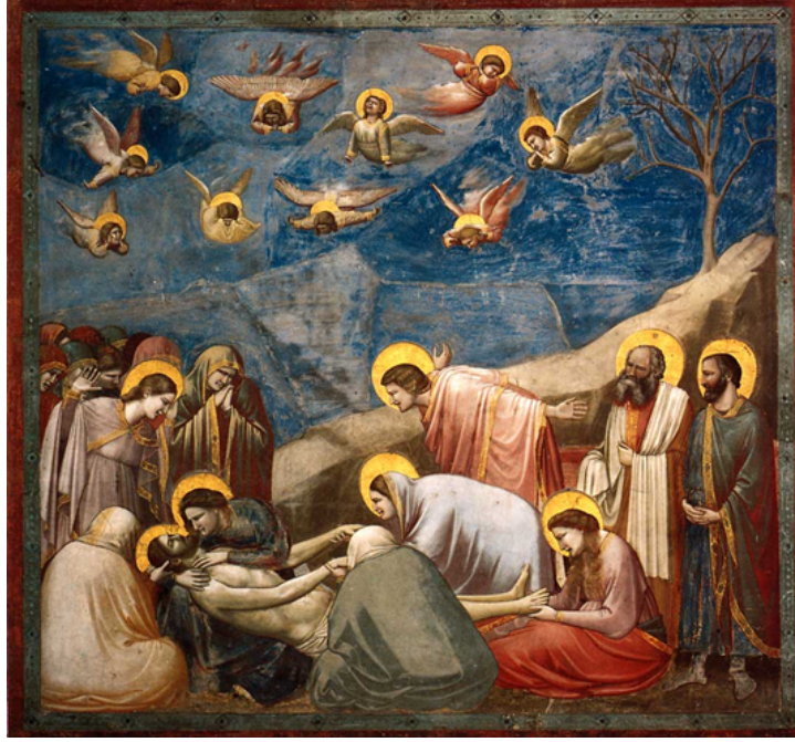
Görsel 3. Giotto di Bondone, “İsa Mesih İçin Ağlayanlar”, 1304-06, Fresk, Capella Scrovegni (Arena Şapeli), Padua.

Dışavurumculuk bir akım olarak ancak 20. Yüzyılın başında Almanya’da ortaya çıkmıştır. Almanya’nın birinci dünya savaşı gibi büyük bir savaştan yenilgiyle çıkması, büyük İmparatorluğun çöküşü, sanayi devriminin etkileri, modern kentleşmenin tuhaflığı dışavurumcu sanatçıların resimlerinin konuları olmuştur. Dışavurumculuk birçok faktörün ardından ortaya çıkmış olması sebebiyle yeni yüzyılın yaşam biçimi olarak görülmeye başlanmıştır. Bu bağlamda da yaygın bir eğilim olarak ele alınabilecek gelişmeler bütünü dışavurumculuk ana başlığı altında birçok farklı alt başlıklarda gelişim göstermiştir. Antmen (2008)’e göre “20. yüzyıl başında Fransa’da “Fovizm” Almanya’ da “Die Brücke” ve “Der Blaue Reiter” gibi sanatçı gruplaşmalarının ortak noktası, 1911 yılında Berlin’de dönemin avangard sanatını destekleyen galeri ve dergi Der Sturm’un sahibi Herwarth Walden’in gözlemlendiği gibi, “dışarının izlenimi yerine, içerinin dışavurumuna yönelmeleridir”.