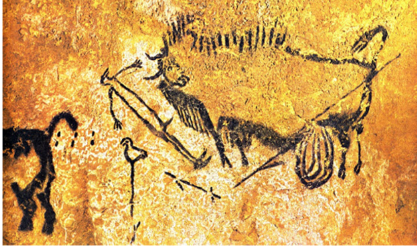
Görsel 2. Lascaux Mağarası Duvar Resmi, Fransa, M.Ö 10.000-15.000

Unesco Dünya Miras listesinde yer alan Lascaux mağarası en iyi korunmuş mağaralardan biridir. Resimde (Görsel 2) vurulmuş halde betimlenen bir hayvan figürü ve önünde duran çöp adam denilebilecek kadar basit çizilmiş bir insan figürünün birbiri içinde zıtlık oluşturduğu görülmektedir. Burada, ilkel insanın doğanın gücü karşısında kendisinin aciz ve çaresizliğini dışa vurmuş en açık örneği görülmektedir. Hayvan figürünün üzerindeki detaycılığın karşın insan figüründeki yalınlık ve basitlik ilkel insanın algılayışını ve ifadesini ortaya koymaktadır.