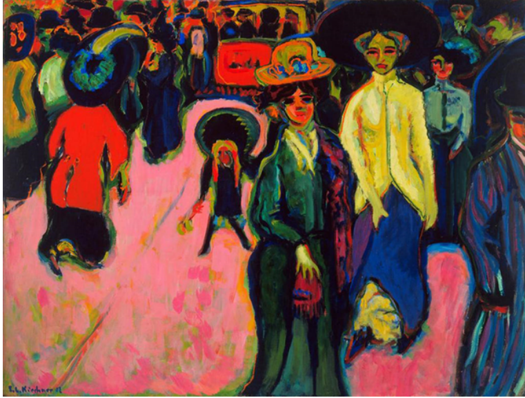
Görsel 5. Ernst Ludwig Kirchner, "Street Dresden", Tuval Üzerine Yağlıboya, 1908, MOMA.

Ernst Ludwig Kirchner'ın "Street Dresden" gerilim yayan resmidir (Görsel 5). Kalabalık bir Dresden sokağının sanatçının gözünden kentsel koşutmanın, kalabalıklar içindeki yalnızlığın dışavurumunu göstermektedir. Zıt renklerin hâkim olduğu, yoğun pembenin kullanımı dar bir alanda sıkışık yerleştirilmiş insan figürleri ve figürlerdeki yapay, ifadesiz yüzler cesurca yansıtılmıştır.