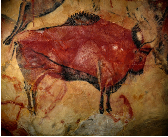
Görsel 1. Altamira Mağarası Duvar Resmi, Altamira Mağarası, İspanya 19.000-15.000