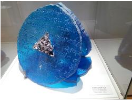
Resim 4. Fatma Çiftçi, 'Inconsolable'

“Sanatsal çalışmamda çıkış noktam, Fatma Çiftçi'nin 'Inconsolable' adlı eserinin (Resim 4), biçim, renk ve eserinde kullandığı imgeleridir. Eserde yuvarlak bir camın ortasında kurşun döküm bulunmaktadır. Bu kurşun imgesini sanatsal çalışmamda kullandım. Inconsolable eserindeki cam mavi olduğu için ben de çalışmamda mavi ve tonlarını içeren renkler kullandım. Ayrıca eserin üzerinde bulunan yazı imgelerinden yola çıkarak kolaj tekniğini kullandım ve çalışmamı yazı içeren malzemelerle destekledim. Böylece daha zengin bir görünüm kazanmış oldu”