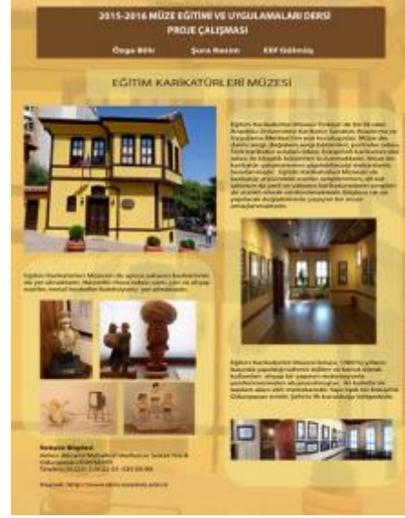
Resim 1. Çağdaş Cam Sanatları Müzesine İlişkin Poster Resim 2. Eğitim Karikatürleri Müzesine İlişkin Poster

Müze rehberi, müze ziyareti öncesi bazı etkinliklerle birlikte müzede gerçekleştirilecek etkinlik ve uygulamaları içeren, müze ziyaretini etkin ve eğlenceli bir sürece dönüştürmeye yardımcı bir materyaldir. Müze rehberi içerisinde çalışma yapraklarının yanı sıra müze ile ilgili kısa bilgiler ve müzeye ilişkin öğrenci hazır bulunuşluğunu ve ziyaret sonrası elde edilen kazanımları belirlemeye yarayan ön anket ve son anket gibi kısımlar da yer almaktadır. Bu ders kapsamında her öğrenci grubu ele aldığı müzeye dair bir müze rehberi (Resim 3) oluşturmuştur.