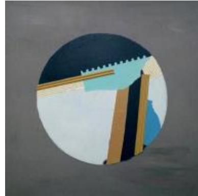
Resim 5. Öğrenci Çalışması

Eskişehir Kent Belleği Müzesi'ndeki fotoğraf ve belgesellerden yola çıkarak sanatsal çalışma (Resim 6) gerçekleştiren bir başka öğrenci ise bu uygulamada kültürel bir sorgulama