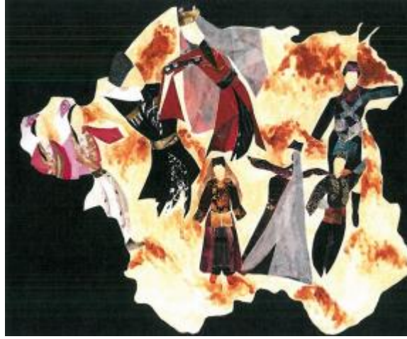
Resim 6. Öğrenci Çalışması

“Çalışmam 45x60 cm boyutunda olup, kâğıt üzerine karışık teknikle yapılmıştır. Çeşitli renkli kâğıtlardan küçük parçalar keserek ve bunları bir araya getirip yapıştırarak yöresel kostümler giymiş figürler çalıştım. Figürleri şematik bir Eskişehir haritası içine yerleştirdim. Bu çalışmayı yaparken, farklı kâğıtların bir araya gelerek yakaladığı uyumla; farklı etnik kökenlere sahip halkların kültürlerini bir araya getirerek ortaya çıkardıkları ahengin birbirine ne kadar benzediğini anlatmak istedim”.