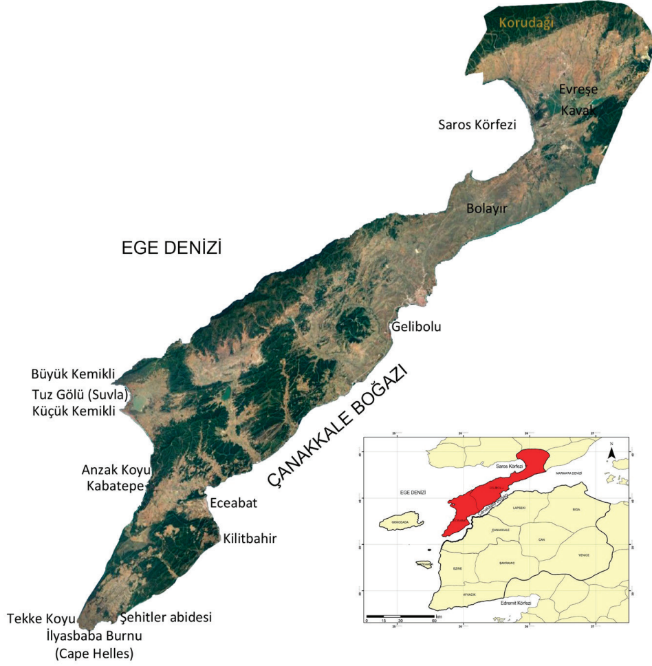
Şekil 1. Araştırma alanının haritası.

sulak alan içinde yer almaktadır. Deltada, kumluk ve çakıllık kıyı kumullarına rastlanmaktadır. Akdeniz ikliminin Avrupa kıtasındaki 18 en iyi kumul alan temsilcilerinden biri olarak kabul edilmektedir (Uslu ve Bal, 1994; Kelkit ve Öztürk, 2005).