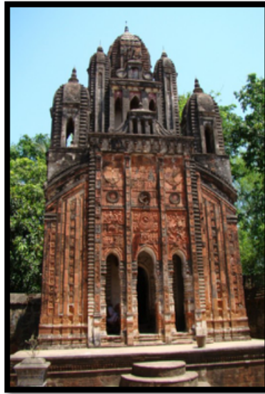
Görsel 16. Choto Taraf Tapınağı, Hadal Narayanpur- Bankura

Navarathna tarzı tapınaklar Pancha-ratna stili tapınaklardan türetilerek oluşturulmuştur. Pancha-ratna biçiminde bulunan ortadaki büyük kulenin üzerine dört adet daha küçük kuleler eklenmiştir. Böylelikle dokuz kuleden oluşan tapınaklar Navarathna olarak adlandırılmıştır. Hadal Narayanpur'da bulunan Choto Taraf Tapınağı Navarathna mimari yapısına örnek teşkil etmektedir. Tapınağın üçlü kemer girişinin ortada yer alan ana panelinde ana girişinde Mahabharata destanından epik bir sahne terakota plakalara kabartma tekniği kullanılarak betimlenmiştir.