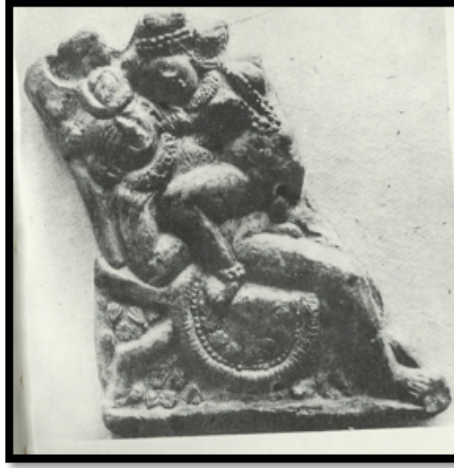
Görsel 3. Tamluk'ta bulunan terakota kabartma

Hindistan dinsel sanatının örneklerinde seksüel anlatımların da oldukça ön planda olduğu görülmektedir. Bir geleneğin eskilere ait parçaları olarak değerlendirilen seksüel imgeler taşıyan terakota örnekler tanrıların çiftleşmelerini ya da fantezi dünyalarına dair izler taşımaktadır (Desai, 1985:9-14).