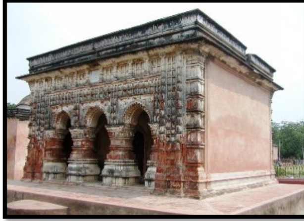
Görsel 20. Rupesvara Tapınağı

çatılı tapınaklarda terakota kaplamaları nadir olarak görülmektedir. 5 Bu örneklerden birisi de Kalnada bulunan Rupesvara Tapınağıdır. Tapınakta terakota kaplamalar sadece ana giriş bölümünde görülmektedir.