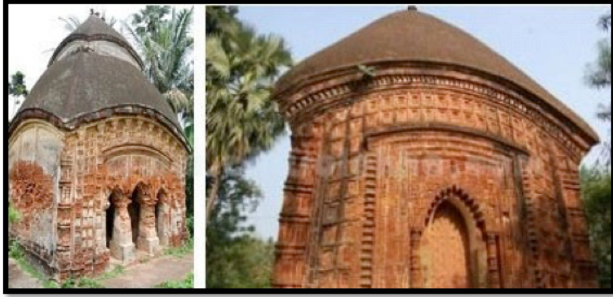
Görsel 9. Char-chala ve "At-chala" tapınak örnekleri

Aynı stil ve büyüklükteki yapıların yan yana dizilmesiyle oluşan tapınaklar gruplandırılarak değerlendirilmektedir. Diğer bir "Grup" tapınak örneği de ortak bir avluya bakan ancak farklı biçimlerde inşa edilmiş tapınaklardır. Gruplandırılmış on iki adet "At-chala" tarzında inşa edilmiş ve Kral Şiva'ya adanmış yüz sekiz adet tapınak ve yirmi beş farklı tapınaktan oluşan Sukhariada bulunan Anandabhairavi tapınağı, Kalna'da yer alan Rajbari tapınak kompleksi, Sri-bati tapınak kompleksi ve Pratepeshwar Tapınağı grup tapınak örnekleri arasında yer almaktadır. 3 Kral Şiva'ya adanmış tapınaklar Mihrace Teja Chandra Bahadhur tarafından 1809 yılında yapılmıştır. Bu tapınaklar teşbih boncuklarını andıracak şekilde bitişik olarak dizilmiş iki daireyi oluşturacak biçimde yerleştirilmişlerdir. Tapınakların duvarlarında Ramayana ve Mahabharata destanlarından hikayeler ve av sahneleri terakota karolar üzerine betimlenmiştir.