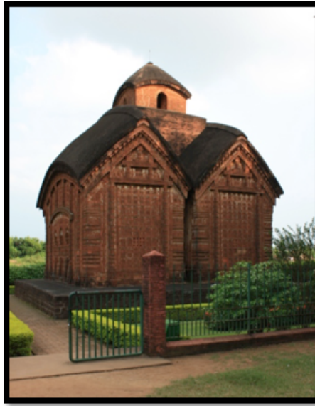
Görsel 6. Jor Bangla-Kesta Rai Tapınağı, Bishnipur / Hindistan

“Ek Bangla” olarak adlandırılan grupta yer alan tapınakların genel özelliği iki adet eğimli çatıdan oluşmasıdır. On altıncı ve on dokuzuncu yüzyıllar arasında Vishnupur(Bishnupur) şehri sanatın da yöneticisi olarak bilinen Malla kralları tarafından yönetilmiştir (Perryman, 2000:171). Bu dönemde Malla Kralı Raghunath Singh tarafından yaptırılmış olan Jor Bangla-Kesta Rai Tapınağı “Ek Bangla” tapınak yapısında inşa edilmiştir. İki farklı çatısı bulunan yapı ortada yer alan tek bir kule tarafından birleştirilmiştir. Tapınak bir metre yüksekliğindeki laterit taş üzerine inşa edilerek tüm dış yüzeyi terakota plakalarla kaplanmıştır. Dış cephelerde yer alan terakota plakalar, Hindu dininde yer alan insan yaşamına ait hikayeleri, tanrı ve tanrıçaların tasvirlerini, hayvan, çiçek ve geometrik süslemelerden oluşmaktadır.