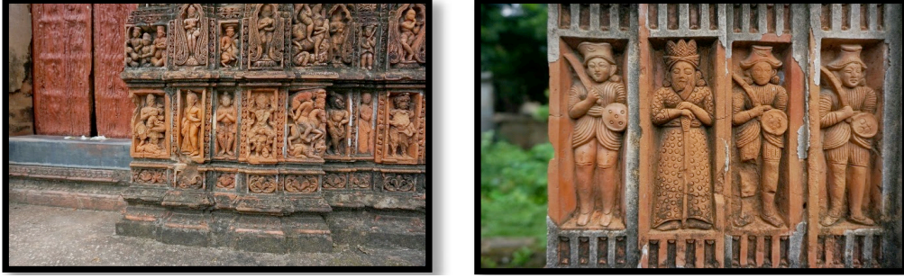
Görsel 11. Bengal'de bulunan Sribati Tapınak Kompleksi- terakota detaylar

Ek-ratna stili tapınaklar sivri tepeleri ve kuleli yapılarıyla At-chala tarzı tapınakları andırsalar da kulenin altında kalan çatının basık yapısı ile birbirlerinden ayrılmaktadırlar. Bishnupur'un en büyük tapınaklarından biri olarak bilinen Madan-Mohan Tapınağı 1694 yılında Malla Kralı Durjana Singha tarafından yaptırılmıştır (Perryman, 2000:172). 'Ek-ratna' (tek kule) biçiminde inşa edilmiş olan tapınak Hinduizmde bulunun Puranalar ile Ramayana ve Mahabharata destanlarında yer alan anlatımların sahnelendiğı terakota birimlerle kaplanmıştır. Ana tapınağın dört tarafı duvarlarla çevrilmiş ve üç girişinde de büyük çaplı ikişer adet revak bulunmaktadır. Revak sütunlarının üzerinde Kral Rama ve Hindu tanrıların maymunlarla yapmış olduğu mitolojik savaş tasvir edilmiştir. Aynı zamanda tapınağın dış cephesinde bulunan terakota karoların ve sütunların üzerinde çeşitli çiçek, kuş betimlemeleri ile Kral'ın romantik sahneleri bulunmaktadır. Radha Shyam ve Lalji tapınakları da Ek-ratna biçimine örnek olmaktadır.