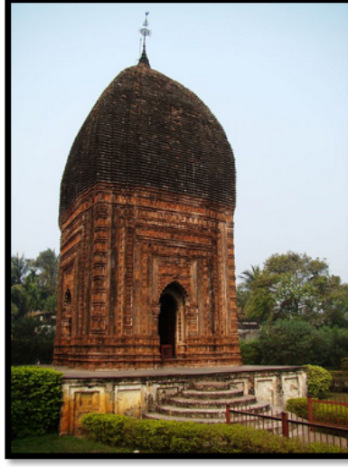
Görsel 18. Pratapeswar Tapınağı, Kalna

Sekizgen olarak tasarlanmış tapınaklar da Hindistan'da bulunan tapınak çeşitleri arasında yer almaktadır. Yaygın olarak tercih edilmeyen sekizgen yapı biçimi Rekha ve Pidha Deuls şeklindeki gibi bir inşa yöntemi kullanmıştır. Ancak sekizgen tapınaklarda Rekha ve Pidha Deuls tapınaklarında olduğu gibi bir yüksek kavisli çatı sistemi kullanılmamıştır. Sekizgen tapınakların çatılarındaki kavis daha alçak ve basık bir görünümdeydir. Birbhum Bölgesi, Ilambazar'da yer alan Mahaprabhu tapınağı nadir görülen sekizgen tapınaklardan biridir. Aynı bölgede yer alan bir diğer sekizgen tapınak ise Chandranatha-Shiva Tapınağıdır. Bu eşi görülmemiş bir şekilde tapınak sekizgen tapınak mimarisi ile Navarathna tarzının etkileyici uyumunu göstermektedir.