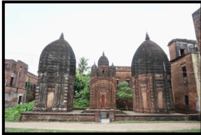
Görsel 10. Bengal'de bulunan Sribati Tapınak Kompleksi

Aynı stil ve büyüklükteki yapıların yan yana dizilmesiyle oluşan tapınaklar gruplandırılarak değerlendirilmektedir. Diğer bir "Grup" tapınak örneği de ortak bir avluya bakan ancak farklı biçimlerde inşa edilmiş tapınaklardır. Gruplandırılmış on iki adet "At-chala" tarzında inşa edilmiş ve Kral Şiva'ya adanmış yüz sekiz adet tapınak ve yirmi beş farklı tapınaktan oluşan Sukhariada bulunan Anandabhairavi tapınağı, Kalna'da yer alan Rajbari tapınak kompleksi, Sri-bati tapınak kompleksi ve Pratepeshwar Tapınağı grup tapınak örnekleri arasında yer almaktadır. 3 Kral Şiva'ya adanmış tapınaklar Mihrace Teja Chandra Bahadhur tarafından 1809 yılında yapılmıştır. Bu tapınaklar teşbih boncuklarını andıracak şekilde bitişik olarak dizilmiş iki daireyi oluşturacak biçimde yerleştirilmişlerdir. Tapınakların duvarlarında Ramayana ve Mahabharata destanlarından hikayeler ve av sahneleri terakota karolar üzerine betimlenmiştir.