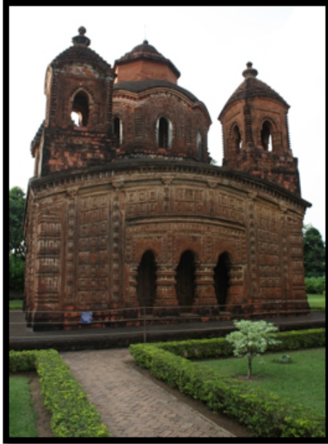
Görsel 14. Shyam Rai Tapınağı, Bishnipur / Hindistan

Köşelerde dört adet küçük ve ortada bir adet büyük kuleden oluşan tapınaklar Pancha-ratna olarak isimlendirilmektedir. 1643 yılında Malla Kralı Raghunath Singha tarafından yaptırılan Shyam Rai Tapınağı önemli Pancha-ratna terakota örneklerindedir. Tapınağın dört tarafında da üç kemerli girişler bulunmakta ve dış cephelerin hepsi terakota plakalar ile kaplanmıştır. Plakalar üzerinde Tanrı Krişna ve Rahda'nın sevişme sahneleri bulunmaktadır.