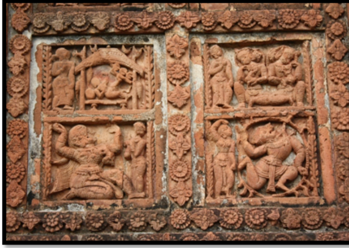
Görsel 7. Jor Bangla-Kesta Rai Tapınağı –detay, Bishnipur / Hindistan