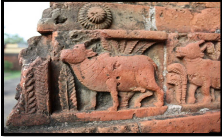
Görsel 13. Madan-Mohan Tapınağı, detay, Bishnipur / Hindistan

Köşelerde dört adet küçük ve ortada bir adet büyük kuleden oluşan tapınaklar Pancha-ratna olarak isimlendirilmektedir. 1643 yılında Malla Kralı Raghunath Singha tarafından yaptırılan Shyam Rai Tapınağı önemli Pancha-ratna terakota örneklerindedir. Tapınağın dört tarafında da üç kemerli girişler bulunmakta ve dış cephelerin hepsi terakota plakalar ile kaplanmıştır. Plakalar üzerinde Tanrı Krişna ve Rahda'nın sevişme sahneleri bulunmaktadır.