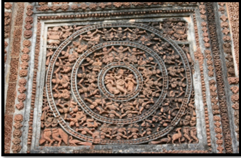
Görsel 15. Shyam Rai Tapınağı, detay, Bishnipur / Hindistan

Navarathna tarzı tapınaklar Pancha-ratna stili tapınaklardan türetilerek oluşturulmuştur. Pancha-ratna biçiminde bulunan ortadaki büyük kulenin üzerine dört adet daha küçük kuleler eklenmiştir. Böylelikle dokuz kuleden oluşan tapınaklar Navarathna olarak adlandırılmıştır. Hadal Narayanpur'da bulunan Choto Taraf Tapınağı Navarathna mimari yapısına örnek teşkil etmektedir. Tapınağın üçlü kemer girişinin ortada yer alan ana panelinde ana girişinde Mahabharata destanından epik bir sahne terakota plakalara kabartma tekniği kullanılarak betimlenmiştir.