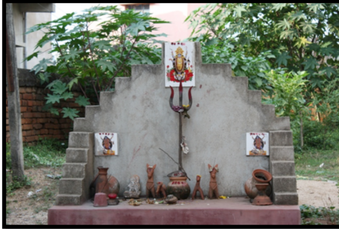
Görsel 5. Mahalle arasında yer alan sunak, Bishnipur / Hindistan

Hindu sanatının en önemli özelliklerinden biri eşsiz görselleştirme gücüdür. Özellikle mitlere dayalı olan Hinduizm'de zihinde tasavvur edilen tanrılar, onların özellikleri, hikayeleri Hindu sanatında sanatçıların imgeleştirme yetenekleri ile benzersiz bir şekilde somutlaştırılmıştır (Goetz, 1964:148-149). Sanatçılar tarafından iki ve üç boyutlu formlar olarak biçimlendirilen tanrı formları başta büyük tapınaklar olmak üzere günlük yaşam alanlarında bulunmaktadır.