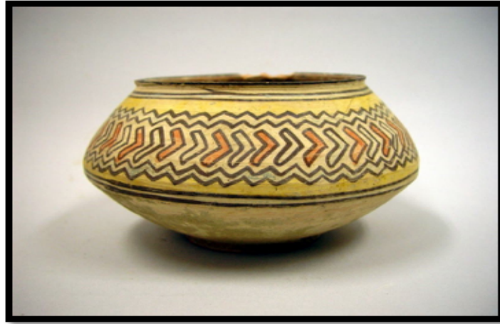
Görsel 2. İndüs Vadisi'nde bulunan çok renkli kilden yapılmış kap

İndüs Vadisi'ne ait seramik örneklerde dikkat çeken diğer bir özellik de kilden yapılmış mutfak gereçlerinin çömlekçi çarkı kullanılarak şekillendirilmesidir. Tıpkı figürünlerde olduğu gibi mutfak gereçlerinde de geometrik ve tekrarlanan dekoratif öğeler görülmektedir. Ancak figürünlerde sadece siyah ve kırmızı renk kullanılmışken mutfak gereçlerinde mavi, yeşil ve sarı gibi renkler de kullanılmıştır.