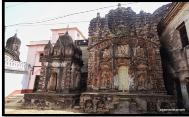
Görsel 21. Goverdhan Tapınağı, Mancha örneği Bhadrakara, Kotulpur

Tapınakların yakınlarında “mancha” adı verilen tapınaklardan daha küçük boyutlu yardımcı yapılar bulunmaktadır. Mancha’ların tek tip bir biçimsel özelliği bulunmamaktadır. Ancak genellikle yüksek dikmelerden oluşan kemerli bir mimarisi bulunmaktadır. Mancha yapılarında tıpkı tapınaklarda olduğu gibi dış cephelerinde terakota kaplamalar görülmektedir.