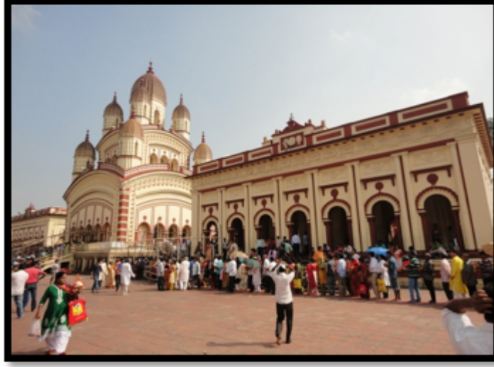
Görsel 4. Dakshineswar Kali Tapınağı, ana tapınak, Kalküta/ Hindistan

Hindu sanatının en önemli özelliklerinden biri eşsiz görselleştirme gücüdür. Özellikle mitlere dayalı olan Hinduizm'de zihinde tasavvur edilen tanrılar, onların özellikleri, hikayeleri Hindu sanatında sanatçıların imgeleştirme yetenekleri ile benzersiz bir şekilde somutlaştırılmıştır (Goetz, 1964:148-149). Sanatçılar tarafından iki ve üç boyutlu formlar olarak biçimlendirilen tanrı formları başta büyük tapınaklar olmak üzere günlük yaşam alanlarında bulunmaktadır.