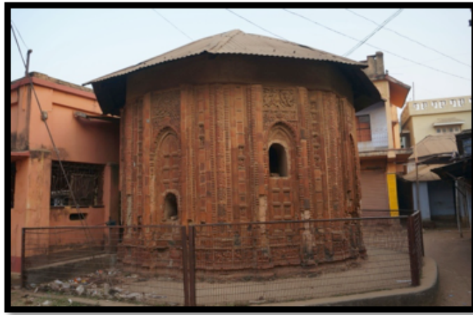
Görsel 19. Mahaprabhu Tapınağı

Sekizgen olarak tasarlanmış tapınaklar da Hindistan'da bulunan tapınak çeşitleri arasında yer almaktadır. Yaygın olarak tercih edilmeyen sekizgen yapı biçimi Rekha ve Pidha Deuls şeklindeki gibi bir inşa yöntemi kullanmıştır. Ancak sekizgen tapınaklarda Rekha ve Pidha Deuls tapınaklarında olduğu gibi bir yüksek kavisli çatı sistemi kullanılmamıştır. Sekizgen tapınakların çatılarındaki kavis daha alçak ve basık bir görünümdeydir. Birbhum Bölgesi, Ilambazar'da yer alan Mahaprabhu tapınağı nadir görülen sekizgen tapınaklardan biridir. Aynı bölgede yer alan bir diğer sekizgen tapınak ise Chandranatha-Shiva Tapınağıdır. Bu eşi görülmemiş bir şekilde tapınak sekizgen tapınak mimarisi ile Navarathna tarzının etkileyici uyumunu göstermektedir.