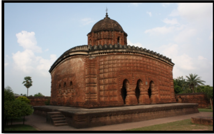
Görsel 12. Madan-Mohan Tapınağı, Bishnupur / Hindistan

Ek-ratna stili tapınaklar sivri tepeleri ve kuleli yapılarıyla At-chala tarzı tapınakları andırsalar da kulenin altında kalan çatının basık yapısı ile birbirlerinden ayrılmaktadırlar. Bishnupur'un en büyük tapınaklarından biri olarak bilinen Madan-Mohan Tapınağı 1694 yılında Malla Kralı Durjana Singha tarafından yaptırılmıştır (Perryman, 2000:172). 'Ek-ratna' (tek kule) biçiminde inşa edilmiş olan tapınak Hinduizmde bulunun Puranalar ile Ramayana ve Mahabharata destanlarında yer alan anlatımların sahnelendiğı terakota birimlerle kaplanmıştır. Ana tapınağın dört tarafı duvarlarla çevrilmiş ve üç girişinde de büyük çaplı ikişer adet revak bulunmaktadır. Revak sütunlarının üzerinde Kral Rama ve Hindu tanrıların maymunlarla yapmış olduğu mitolojik savaş tasvir edilmiştir. Aynı zamanda tapınağın dış cephesinde bulunan terakota karoların ve sütunların üzerinde çeşitli çiçek, kuş betimlemeleri ile Kral'ın romantik sahneleri bulunmaktadır. Radha Shyam ve Lalji tapınakları da Ek-ratna biçimine örnek olmaktadır.