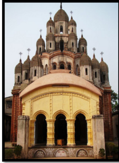
Görsel 17. Gopal Bari Tapınağı

“Yağmurdan, güneşten korunmak için yapılan ve arkası bir duvara verilen çatı” 4 olarak tanımlanan sundurma pek çok Hindu tapınağında görülen bir özelliktir. Bir sırtı duvara dayalı olan yapısı bulunan tapınaklar Sundurmalı (Porches) Tapınaklar olarak adlandırılmaktadır. Sundurmalar, tapınaklarda ziyaretçilerin ve ibadet edenlerin sosyalleştiği ve yiyecek içecek servislerinin yapıldığı mekanlar olarak kullanılmaktadır. Bazı terakota tapınaklarda, sundurma tapınağın bir parçası olarak, tapınakla aynı şekilde dekore edilmiş iken bazı tapınaklarda daha gösterişli bir biçimde bulunmaktadır. Kalna'da bulunan Gopalji Tapınağı sundurmalı tapınak örnekleri arasında yer almaktadır.