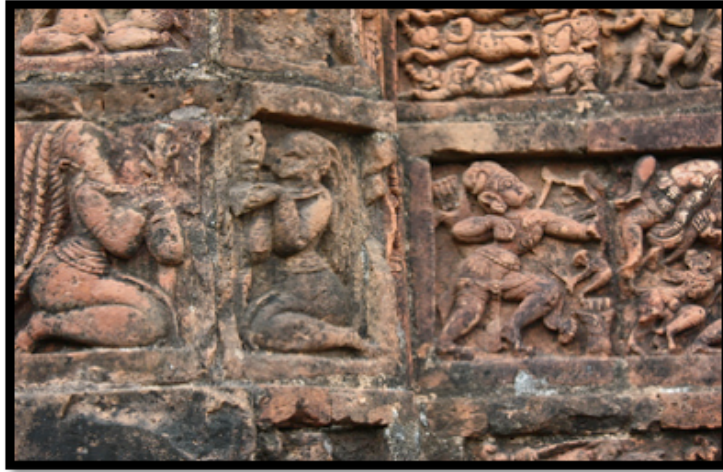
Görsel 8. Jor Bangla-Kesta Rai Tapınağı –detey, Bishnipur / Hindistan

Dört adet üçgen kavisli çatının tek bir noktada birleştiği çatı tasarımından oluşan tapınaklar Char-chala olarak adlandırılmaktadır. Bu tapınaklar genellikle dar ve bindirmeli tonozlardan ve uzun kaidelerin taşıdığı merkezi bir kubbe yapısından oluşmaktadır. Char-chala tarzı inşa edilmiş tapınaklar Bengal bölgesinin batısında görülmektedir. Eğer Char-chala mimarisinde yapılmış tapınağın çatısının üzerine minyatür bir tapınak daha inşa edilirse tapınak biçimi “At-chala” olarak değişmektedir.