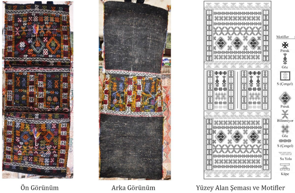
Görsel 7. Heybe Örneği 6, 2014, Antalya/Muratpaşa/Kaleiçi (Eroğlu, 2014b)