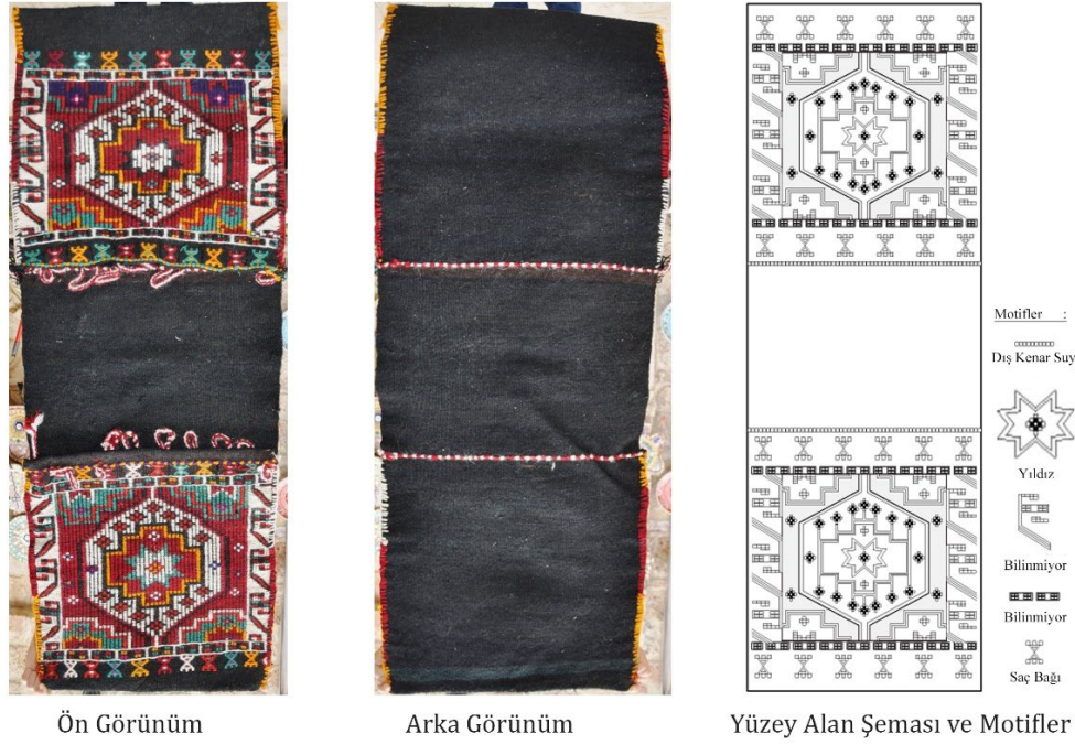
Görsel 3. Heybe Örneği 2, 2014, Antalya/Muratpaşa/Kaleiçi (Eroğlu, 2014b)