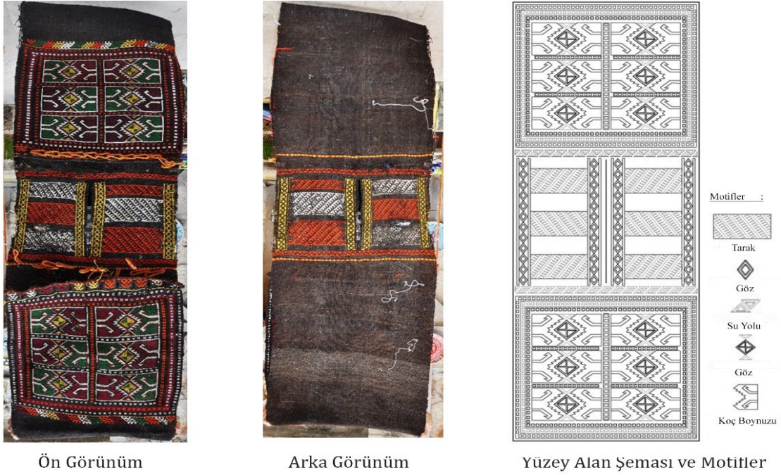
Görsel 8. Heybe Örneği 7, 2014, Antalya/Muratpaşa/Kaleiçi (Eroğlu, 2014b)