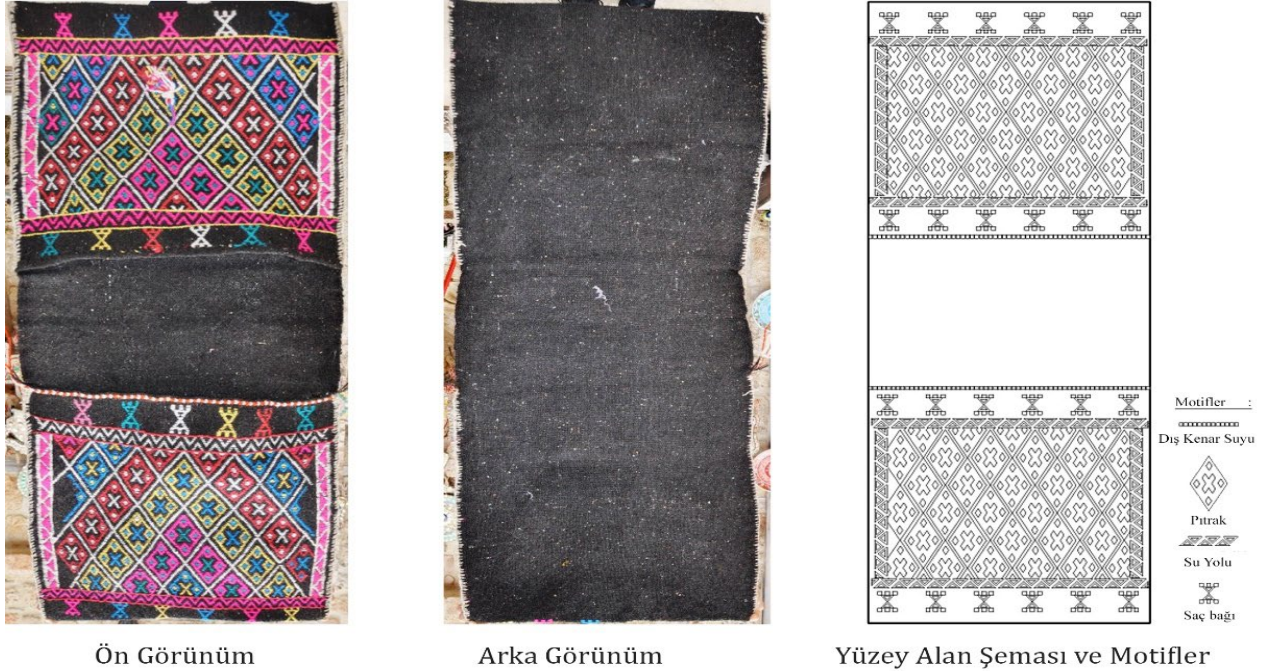
Görsel 2. Heybe Örneği 1, 2014, Antalya/Muratpaşa/Kaleiçi (Eroğlu, 2014b)