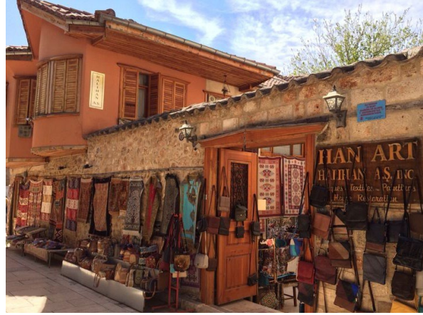
Görsel 1: Kaleiçi Halihan A.Ş. Dış Görünüm (Eroğlu, 2014)