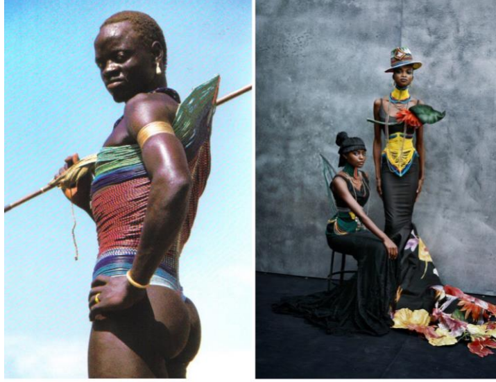
Görsel 5. Dior, 1997, Dinka Corse

20. yüzyılın son on yılına girilirken Missoni Afrika tarzı elbiseleri moda seyircisine sunmuştur. Bu sunuş Issey Miyake ve Norma Kamali'nin "Bogolan" adı verilen Afrika deseni baskılı kumaşları kullanarak tasarımlar yapmasıyla devam etmiştir. Dior'un baş tasarımcısı John Galliano 1997 yılında Kuzey Afrika ülkesi Sudan'da yaşayan Dinkalardan aldığı esinle oluşturduğu koleksiyon oldukça ilgi uyandırmıştır (Miloşyan, 2017) (Görsel 5). Giysi parçalarında mavi, yeşil, kırmızı ve sarı rengi sıklıkla kullanan Dinka'ların renk seçimine sadık kalınmıştır. Tasarımcının siyah renk üzerine sarı renk oluşturarak elde ettiği tasarımda bereket ve zenginlik temsil edilmiştir.