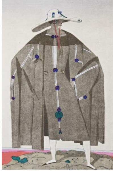
Görsel 1. Paul Poiret, 1920, Tanger

( https://www.edition-originale.com/it/viaggi/africa-e-mondo-arabo/poiret-tanger-ou-les-charmes-de-lexil-robe-1920-54715 )