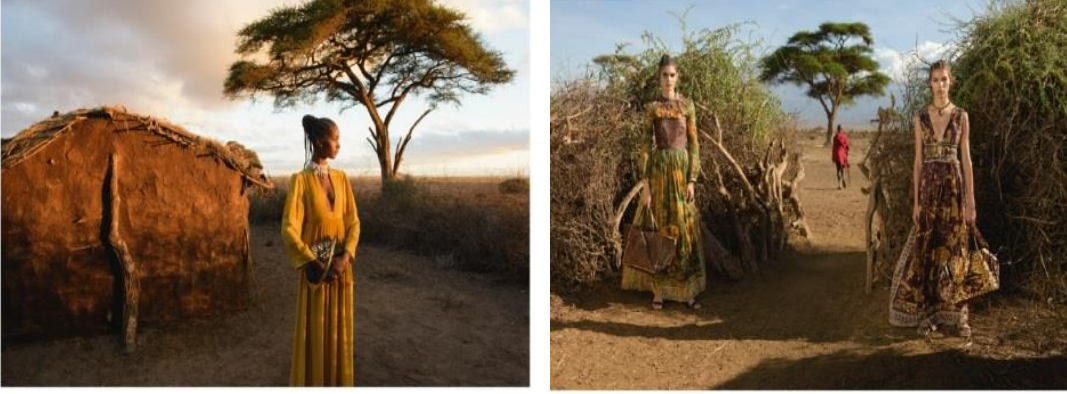
Görsel 7. Valentino, 2016 ( https://www.instyle.com.tr/valentino-2016-ilkbahar-yaz-kampanyasi-7081 )

Valentino'nun 2016 yaz defilesinde kullandığı etnik ve yöresel detayları Afrika yerel kabilelerinden aldığı ilhamla oluşturduğunu belirtmiştir. Kreasyonunda etnik baskılar, boho desenler, püskül, patchwork ve tüyler ile Afrika havasını; dantel ve transparan detaylar ile de feminenliği ön plana çıkarmıştır. Kaplan, zebra ve su aygırı motifleri ile dikkat çeken tasarımlar; saçaklar, boncuklu kemerler, şalvar görünümlü pantolonlar, dökümlü elbiseler ve maxi ceketler ile tamamlanmıştır (Taşlardan, 2015) (Görsel 8). Bereket ve zenginliğin sembolü olan sarı renk ve kötülüklerden korunmanın sembolü olan kahverenginin baskın olarak kullanıldığı tasarımlar çoğunlukla elbise formunda çalışılmıştır.