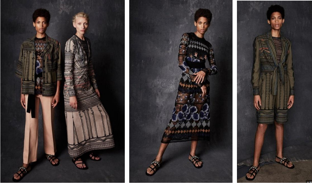
Görsel 9. Yigal Azrouel, 2017

( https://www.vogue.com/fashion-shows/spring-2017-ready-to-wear/yigal-azrouel/slideshow/collection#1 )