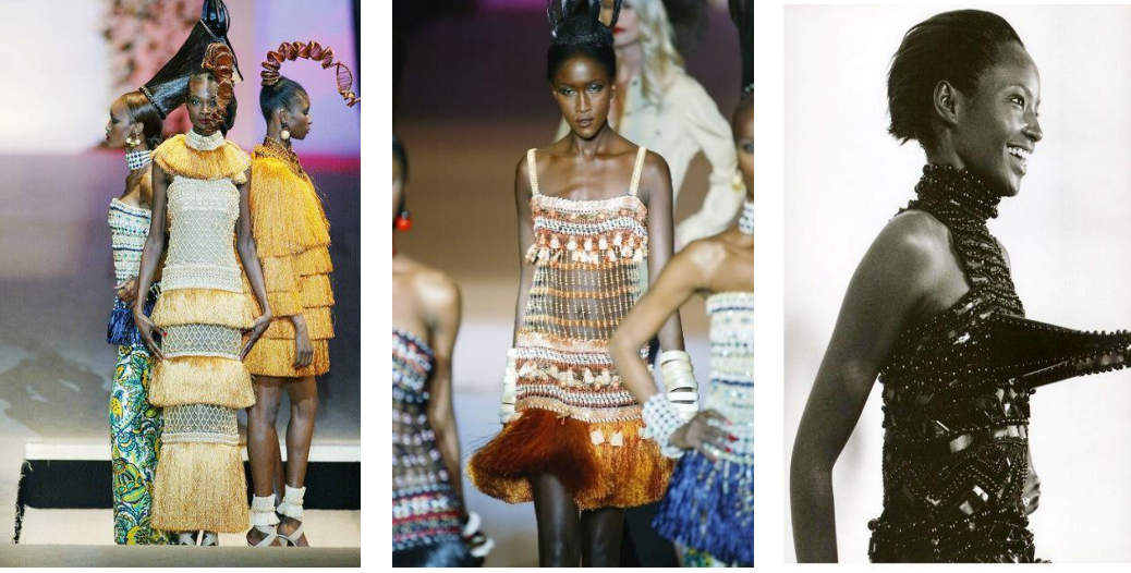
Görsel 3. Yves Saint Laurent, 1967, Bambara ( https://museeyslparis.com/en/biography/collection-africaine-pe )

yenilenmesi ile dikkat çeken koleksiyonun ismi Mali'de aynı adı taşıyan topluluk tarafından üretilen "Bambara" heykellerinden esinlenilmiştir. Kadınları betimleyen bu heykeller, uzun gövdeler ve sivri göğüslerle karakterize olmuşlardır (Gibson, 2013) (Görsel 3). Altın ve bronz renklerin sıklıkla kullanıldığı tasarımlarda Afrika kültüründe manevi anlamda saflığın ve zenginliğin sembolü olan renklere, Yves Saint Laurent tarafından baskın bir şekilde yer verilmesi, o kültüre bir atıf olarak düşünülmüştür.