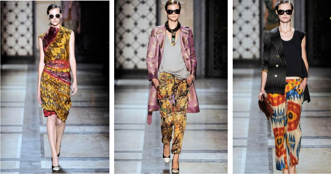
Görsel 6. Dries Van Noten, 2010

( https://www.vogue.com/fashion-shows/spring-2010-ready-to-wear/dries-van-noten )