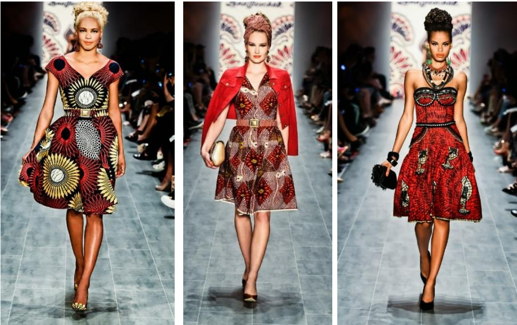
Görsel 7. Lena Hoschek, 2014

Grazlı tasarımcı Lena Hoschek, 2014 Berlin Mercedes Benz Moda Haftası'nda Afrika baskılarından ilham alan tasarımlar sunmuştur. "Hot Mama Africa" başlıklı koleksiyon 50'li ve 60'lı yılların feminen kesimlerini renkli ve çok yönlü baskılarla birleştirilmiştir (Görsel 7). Kreasyonda Afrika desenli kumaşların net bir şekilde dikkat çektiği gözlemlenmiştir. Kumaş üzerinde geometrik desenler elbise formuyla izleyiciye sunulmuştur. Tasarımlarda baskın olarak kullanılan kırmızı tonları kurban ayinlerinin ve ölümün birer sembolik göstergeleridir.