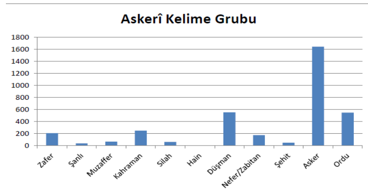
Grafik 2: Askerî Kelime Grubu

Aşağıdaki grafikte, mecmuda geçen askerî kelimelerin tekrar sayıları verilmiştir: