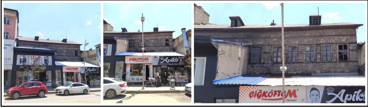
Şekil 7. Günümüzde metruk bir vaziyette olan, Atatürk'ün Erzurum'daki ilk karargâhı olarak bilinen tarihi konağın ön cephesinden görünümler (20.07.2020).

Tarihi konağın arka cephesinde, otları büyümüş bakımsız ve küçük bir bahçe ile binaya sonradan eklenmiş kulübe tarzında bir yapının olduğu gözlemlenmektedir (Şekil 8). Buradaki duvarlarda, küfür ve hakaret unsurları içeren spreyle yazılmış yazılar yer alırken, bahçede de çöpler ve içki şişeleri dikkat çekmektedir (Şekil 8). Binanın arka cephesinde yer alan, alt kattaki duvarın ise büyük bir sac levha ile kapatıldığı görülmektedir (Şekil 8).