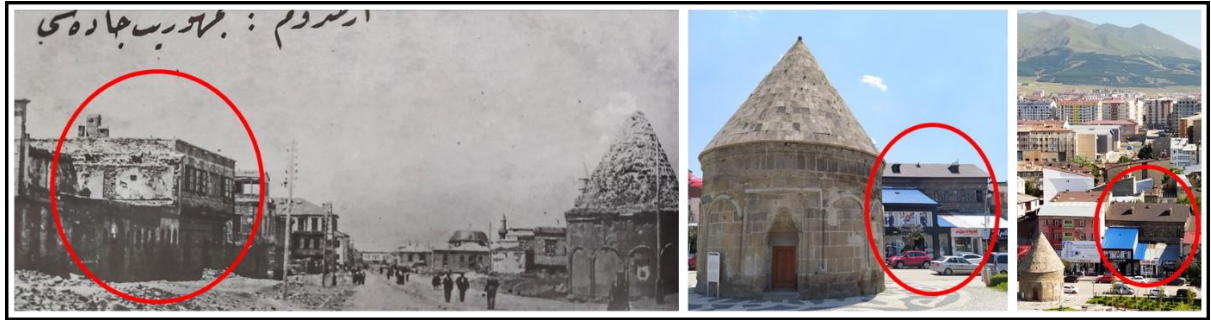
Şekil 6. Solda: Müstahkem Mevkii Kumandanlığına bağlı Müfettişlik Karargâhı binası ve karşısında yer alan Cimcime Sultan Kümbeti'nin eski bir fotoğrafı (Erzurum Valiliği, 2014:108); ortada: Cimcime Sultan Kümbeti'nin arkasında görülen tarihin konağın günümüzdeki hali (20.07.2020); sağda: Erzurum Kalesi'ndeki Saat Kulesi'nden Cimcime Sultan Kümbeti ve karşısındaki tarihi konağın görünümü (20.07.2020).

Erzurum'a geldiği 3 Temmuz 1919 günü, 3. Ordu Müfettişi Mustafa Kemal Paşa'nın yerleştiği ve arkadaşlarıyla beraber çalışmalarını sürdürdüğü; Müfettişlik Karargâhı olarak kullanılan Müstahkem Mevkii Kumandanlığına ait tarihi yapı, günümüzde Cumhuriyet Caddesi üzerinde bulunan Cimcime Sultan Kümbeti'nin karşısında yer alan eski ve metruk bir konaktır (Şekil 6).