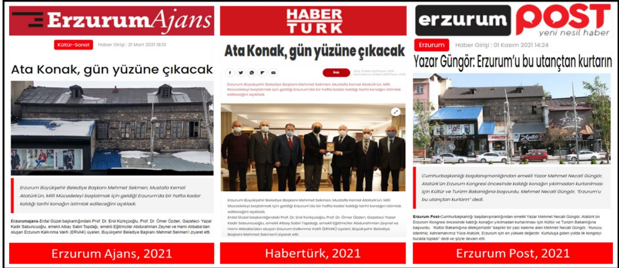
Şekil 9. Atatürk'ün Erzurum'daki ilk karargâhı olan tarihi konakla ilgili yerel ve ulusal basında yer alan haberler.