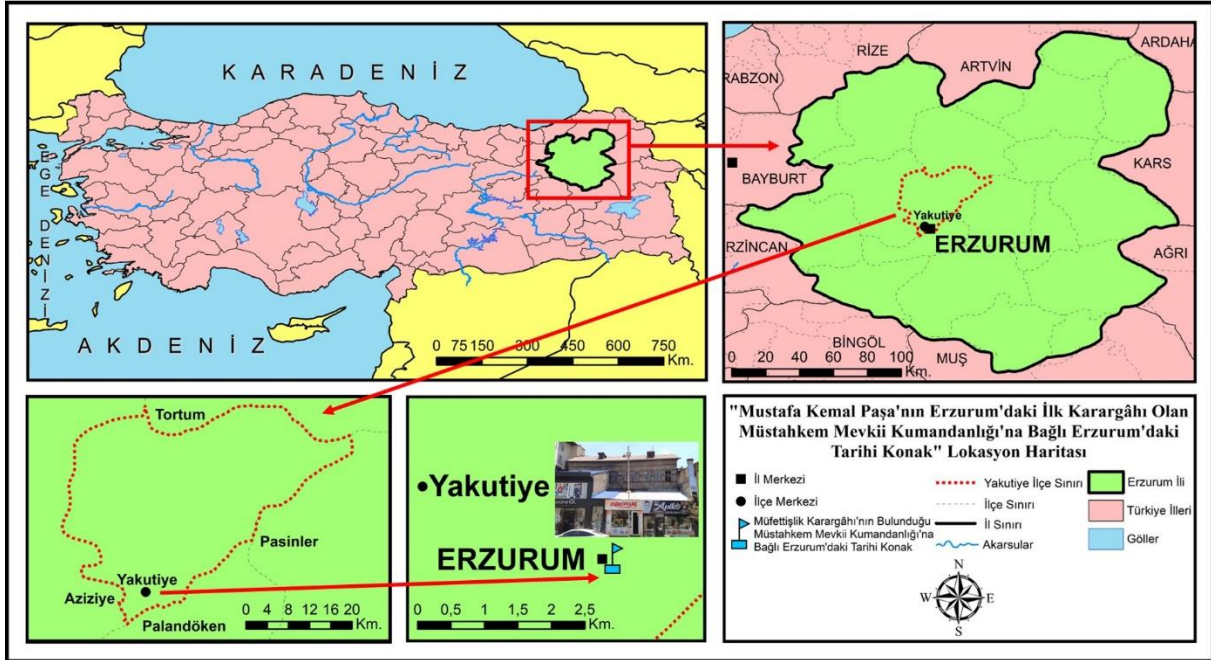
Şekil 1. "Mustafa Kemal Paşa'nın Erzurum'daki İlk Karargâhı Olan Müstahkem Mevkii Kumandanlığına Bağlı Erzurum'daki Tarihi Konak" lokasyon haritası.

Araştırma alanını oluşturan Müstahkem Mevkii Kumandanlığı binasının bulunduğu Cumhuriyet Caddesi üzerindeki tarihi konak, Doğu Anadolu Bölgesi'nin Erzurum kenti sınırları içerisindeki Yakutiye ilçesinde bulunmaktadır (Şekil 1). Araştırmaya konu olan ve günümüze kadar ayakta kalan söz konusu tarihi yapı, Mustafa Kemal Paşa'nın 3. Ordu Müfettişi olarak geldiği Erzurum'da; askerlikten istifasına kadar, Millî Mücadele'nin ilk çalışmalarını sürdürdüğü, önemli toplantılarını yaptığı ve de askerlikten istifa etmesi süreci gibi tarihi kararlarına sahne olması bakımından önem kazanmaktadır. "Millî Mücadele ve Türkiye Cumhuriyeti'nin kuruluşunda büyük tarihi olaylara sahne olmuş" binalardan biri olan ve "Mustafa Kemal Atatürk tarafından" kullanılan Erzurum'daki tarihi konak, tescil kararına rağmen hala korunamaması ve metruk bir vaziyette olması gibi önemli sebepler nedeniyle araştırma alanı olarak seçilmiştir.