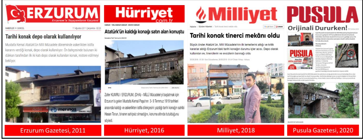
Şekil 5. Atatürk'ün Erzurum'daki ilk karargâhı olan tarihi konağın yerel ve ulusal basında yer alan haberleri.

belirtmiştir. Erzurum Kalkınma Vakfı (ER-VAK) Başkanı Erdal Güzel, “Bu konağın restore edilip Kültür Yolu Projesi kapsamı içerisine alınmasını talep ediyoruz. Tarihe tanıklık eden bu konak Kültür Yolu Projesi içerisinde çok şık bir farkındalık meydana getirir ve anlam ifade eder.” diyerek; “Büyükşehir’in katkılarıyla bir Kültür Yolu Projesi hayata geçmiş vaziyette. Mustafa Kemal’in Millî Mücadele’yi başlatmak için Samsun’a ayak basmasının ve Erzurum Kongresi’nin yapılmasının üzerinden 101 yıl geçti. Bu bina müzeye dönüştürülebilir. Gelecek nesillere aktarılabilir” değerlendirmesinde bulunmuştur (Anonim, 2020).