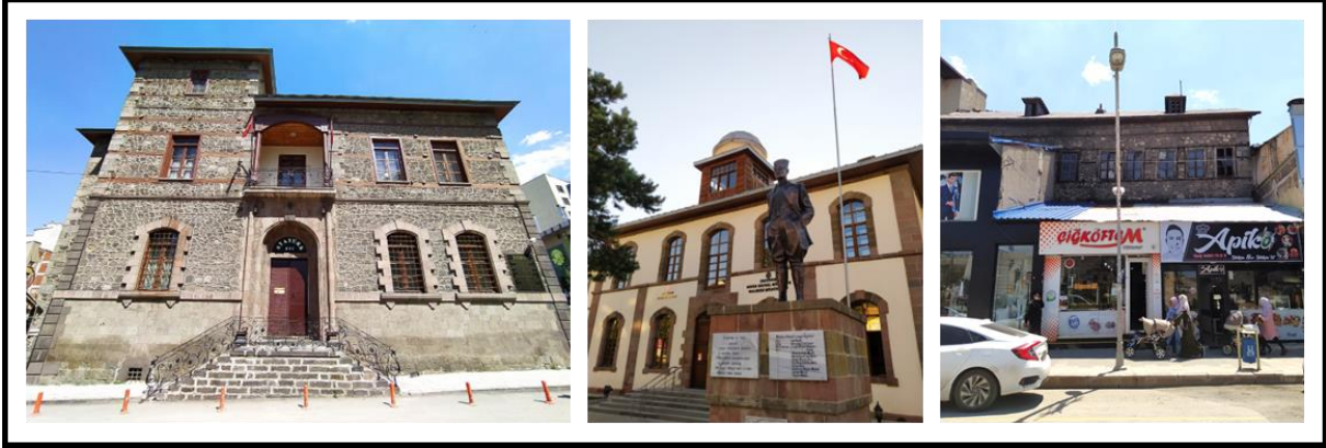
Şekil 2. Solda: Erzurum Atatürk Evi Müzesi (20.07.2020) 3 , ortada: Erzurum Kongre ve Millî Mücadele Müzesi (20.07.2020), sağda: Atatürk'ün Erzurum'daki ilk karargâhı olan Müstahkem Mevkii Kumandanlığına mahsus tarihi konak (20.07.2020).

Atatürk'ün Millî Mücadele döneminde, Erzurum'dayken arkadaşlarıyla beraber uzun müddet ikamet ettiği Vali Konağı (Erzurum Atatürk Evi) ve Erzurum Kongresi'nin yapıldığı lise binası 2 (Erzurum Kongre ve Millî Mücadele Müzesi), günümüzde müze olarak faaliyet göstermektedir (Şekil 2). Ancak Atatürk'ün Erzurum'daki ilk karargâhı olan tarihi konak, günümüzde cumhuriyet tarihine yakışmayacak şekilde, kaderine terk edilmiş bir vaziyettedir (Şekil 2).