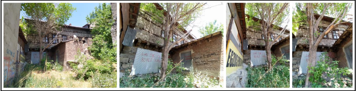
Şekil 8. Atatürk'ün Erzurum'daki ilk karargâhı olarak bilinen metruk vaziyetteki tarihi konağın arka cephesinden görünümler (20.07.2020).

Tarihi konağın arka cephesinde, otları büyümüş bakımsız ve küçük bir bahçe ile binaya sonradan eklenmiş kulübe tarzında bir yapının olduğu gözlemlenmektedir (Şekil 8). Buradaki duvarlarda, küfür ve hakaret unsurları içeren spreyle yazılmış yazılar yer alırken, bahçede de çöpler ve içki şişeleri dikkat çekmektedir (Şekil 8). Binanın arka cephesinde yer alan, alt kattaki duvarın ise büyük bir sac levha ile kapatıldığı görülmektedir (Şekil 8).