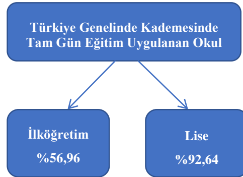
Şekil 1. Türkiye Genelinde Okul Kademelerinde Tam Gün Eğitim Uygulanan Okul Oranı

MEB’in 2022 yılında yayınladığı MEB Örgün Eğitim İstatistikleri’ne (MEB, 2021) göre Türkiye’de 2021-2022 Eğitim-Öğretim yılında okul öncesi eğitim, ilköğretim ve ortaöğretim düzeyinde 19 milyon 155 bin 571 öğrenci örgün eğitim almıştır. Örgün eğitim kapsamındaki okullarda görev yapan öğretmen sayısı ise, 2021-2022 eğitim-öğretim yılında 1 milyon 139 bin 673 olarak açıklanmıştır. MEB 2021 Faaliyet Raporu’na göre, tam gün eğitim kapsamındaki öğrenci oranı, 2021 yılında yüzde 62,71 olarak hesaplanmıştır. 2021 yılı sonu itibarıyla her 10 öğrenciden 6’sı tam gün eğitim yapan okullarda öğrenim görmektedir. Türkiye de tam gün eğitim modeli daha çok ortaöğretim kademesinde uygulanmakta olup, ikili eğitim modeli de ilköğretim kademesinde yaygın olarak uygulanmaktadır. MEB verilerine göre, ülkemizde ortaöğretim kademesinde tam gün eğitim modeli ile eğitim verilen okullar ülke genelinde %92,64 olup, ilköğretim kademesinde tam gün eğitim modeli ile eğitim verilen okul oranı %56,96’dır (MEB, 2021).