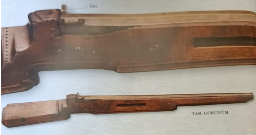
Resim 1: Arkebüz (Silah. Tabanca ve Tüfeklerin 800 Yıllık Tarihi, 2008, s.115)

Osmanlı askerleri ilk ateşli silahlarla karşılaştıklarında muhtemelen onları kuşkuyla karşılamışlardı. Hafif süvari temelli bir orduda hızlı atlar üzerinde hızlı manevralarla, at üzerinden ve yaklaşık 400-500 metre uzaklıktan düşman birliklerine ok üzerine ok yollayan bir süvari iseniz bu ilk ateşli silahları hantal, kullanışsız ve güvenilmez bulmanız olasıdır. XV. ve XVI. yüzyıllarda ordularda çok kullanılan arkebüzün doldurulması birkaç dakika sürmekteydi ve sadece 100 metre mesafeye kadar etkiliydi. İyi bir okçu bu sürede en kötü hızda bile arka arkaya 9-10 kez ok atabilirdi. Bir arkebüzün 20 kg.'ı aşan ağırlığı ise bir süvari için çok fazlaydı. Aşağıdaki arkebüz 1560 yıllarında Almanya menşeli 22.5 kg ağırlığında bir silahtır. Sadece bu ağırlık etkisi bile Osmanlı süvarilerini bu silahlara karşı olumsuz fikirler edinmelerinde etkili olmuştur.