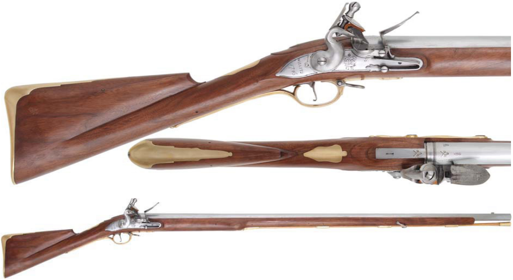
Resim3: BrownBessTüfeği ( https://www.trackofthewolf.com/Categories/GunKit.aspx/603/1/1746-BROWN-BESS-MUSKET-PARTS-LIST ).

birine uyan cephane ile teçhiz edilmeye başlandı. Artık bazı özel asker gruplarının kullandıkları teçhizat ve donanımlar dışında bütün askerler standart donanım ve silahlarla orduları oluşturmaya başladılar. Silah aynı olunca onun eğitimi de aynıydı. Böylece bu ortak silahları kullanacak askerlerin hepsi de aynı eğitimi almaya başladılar. Bu eğitim de ok ve yay kullanmayı öğrenebilmek için gerekli olan uzun eğitimin yanında çok kısaydı. Böylece birkaç ay içinde orduya yeni katılmış acemi bir asker savaşta kendisine gerekli bütün savaş bilgisini öğrenebiliyor ve silahını etkin bir biçimde kullanabiliyordu. Aşağıdaki Brown Bess tüfeği 1742 yılında Birleşik Krallığın standart piyade tüfeğiydi ve 100 yılı aşkın bir süre İngiliz kara ordusunda kullanılmıştır. 4.7 kg ve 117 cm namlu, 157 cm'lik toplam uzunluğundaki bu tüfekle deneyimli bir asker dakikada iki defa ateş edebiliyordu.