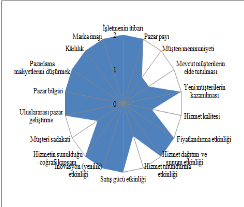
Şekil 1: C5C Ağ Organizasyonunun Novel Uluslararası Taşımacılık ve Lojistik İşletmesinin Pazarlama Performansı Üzerine Etkileri

Novel, müşterilerine yurt dışında hizmet dağıtım ve sunumunda kendi acentesini kurarak yatırım ve işletme maliyetlerine katlanma yerine, "C5C" yoluyla üye lojistik işletmeler ile iş ortaklığı ilişkisi içerisinde çalışarak, hem değişken maliyet esasına göre çalışma, hem de ağ organizasyonu sayesinde çok fazla araştırmaya gerek kalmadan güvenilir bir iş otağı bularak müşterilerine sunduğu hizmetin kalitesini arttırabilme ve pazarlama ve diğer maliyetlerini düşürebilme olanağı elde etmiştir.