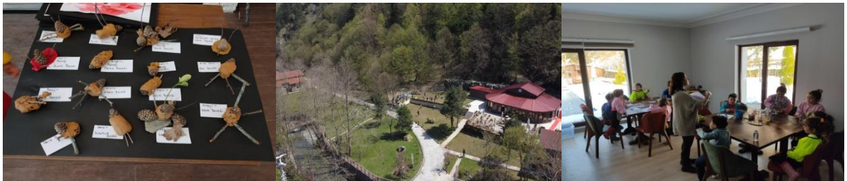
Şekil 15. Sapanca Aile ve Çocuk Kampı