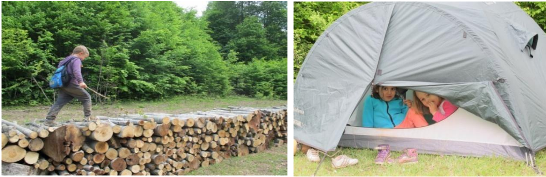
Şekil 6. Hendek Çiğdem Yaylası Çadırılı Aile Çocuk Kampı (URL-6)

Sakarya ilinin Hendek ilçesinde bulunan yaylanın topukotu adı ile adlandırılan çimle kaplanmış geniş bir alanı bulunmaktadır. Kampın genel amacı aile ve çocuklar için doğal alanlarda buluşma ortamının sağlanması ve yeni sosyal alanlar oluşturmaktır (URL-6).