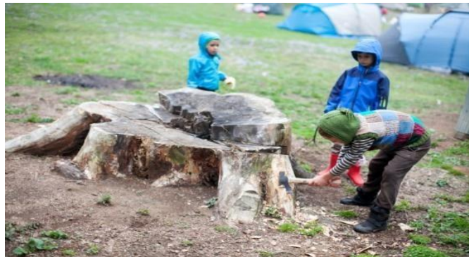
Şekil 9. Kaçkarlar Macahel Vadisi Çocuk Kampı (URL-9)

Kaçkar Macahel Bölgesi yaylalarında gerçekleştirilen bu etkinlik 'Kampa gidelim mi baba?' projesi adı altında düzenlenmiş bir kamp etkinliğidir. Macahel, Doğu Karadeniz'in en doğusunda yer almaktadır. Gürcistan sınırındaki Macahel'in altı köyü Artvin sınırlarında, kalan 12'si de Gürcistan sınırlarında bulunmaktadır. Biyolojik rezerv alanı olarak çok değerli bir bölge olan ballarıyla ünlü Macahel, yaban yaşam sahası olarak da değerlidir. Bu coğrafyanın farklı bir Karadeniz'i olan Macahel ve civarındaki bölgeyi aile ve çocuklar için uygun olup, ayrıca program Şavşat, Macahel ve Borçka bölgesi köyleri ve yaylalarında da gerçekleştirilmektedir (Anonim,2022f) (URL-9).