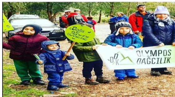
Şekil 17. Olympos Dağcılık ve Doğa Sporları Kulübünde Çocuk Ormanı Yürüyüşü (URL-17)

2018 yılında İzmir Örnekköy’de faaliyet başlamıştır. Yürüyüşe, her yaştan çocuklar, büyükler ve Ulusal Down Sendromu Derneğinin gençleri katılmıştır. Olympos Dağcılık ve Doğa Sporları Kulübünde Çocuk Ormanı Yürüyüşü ile çocukların doğaya çıkarılması, bazı derslerin doğada yapılması, çeşitli yürüyüş aktiviteleri ve kamplar yapılması amaçlanmaktadır. Böylece kendine güvenen, çevresine, doğaya duyarlı ve paylaşımcı bireyler yetiştirilmesine katkı sağlamaktadır. Ayrıca her yaştan çocuğa tırmanış eğitimi verilmekte, Antalya’da Geyikbayırı Kaya Tırmanışı dağcılığa ilk adımı atan çocuklar içinde aktiviteler yapılmaktadır (URL-17).