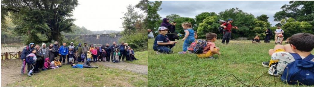
Şekil 18. Aile Doğa Yürüyüşü-İstanbul (URL-18)

Etkinlikler İstanbul'un kalbi Belgrad ormanları içerisinde yer alan Bentler Tabiat Parkında yaklaşık 6 km bir doğa yürüyüşü gerçekleştirilmektedir. Çocuklar açısından öğrenme, eğlenme, doğa farkındalığı kazanma, duyuşsal, fiziksel ve bilişsel yeteneklerin artmasına katkı sağlarken, yetişkinler için de şehir hayatı stresinden, kalabalığından uzak doğa ile iç içe olabilecekleri fırsatlar sunmaktadır. Aynı dönemlerde Belgrad Ormanları içerisinde yer alan Bilezikçi Çiftliği Aile doğa yürüyüşü aktivitesi de gerçekleştirilmektedir (URL-18).