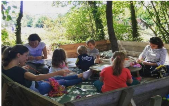
Şekil 2. Permakamp aktivitelerinden örnekler (URL-2).

Permakamp projesi içerisinde çocuklar ve yetişkinler için aktiviteler yer almaktadır. Örneğin 12 Nisan 2022 tarihinde gerçekleştirilecek olan; çocuklar için toprağın dili eğitimi ve permakamp günü ile çocuklara toprak sevgisini, toprak ile konuşmayı deneyimleyerek öğrenmelerini sağlamaktadır. Ayrıca yetişkinler için tabii günün konuları genel olarak toprak iyileştirme, zehirler ve zararları, ekolojik gıda, sağlıklı beslenme gibi konularda farkındalıklarını arttıracak faaliyetler yer almaktadır.