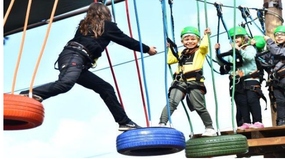
Şekil 22. İzmir Bornova Macera Parkı, İzmir(URL-22)