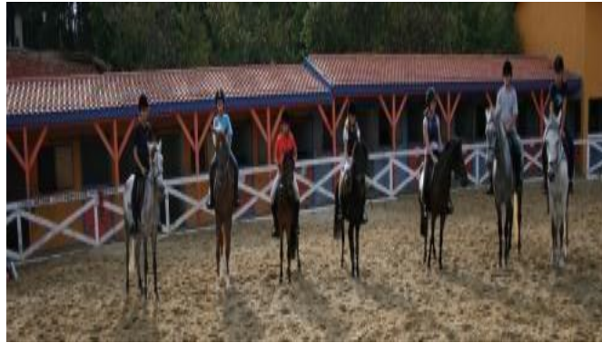
Şekil 21. İstanbul Binicilik Kulübü (URL-21)

İstanbul Çekmeköy’de çocuklar için Pony Eğitimi 4-14 yaşları arasında verilmektedir. Araştırmalara göre ata binen çocuklar sakinleşmekte ve stres katsayıları azalmaktadır. Çocuklarda özgüven artmakta ve liderlik vasıfları gelişmektedir. Çocuklarda bacak, sırt gibi tüm vücut kaslarının ve 4-6 yaş arasında çocukların ince motor gelişimine de olumlu katkı sağlar. Hipoterapi (atla zihinsel engelli çocuk tedavisi) dünyanın birçok merkezinde ve Türkiye’de uygulanmakta ve çok yararlı sonuçlar elde edilmektedir. Buradan yola çıkarak sağlıklı çocuk gelişiminde de binicilik sporunun evrensel kurallar doğrultusunda yapıldığında fiziksel ve zihinsel katkıları olacağı kaçınılmazdır. Ayrıca hormonal etkiyle erken ergenliği ve obeziteyi önleyerek fiziksel gelişimin olması gereken sürede tamamlanmasında fayda sağlar (Anonim,2022h) (URL-21).