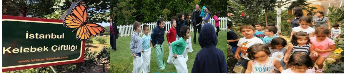
Şekil 24. İstanbul Kelebek Çiftliği (URL-24)

Araştırma kapsamında ulaşılabilen aile ve çocuk odaklı ekoturizm aktivitelerini içeren kamplar ve rekreasyon alanları değerlendirildiğinde Türkiye'nin farklı bölgelerinde, farklı konseptlerde pek çok aile ve çocuk odaklı kampların ilgi gördüğü söylenebilmektedir. Çocukların doğaya ve doğanın da çocuklara, bilinçli bir topluma ihtiyacı vardır. Doğanın yaşam döngüsünün korunması, nesli tükenen canlılar, küresel ısınmanın olası etkileri, çevre kirliliğinin yarattığı tahribat, sürdürülebilir yaşam ve geri dönüşümün önemini bilmesi, genç kuşaklarda doğa bilincinin yaratılması ancak ve ancak küçük yaşlardan itibaren doğa içerisinde vakit geçirmek ile başlayacaktır.