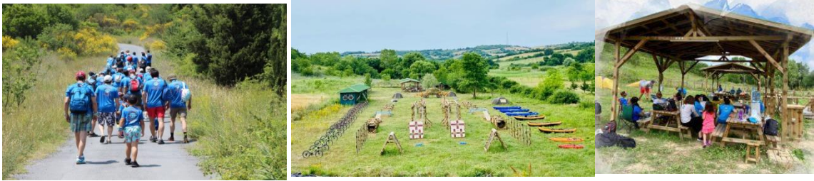
Şekil 16. Nasuh Mahruki Doğada Liderlik Okulları (URL-16)

takım oyunları, doğada drama, ahşap atölye çalışmaları, ateş başı sohbetleri, çeşitli spor, oyun, görev ve yarışmalarla yeni şeyler öğrenecek, yeni şeyler deneyimleyip, macera ve keşif duygusu yaşamaktadırlar. Birlikte zaman geçirmek, özgüvenlerini ve farkındalıklarını artıracak problem çözme, risk yönetimi, kriz yönetimi, liderlik, takım ruhu ve takım çalışması deneyimlerini kazanmalarına katkı sağlamaktadır. Aile ve Çocuklar iki gün boyunca aynı çadırda kalabilmekte, çadır kurmayı, ipleri ve düğümleri, doğada güvenli hareket edebilmeyi öğrenmektedirler. Birlikte yürüyüş yaparak, doğada yön bulma, tırmanış yapma, kanoya ve bisikletle binmektedirler (URL-16).