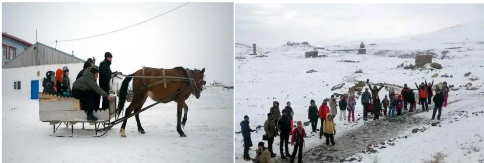
Şekil 7. Kars Boğatepe Köyü Ekolojik Çocuk Kampları (URL-7)

Kars ilinde yer alan ve yılın belli aylarında gerçekleştirilen bu faaliyetlerde 2267 m'de konumlanmış Boğatepe köyünde doğa ile iç içe, yerel ve ekolojik bakımdan zengin, aile ve çocuklar için köy yaşamı ve kamp deneyimi oluşturmaktadır. Doğada yürüyüş, geceleri kamp ateşi çevresinde sohbet, köy çocuklarının yüzdüğü dereye suya girmek, köyün ekolojik sofralarına oturmak, köylülerin gelen misafirler için açtığı köy evlerine misafir olmak, birlikte çalışmak gibi aktiviteler de bulunmaktadır (URL-7).