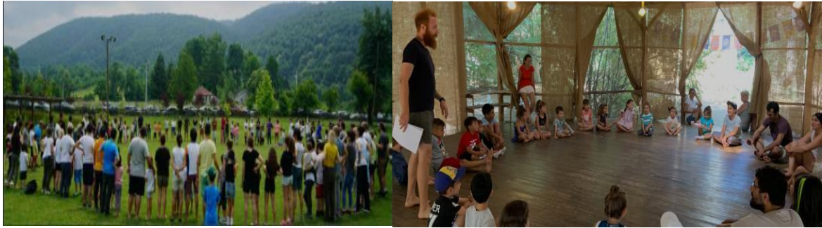
Şekil 3. Oyun kampta aktivitelerinden örnekler (URL-3).

Oyun Kampta 2014 senesinde kurulmuştur ve 2021 yılı itibari ile "Oyun Kampta Turizm Seyahat Acentası" olarak hizmet vermeye devam etmektedir. 2014 senesinde 2 kamp ile başlayan organizasyon 2021 senesinde 100'ün üzerinde kamp ile devam etmektedir. Özellikle alternatif eğitim sistemini benimseyen konusunda uzman, hak temelli ve çocukların birey olarak var olması konusunda başrolde tutarak yaklaşım biçiminde bulunmayı hedefleyen 40'ın üzerinde eğitimci kadrosu ile hizmet vermektedir (Anonim,2022d).Kampta verilen eğitimlerin amaçları; çocuk, çocuk yaklaşımı, çocuk hakları, hayvan hakları, insan hakları konularını insana yaymak, aileleri ve çocukları şiddetsiz iletişim dili ile tanıştırmaktır. Gerçekleştirilen projeleri arasında; Kaz dağları ilkbahar aile kampları, Oyun Kampı çocukları Şahmaran'ın izinde Mardin, Oyun Kampta Akkaya Bayram Kampları, Oyun Kampta Çadır konaklama şenlikleri, Sapanca gölü Banboolow resort aile Kampı, Göbeklitepe Oyun Parkı ve Nemrut Oyunbaz Dağı kampları, oyun kampta Akkaya Kampı gibi gerçekleştirilen projeleri bulunmaktadır. Ayrıca çocuklar için tanışma çemberi, sanatta teneffüs, köy gezileri, okçuluk-dart Atölyesi, serbest oyun zamanı, ateş başında masal çemberi, müze gezileri, doğa yürüyüşleri vb aktiviteler de yer almaktadır (URL-3).