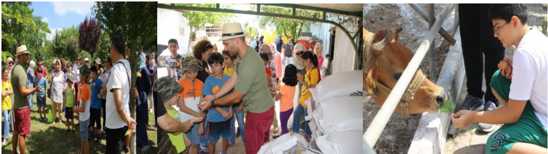
Şekil 13. Ev Okulu Derneği (URL-13)

Ev Okulu Derneği'nin amacı; ailelerin çocuklarıyla birlikte vakit geçirecekleri okul dışında ve aile ortamında desteklemek amacıyla çalışmalar yapmaktır. Bilim ve sanat alanında birçok etkinlikler yapan dernek aile ve çocuklar için; "Doğada 1 Gün etkinliği", "Doğanın Çiftliğine Sizi Davet Ediyoruz" adı altında etkinlikler düzenlemektedir. Etkinliklerdeki amaçlar; ailelerin çocukları ile hayvanlara temas edebilmelerini, tanımalarını, kamp ve doğa oyunları ile üniversiteli genç ev rehberleriyle eğitici ve eğlenceli aktivitelere katılmalarını sağlamaktır (URL-13).