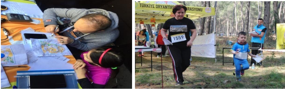
Şekil 20. Oryantiring (URL-20)