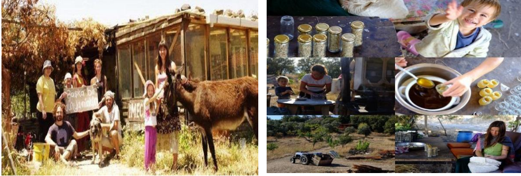
Şekil 4. İmece Evi/Menemen-İzmir aktivitelerinden örnekler (URL-4)

Türkiye’de 2011 yılında İzmir Menemen’de Dumanlıdağ Köyü yakınlarında İmece Evi kurulmuştur. Türkiye’den ve dünya çapından birçok ziyaretçi beraber yaşamaktadırlar. Burada herkes beraber çalışmakta ve ürettiklerini paylaşıp, doğaya hiçbir şekilde zarar vermemektedirler. Aile ve çocuklar için paylaşılan en değerli şeyler; bilgi, beceri ve tecrübe olmaktadır. İmece Evi bahçelerinde toprağın gücünü yitirmemesi için bakla ekimi yapıлып ve sadece hayvan gübresi kullanılmaktadır. Ayrıca kaynaktan borularla getirilen suyla damlama sistemi ile sulama yapılmaktadır. Geleneksel tarım yöntemlerinin yanında farklı ekollerin ve modern diğer yöntemlerin de (Permakültür, Fukuoka, Biodinamik) uygulandığı İmece bahçelerinde doğal ve yerel tohum ile sebze ve meyve yetiştirilmektedir (Anonim,2022e).(URL-4).