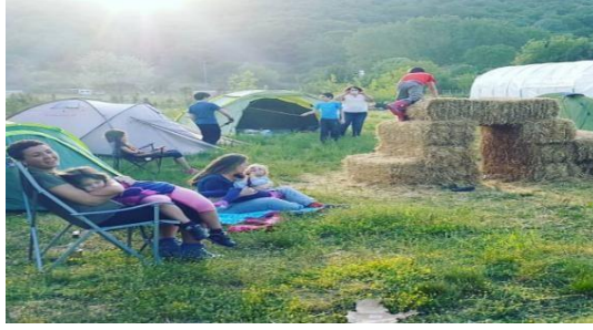
Şekil 1. Permakamp (URL-1).

almaktadır. Proje kapsamında ekolojik çocuk kampları projenin hem çocuklar hem de aileler için faydalı toplum destekli bir projedir. En önemli amacı çocuklarda ve yetişkinlerde doğa bilincini oluşturmak, kamp yaparak yardımlaşma ve dayanışmayı arttırmaktır.