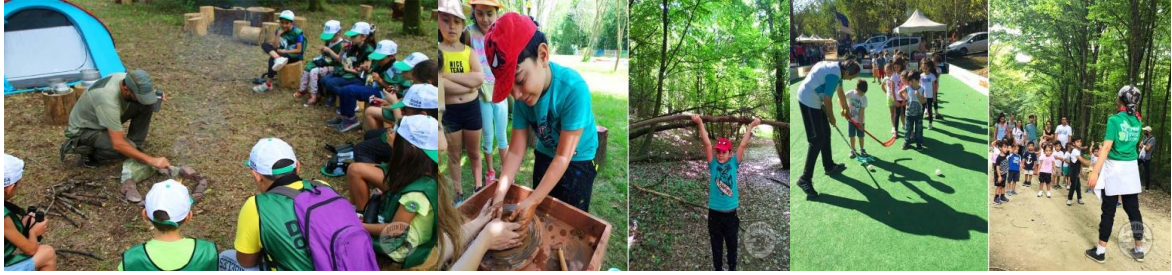
Şekil 14. Yeşil Nesil Atölyeleri-İstanbul (URL-14)

Yeşil Nesil Atölyeleri eğitim verdiği çocuklara doğayı ve tarımı sevdirebilmek amacıyla 2016 yılında "Okullar için Eğitici Turizm ve Gezi Faaliyetleri Planlayan" bir tur şirketi firması olarak kurulmuştur (Anonim,2022g). Yeşil Nesil Atölyeleri İstanbul Beykoz'da bulunmaktadır. Çocuk ve yetişkinler için özel atölye etkinlikleri olarak çiftlik ormanı, tarım, beceri, farkındalık, doğada bilim, çadır kamp atölyesi, hobi sanatları, tarih etkinlikleri gibi bünyesinde birçok etkinlikler barındırmaktadır (URL-14).