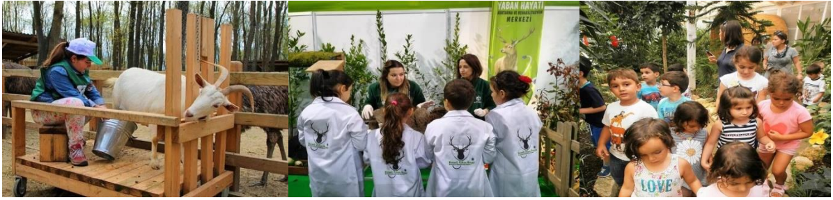
Şekil 12. Ormanya Doğal Yaşam Parkı, Kocaeli (URL-12)

Doğal çevresiyle birlikte 4 bin dönümlük alana yayılan Ormanya Yaşam Parkı dünyanın 3. Avrupanın ise en büyük doğal yaşam alanı olma özelliğine sahiptir. Hayvanat bahçesi, yürüyüş ve bisiklet turları, aile ve çocuklar için karavan ve çadır kamp alanı, doğa okulu ve yaban hayatı kurtarma merkezi olmak üzere 6 bölgeden oluşmaktadır. Ormanya Doğa Okulunda çocuklar sebzelerin tohumlarını ekip büyüme evrelerine şahit olup, kendileri de bu etkinlikleri gerçekleştirip, doğal hayatı yaşayarak gözlemleyebilmektedirler. Ayrıca Yaban hayatı kurtarma ve rehabilitasyon merkezinde yaban hayatlarına nasıl müdahale edebileceklerini öğrenmektedirler (URL-12).