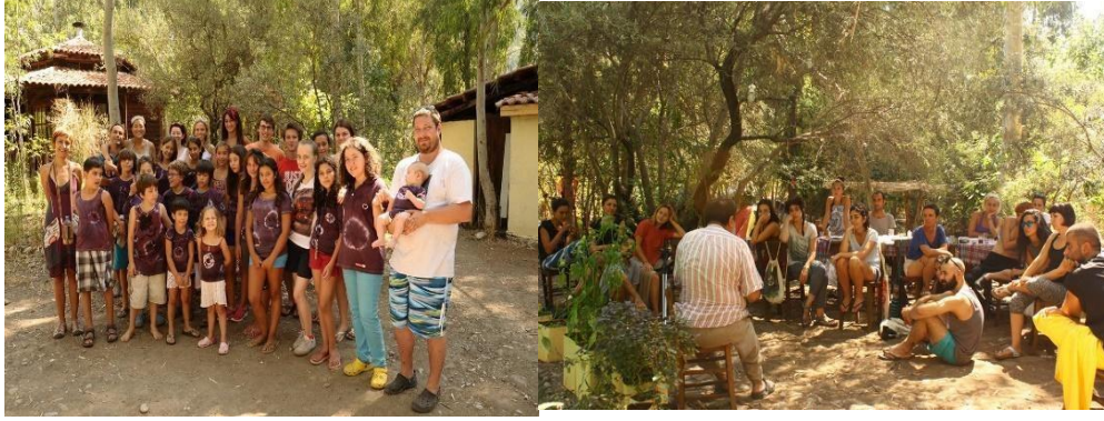
Şekil 8. Pastoral Vadi Ekolojik Yaşam Çiftliği (URL-8)

topraktan çanak çömlek yapımı, ahşap oymacılığı, tarhana, erişte, reçel ve turşu yapım çalışmaları da bulunmaktadır. Çocuklar için üretim isteğini harekete geçiren birçok aktivite de yer almaktadır. 28 Mayıs Dünya Oyun Günü baharın gelişini; Kötü hava yoktur, yanlış kıyafet vardır ve Oyun Doğada sloganları ile 8 senedir var olan Oyun Kampları aile ve çocuklar için eğlenceli çadır kampı şenlikleri düzenlenmektedir. Ayrıca Masal Doğa Tohum Kampı, Ekolojik Aile Kampı, Çocuk Yogası ve Masal Atölyesi Kamp çeşitleri de yer almaktadır (URL-8).