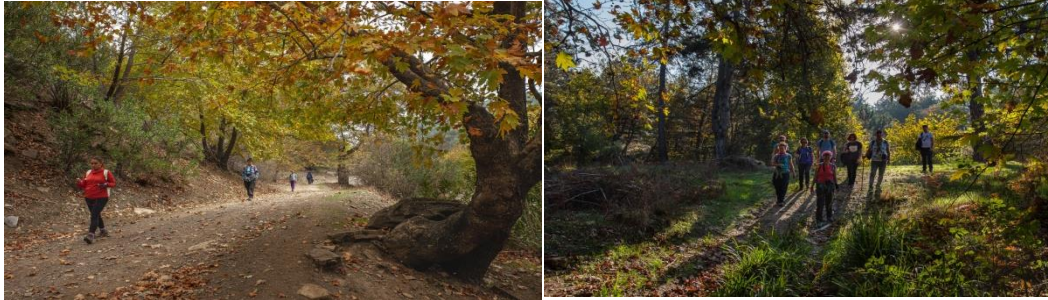
Şekil 19. Patikatrek Doğa Sporları (URL-19)

Birçok doğa sporları alanında faaliyet gösteren patikatrek eğitim merkezi anne-çocuk, baba-çocuk doğa yürüyüşleri kapsamında da faaliyet göstermektedir. Özellikle pandemi sürecinde uzun zaman evlerde kapalı kalmaktan bunalan kişilerin yeniden can bulması, çocukların doğa ve çevreye farkındalıklarını arttırmayı sağlamaktadır (URL-19).