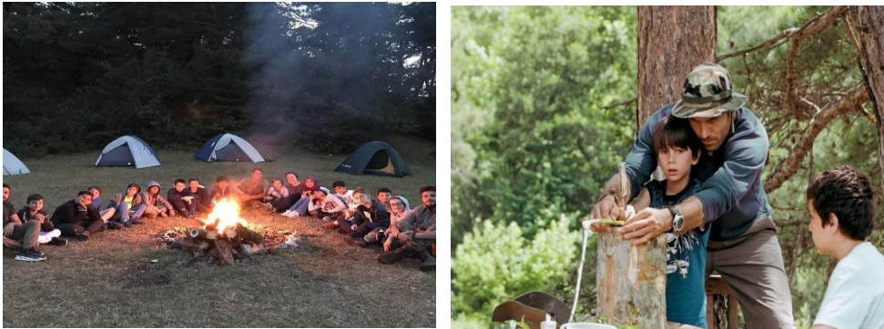
Şekil 11. Campwolfrack Doğadaki Çocuk Kampı (URL-11)

Campwolfrack 1999 yılında 'Doğadaki Çocukla' TV programı yaratıcısı Serdar Kılıç tarafından kurulmuştur. Kamp programlarında; doğada hayatta kalma teknikleri, takım ve bireysel oyunlar, yüksek ip ve engel parkurları, kampçılık eğitimleri, okçuluk gibi aktiviteler yer almaktadır. Bu aktiviteler çocuğun iç dünyası ile doğal dünya arasındaki güçlü bağlantılara ilham vererek, güvenli doğal alanlara erişim, çocuklarda kilo yönetimini iyileştirmek, stres ve DEHB (Dikkat Eksikliği ve Hiperaktivite Bozukluğu) semptomlarını azaltmaya kadar çocukların hem fiziksel hem de zihinsel sağlığına katkı sağlamaktadır (URL-11).