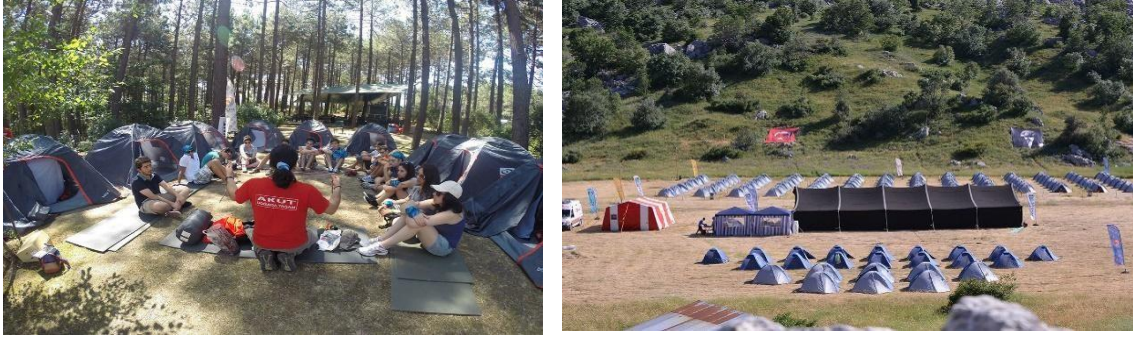
Şekil 10. Akut Doğada Yaşam Kampı (URL-10)

Projenin amacı; çocuklara afetler ve acil durumlar karşısında hazırlıklı olmaları, afetler karşısında dayanıklı bir toplumun temellerinin atılması, doğa ile iç içe yaşamın verdiği farkındalık geliştirilmesi ile doğaya saygılı bir neslin yetiştirilmesi amaçlanmaktadır. Gerçekleştirilen kamplar; Anne Çocuk Kampı (İstanbul-Eskişehir), Baba-Çocuk Kampı (İstanbul-Eskişehir), Ekstrem Genç Yetişkin Kampı, Grup Kampları gibi çeşitli kamp aktiviteleri yer almaktadır. Kampın eğitim içeriği ise; Afet bilinçlendirme eğitimleri, çevre koruma bilinci, doğada güvenli yaşam, kampçılık, navigasyon, yapay kaya tırmanışı, ip teknikleridir (URL-10).