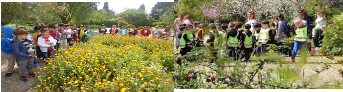
Şekil 23. Zeytinburnu Tıbbi Bitkiler Bahçesi –İstanbul (URL-23)

Zeytinburnu Tıbbi bitkiler bahçesi, Türkiye'nin ilk tıbbi bitki bahçesidir. 14 dönümlük alanda kurulmuş ve 2005 yılında hizmete açılmıştır. Tıbbi bitkileri araştırmak üretmek ve tanıtmak, eğitim programları için çalışma alanı ve materyal sağlamak gibi kullanım amaçları bulunmaktadır. Çocukların doğayı tanıması için aile ve çocukların ziyaret yerlerinden biri konumuna gelmiştir (URL-23).