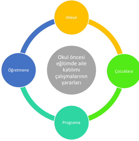
Şekil 1. Okul Öncesi Eğitimde Aile Katılımı Çalışmalarının Yararları

Aile katılımı çalışmalarının sadece aileye olan yararından söz etmek doğru bir durum olmamaktadır. Okul öncesi dönemde gerçekleştirilen öğrenmelerin çocuğun ilerleyen yaşam sürecindeki kritik etkileri değerlendirildiğinde aile katılımı çalışmalarının çocuğun bilişsel, sosyal-duygusal, dil ve psikomotor gelişim alanlarında ve akademik bağlamda ilerleme sağlamasına (Kartal, 2007); anne babalara da çocuğunu gözlemleme, çocuğunun gelişimsel ve akademik ihtiyaçlarının farkına varmalarına olanak sağlamaktadır (La Paro vd., 2003). Diğer yandan okul öncesi eğitimde sürdürülen aile katılımı çalışmalarıyla öğretmenin de çocuğun büyüdüğü aile ortamını tanınmasına böylece çocuğu tanınmasına ve bazı eğitsel kararlar verebilmesine yardımcı olmaktadır. Diğer yandan öğretmenlerin aile katılımı çalışmaları için geliştirmeleri gereken birtakım beceriler sıralanmaktadır. Eliason ve Jenkins (2003) tarafından bu beceriler şöyle sıralanmıştır: