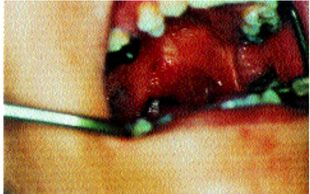
Şekil 2. Protezin bitmiş hali