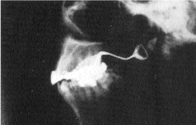
Şekil 4. Protezin radyografik görünümü

Posterior faringeal duvar anteriora doğru hareket ederek (atlasın anterior tüberkülü hizasında) yumuşak damağın yukarı kalkması ile orafarinksin nazofarinksten ayrılması, pelotun üzerinin alüminyum folyo ile kaplanıp, lateral sefolometrik radyografi ile tespit edildi (Şekil 4).