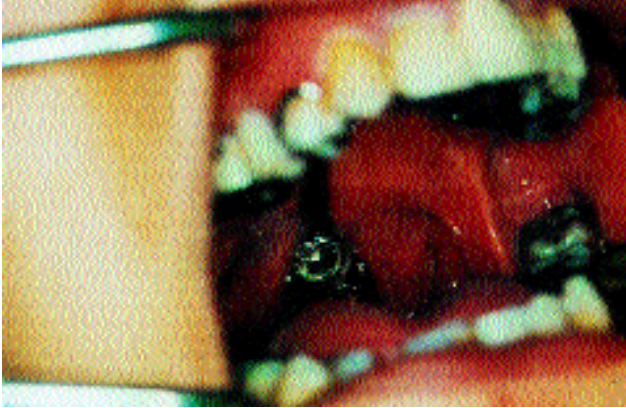
Şekil 3. Protezin ağızdaki görünümü

Posterior faringeal duvar anteriora doğru hareket ederek (atlasın anterior tüberkülü hizasında) yumuşak damağın yukarı kalkması ile orafarinksin nazofarinksten ayrılması, pelotun üzerinin alüminyum folyo ile kaplanıp, lateral sefolometrik radyografi ile tespit edildi (Şekil 4).