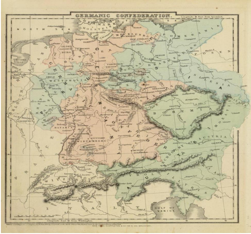
Harita 2: 1855 Alman Konfederasyonu 20

Batı Almanya'nın endüstriyel olarak gelişmeye başlaması, Avusturya'yı Zollverein karşısında güçsüz duruma düşürmekteydi. Hesse-Darmstadt'ın her ne kadar Avusturya'ya karşı ılımlı bir tavır olsa da sadece onu dizginlemekteydi. Avusturya'nın sözü edilen devletleri birlikten koparıp kendisiyle birleştirmeyi başarması halindeyse Almanya'da alacağı konum son derece önemliydi. Böyle bir ihtimalin gerçekleşmesi, Saksonya'dan Ren Bavyera'ya, Elbe'den Saar'a kadar Almanya'nın parçalanmasına anlamına gelmekteydi. Bu nedenle güney birliği için Hessen ve Saksonya'nın iki büyük önemi vardı. İlki, birliğin Orta ve Yukarı Ren'e giden büyük demir yollarına ve Rheinland'ı doğu gümrüklerinden ayıran geniş bir kapalı alana sahip olması; ikincisi de