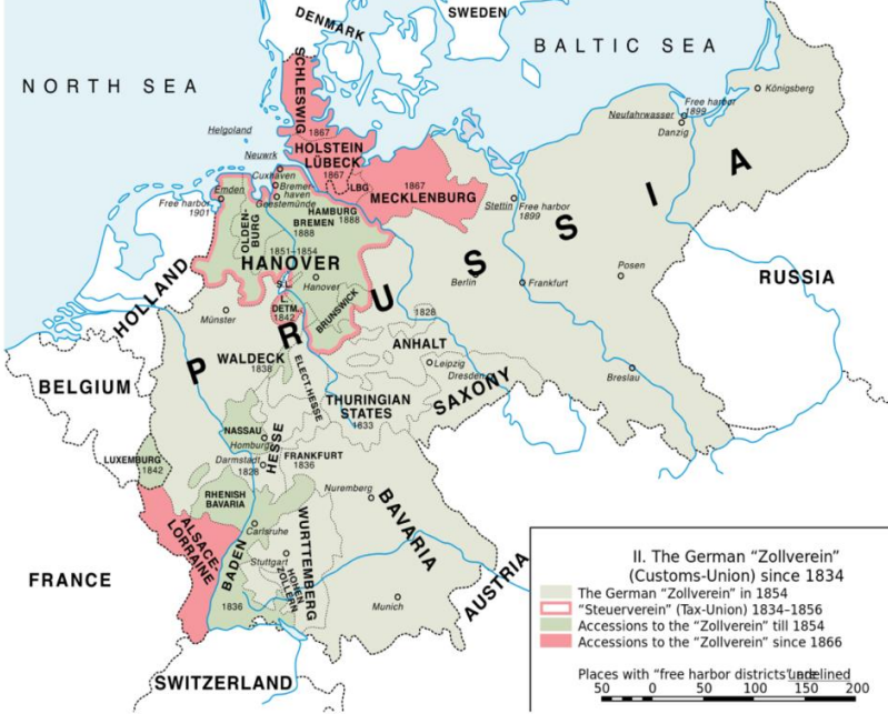
Harita 3: Alman İmparatorluğu'na Kadar Zollverein'in Gelişimi 22

Thüringen ve Silezya'nın izole edilmesini sağlayacak konumuydu. Tuna'nın tüm nehir bölgesi, Ren Nehri, Mainz'e kadar Weser ve Minden, Elbe'den Torgau*ya kadar birliğin tüm büyük su yollarının üst nehir alanlarını birbirine bağlayan arazi buradaydı. Sakson-Bavyera demir yolu da ilgili alan içerisindeydi. Eğer, Avusturya bölgeye sahip olursa Magdeburg'dan güneye giden demir yolu hattı kurulabilecek olası bir Avusturya gümrük bölgesi tarafından kesilebilecekti. 21