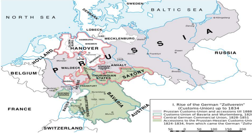
Harita 1: 1834'e Kadar Zollverein'in Gelişimi 16