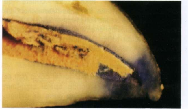
Şekil 2. Boya sızıntısı gözlenen Ketac - Endion kanal dolgu patı ile doldurulan deney grubuna ait bir örnek.

bölgeden eksuda ve mikroorganizmalar sızarak ve sonuçta istenmeyen birtakım iltahabi olayların oluşmasına neden olurlar. Bunu azaltmak veya ortadan kaldırmak için kanal dolgu maddelerinin sızdırmaz özelliğe sahip olması istenir 10 .