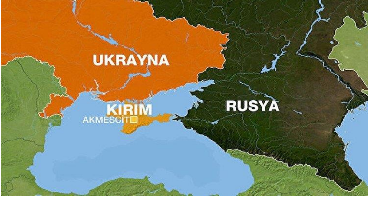
Harita 3. Rusya-Ukrayna sınırı 71

Bu bağlamda ABD'nin Ukrayna üzerinde stratejik olarak öncelikli hedefi, bu ülkeyi NATO ve AB sisteminin içine alıp Rusya'nın fiziki sınırlarına dayanmaktır. Bu hedef gerçekleşirse NATO Moskova'ya 480 km mesafeye gelmiş olacaktır. Bununla birlikte savunması zor bir cephe ortaya çıkacak, Ukrayna-Kazakistan arasındaki boşluk ortadan kalktığında da Rusya'nın Kafkasya ile olan irtibatı kesilmiş olacaktır. Bu olasılıklar Rusya'nın ulusal güvenliği için bir tehdit algısı oluşturduğundan dolayı Rusya Ukrayna'nın AB ile bütünleşmesini de kendi güvenliği için potansiyel bir tehdit olarak görmekte ve Batı'nın Ukrayna'daki muhaliflere vermiş olduğu desteği Ukrayna'nın iç işlerine müdahale olarak değerlendirmektedir 72 .