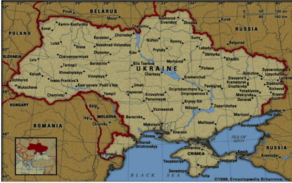
Harita 1. Ukrayna Siyasi Haritası 20

Ancak sık sık etnik ve dinsel temelli çatışmaların yaşandığı Kuzey Kafkasya bölgesi olarak adlandırılan bu bölgede zaman zaman Rusya'ya karşı verilen mücadeleler, Rusya'nın her istediğinde bu bölge üzerinden Karadeniz'e açılabilmesini engellemektedir. Ayrıca bölgenin dağlık yapısı ve doğal limanlardan yoksun olması gibi nedenlerle Rusya, Karadeniz'de bulundurmak istediği askeri ve ticari gemileri Ukrayna'ya konumlandırmayı uygun görmüştür. Hem çok sayıda Rus kökenlilerin yaşaması 21 hem de Rusya'nın Karadeniz donanmasının Kırım'da bulunması, Ukrayna'yı Rusya için cazip hale getiren faktörler olmuştur. Dolayısıyla hem coğrafi konum olarak daha güneyde bulunması hem de jeo-stratejik açıdan Karadeniz'e açılan bir kapı olması Ukrayna'yı sadece Rusya için değil, bölgedeki diğer güçler için de çekici hale getirmektedir 22 . Ayrıca Ukrayna, jeopolitik konumu itibarıyla Rusya'nın tarihsel hedefi olan sıcak denizlere açılan bir kapı olması nedeniyle de Rusya için denetim altında tutulması gereken bir ülkedir 23 .