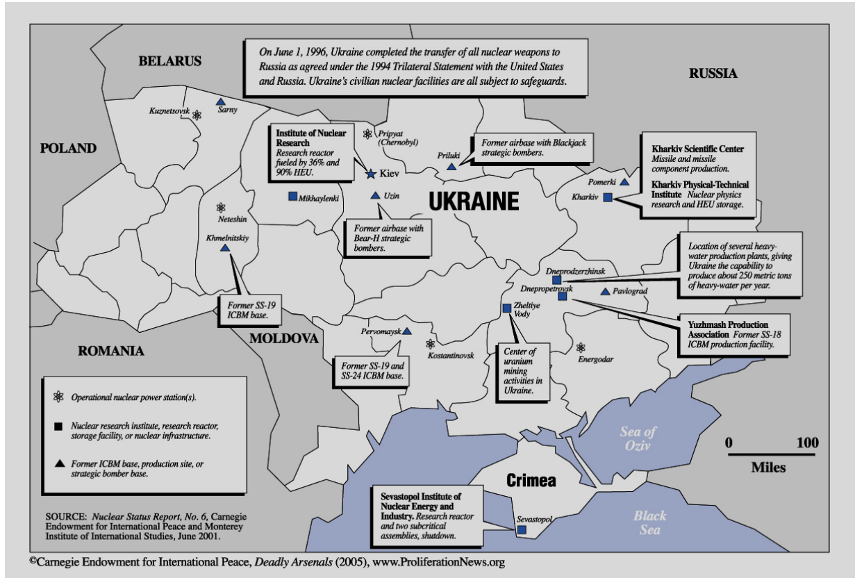
Harita 2. SSCB Döneminde Ukrayna'da Bulunan Nükleer Silahlar ve Tesisler 48

Rusya, kendisinin SSCB'nin devamı olduğunu iddia etmek suretiyle bölge ülkelerinde bulunan nükleer silahların kendisine verilmesi gerektiğini ileri sürmüştür. Silahların Rusya'ya teslim edilmesi Batı tarafından da desteklenmiştir. Nükleer silahlara egemenliğinin ve güvenliğinin güvencesi olarak bakan Ukrayna ise her ne kadar 1986 tarihli Çernobil faciasından sonra nükleer silahlara sıcak bakmasa da Rusya'ya karşı bağımsızlığını sağlamlaştırmak ve