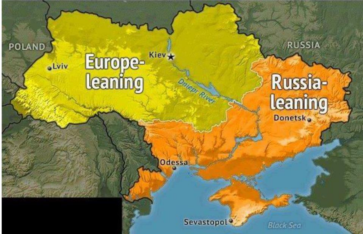
Harita 4. Ukrayna’nın jeopolitik konumu 97

Tarihsel süreç boyunca Rusya’nın “sıcak denizlere inme” hedefini gerçekleştirmede hayati bir öneme sahip olan Kırım, özellikle Rusya’nın Karadeniz üzerinden Akdeniz ve ötesinde hakimiyet kurma arzusunun bir sembolü olan Sivastopol limanının burada bulunması dolayısıyla Rusya için önemli bir bölge olmuştur 98 . Ukrayna krizinin Kırım’a sıçramasıyla Rusya’nın devreye girerek Kırım’ı ilhak etmesi, sorunun uluslararası bir boyut kazanmasına neden olmuştur. Nitekim AB ve ABD’nin Ukrayna’daki muhaliflere verdikleri destekle başlayan siyasi krize NATO da dahil olmuştur. 11 Mart 2014 tarihinde bağımsızlığını ilan eden