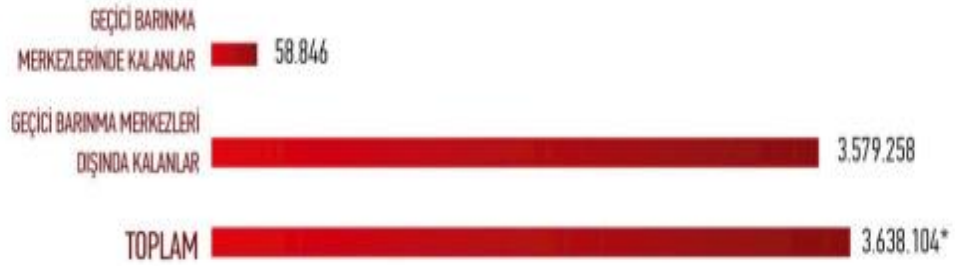
Şekil 1. Geçici barınma merkezleri içinde ve dışında kalan Suriyeliler (Göç İdaresi Başkanlığı, 2022)

Göç İdaresi Başkanlığı verilerine bakıldığında ise Şekil 1’de görüldüğü üzere 23 Aralık 2021 tarihi itibarıyla 5 ilde 7 geçici barınma merkezinde 58.846 Suriyeli sığınmacı; geçici barınma merkezleri dışında 3.579.258; toplamda ise 3.638.104 Suriyeli sığınmacı yaşamaktadır.