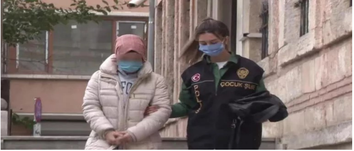
Görsel 2. Milliyet Gazetesi İlgili Haber Görseli

Sabah Gazetesi 5 : Sabah Gazetesi'nin 5 Nisan 2022 tarihli haberi " ATT Büşra'nın sütannelik yaptığı Nisa bebekten acı haber! Vicdansız anne pes dedirtti! " başlığıyla yayınlanmış, öncelik kahraman olarak yansıtılan sütanneye verilmiş, "acı haber" ve "vicdansız anne" sözleriyle de hem merak hem de merhamet duyguları uyandırılmaya çalışılmıştır. Aynı zamanda "sütanne" ve "vicdansız anne" gibi tanımlarla da kadının annelik rolü ön plana çıkarılmış, "iyi" ya da "kötü" anne karşılaştırılması ve sınıflandırılması yapılmıştır. Haberin alt başlığında biyolojik anne " Vicdansız annenin bebeğini terk ettikten sonra fuhuş yaptığı iddiası ortaya atıldı. " cümlesiyle "kötü anne" olmanın yanı sıra "kötü kadın" olarak da toplumsal yaşama uymadığı vurgulanmıştır.