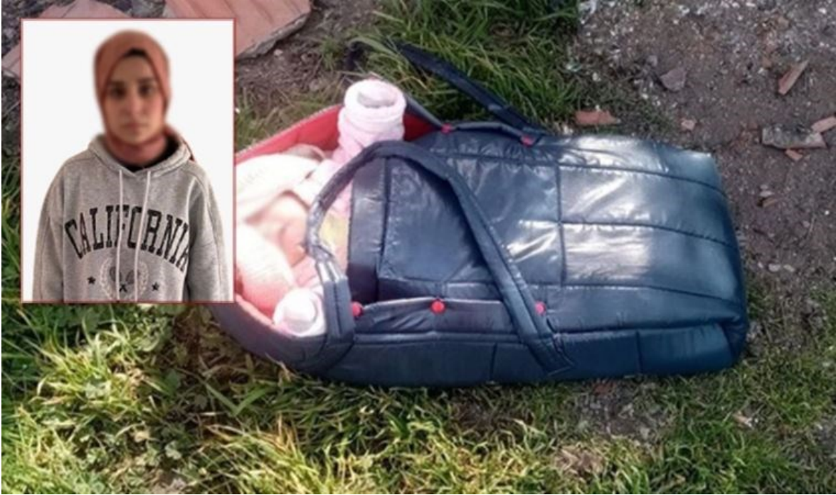
Görsel 1. Cumhuriyet Gazetesi İlgili Haber Görseli

Milliyet Gazetesi 4 : Milliyet Gazetesi’nin 7 Nisan 2022 tarihli “Annesi Nisa bebeği neden özellikle oraya terk etti? Can yakan şüphe” başlıklı haberinde bebeğin biyolojik annesi “anne” kelimesiyle adlandırılmıştır. Haberin üst başlığındaki “Can yakan şüphe” ve alt başlığındaki “ ... bebek, Türkiye’nin yüreğini sızlattı” satırları ile habere duygusal bir bakış açısı