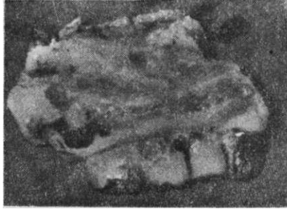
Resim 3 : Operasyon sonrası rezeke edilen maksiller proçesin vestibülden görünümü.

Sağ maksiller bölgede elektro cerrahi yardımı ile kanin dişin distalinden fornix vestibülüne kadar uzanan dik bir inzisyon yapıldı ve bu inzisyon hattı tüber bölgesine kadar vestibül derinliğini kapsayacak şekilde uzatıldı. Palatinal bölgede ise kanin-premolar dişlerin arasından sert damak orta hattına kadar yapılan inzisyon damak orta hattını takiben sert damak arka sınırına kadar uzatıldı ve buradan vestibülüm bölgesinde yapılan inzisyon ile birleştirildi. Sinüs alt duvarı, burun tabanı ve burun yan duvarını içerecek şekilde; palatinal kompakta guj çekiç yardımı ile, vestibüler kompakta ise Aesculap-Elan-E tipi motor ile düz testere yardımı ile kesilerek maksiller proçes rezeke edildi (Resim 3, Resim 4). Cerrahi sahada üst sinüs duvarı ve Burun septumu ile kohanaların normal anotomik yapıda ve sağlıklı mukoza ile örtülü olduğu görüldü. Bölgeye vazelinli yastık tampon konularak, askı dikişi ile tespit edildi. Cerrahi materyal rutin patolojik takibe alındı. 17.05.1990 tarihli histopatolojik raporda insizyon hattında patolojik materyal bulunmadığı tespit edildi*.