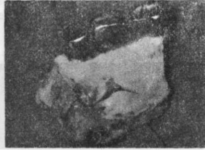
Resim 4 : Rezeke edilen maksiller proçesin palatinal görünümü.

Prostoperatif 10. günde hasta radyoterapi için radyoloji kliniğine gönderildi. Burada yapılan tetkikte cerrahi müdahalenin bu aşamada yeterli olduğu ve radyoterapiye gerek bulunmadığı bildirildi. Hastanın 3. ay, 6. ay, ve 1 yıllık kontrolleri yapılarak herhangi patolojik bulgu olmadığı tespit edilerek, operasyon sahası defekt protez ile restore edildi.