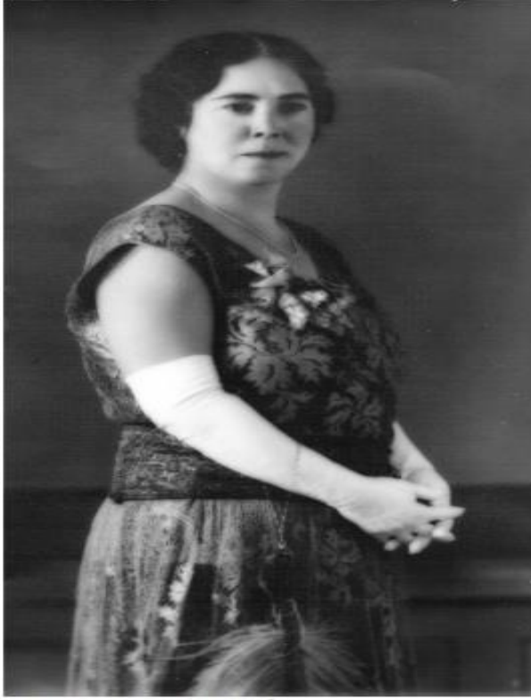
HERMILA GALINDO, PIONERA EN SEÑALAR AL CLERO COMO AGENTE DE SUJECIÓN DE LA MUJER. FUENTE: ARCHIVO DE LA SRA. ROSARIO TOPETE GALINDO.

Kaynak: https://docplayer.es/43485167-Hermila-galindo-sol-de-libertad.html