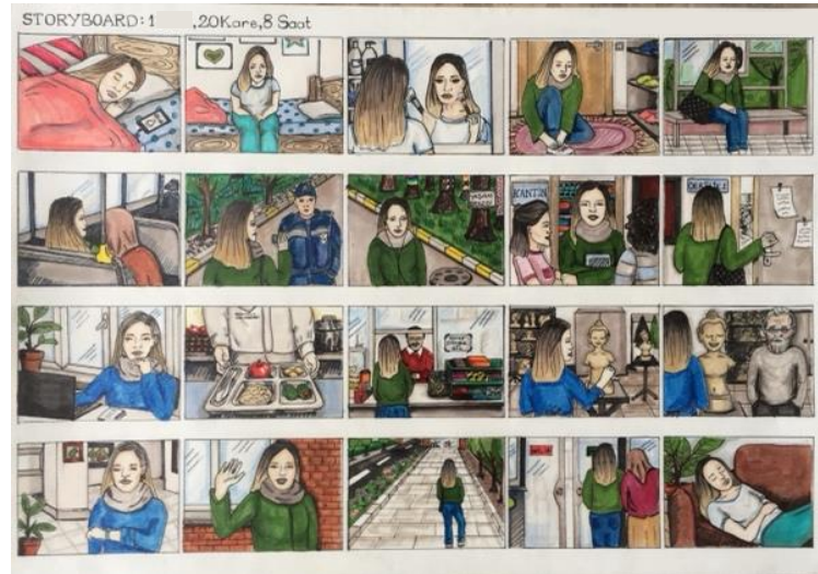
Şekil 7. Aslı'nın çalışması

Storyboard çalışmasını görselleştirmede, öğrencilerin genellikle saat ve kapı gibi zaman ve mekân belirten imgeleri tekrarladıkları görülmüştür. Öğrenci çalışmalarında saat genel olarak hikâyenin başlangıç karesi olarak kullanılmış ve farklı karelerde de zamanı belirtmek için gösterilmiştir. Örneğin, Fatih “Çalar saat üzerinde sabah 09’u gösteriyor. 09’u göstermesinin sebebi derslerin 09.00’da başladığından kaynaklı. Bunu ifade etmeye çalıştım.” sözleriyle saati okulun başlangıcı olarak kullandığını söylemiştir. Tuğçe ise saati farklı karelerde göstermesinin nedenini “Zaman ve okul çok önemli. Sürekli bir yerlere yetişmek zorundayız. Derse yetişmek zorundayız. Sürekli zamana göre hareket ediyoruz. O yüzden” sözleriyle ifade etmiş ve zaman-okul arasında bağlantı kurmuştur. Böylelikle öğrencilerin saati kullanarak okuldaki zamansal sistematiği tasarımlarında yansıttıkları söylenebilir. Kullanılan kapı imgeleri de genellikle