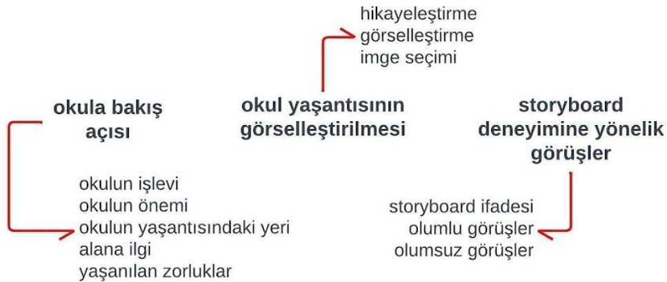
Şekil 1. Temalar ve alt temalar

Arařtırmada elde edilen verilerin analiz edilmesi bazı aşamalarda gerçekleşmiştir. Analizin ilk aşamasında, storyboard çalışmalarından ve yarı yapılandırılmış görüşmelerden veriler elde edilmiştir. Elde edilen veriler bilgisayar ortamında yazıya aktarılmıştır. Toplamda 6 öğrenci çalışması ve 38 sayfa Word dökümü elde edilmiştir. Elde edilen Word dokümanı NVIVO 11 programına aktarılmış ve analize hazır hale getirilmiştir. İkinci olarak genel anlamı çıkartabilmek amacıyla veriler baştan sona okunmuş ve öğrenci çalışmaları incelenmiştir. Creswell'e (2012, s.243) göre veri analizinin ilk aşaması, durumu saptayabilmek için verideki genel duygunun yakalanmasıdır. Üçüncü olarak arařtırma soruları dahilinde veriler kodlanmış ve temalandırılmıştır. Dufour & Richard (2019, s.9, 10) göre tümevarımsal analiz süreci; ham verinin kodlanması, kodların daha geniş bir tema altında gruplanması ve ana temaların oluşması şeklinde ilerlemektedir. Arařtırmanın analizinde ise öncelikle, başlangıç kodlamalar yapılmıştır. İkinci olarak benzer içerikteki kodlar kapsayıcı bir tema altında sınıflanmış ve bu temalara birkaç kelimelik tanımlayıcı isimler verilmiştir. Süreçte temalar tekrar gözden geçirilerek birbirleriyle örtüşen, benzer temalar birleştirilmiş ve bazı temalar da elenmiştir. Analiz sonucunda ise üç ana tema ve alt temalar ortaya çıkmıştır. Bu tema ve alt temalar Şekil 1'de sunulmuştur.