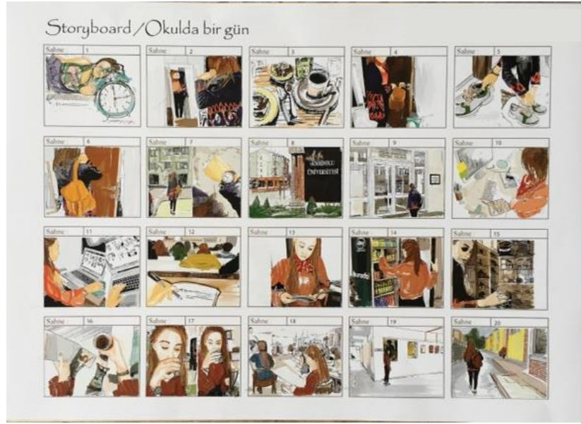
Şekil 5. Tuğçe'nin çalışması

Öğrencilerin hikâyeleştirme sürecinde, okulun sistematik zaman akışını; okulun dış çevresi, derslik, atölye, kantin, yemekhane, sergileme alanları, kütüphane gibi fiziksel organizasyonunu ve bu organizasyon içinde yapılması beklenen eylemleri ana hatlarıyla yansıttıkları söylenebilir.