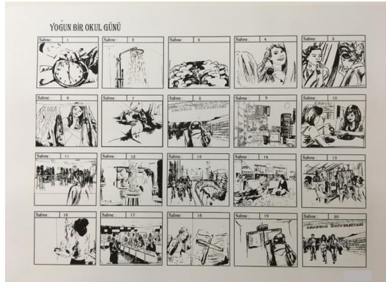
Şekil 2. Melisa'nın çalışması

itibaren ele alırsam yoğun.” sözleriyle açıklamış ve okulun yoğun bir süreç olduğunu ifade etmiştir.