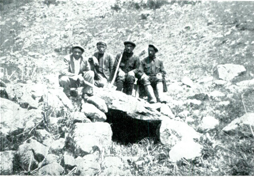
Res. 1 — Çaycı köyü (Arpaçay) galerili dolmenin galeri ağızı.