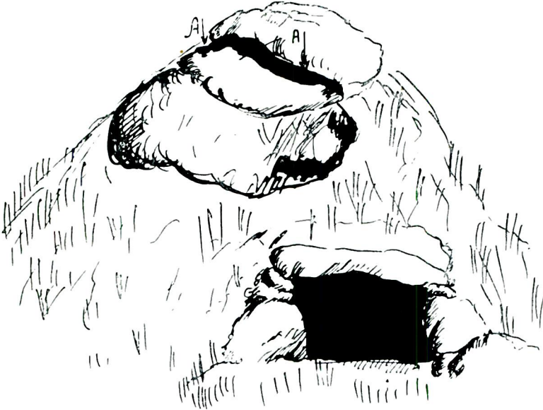
Res. 2 — Çaycı köyü galerili dolmenin genel görünüşü. (A) yarık. (Dr. K. H. Arran'a göre).