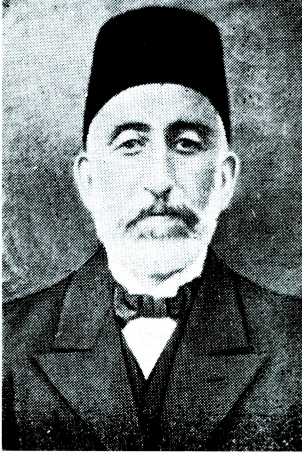
1 — Atatürk'ün ilkokul Öğretmeni Şemsi Efendi ( 1852? — 1916 )