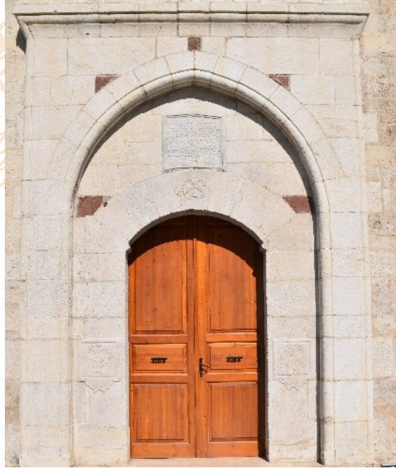
Görsel 4: Taşhoron Kilisesi Ana Giriş Kapısı