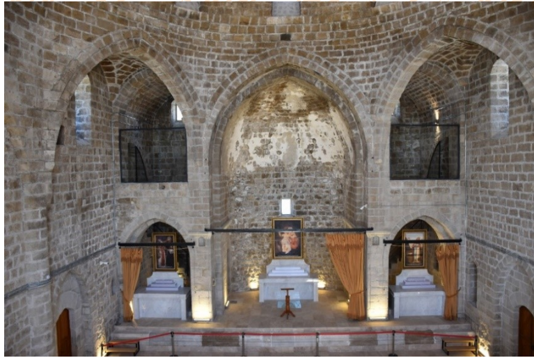
Görsel 7: Taşhoron Kilisesi Bema Bölümü

Batı cephesindeki ana giriş kapısının tam karşısında yer alan bema bölümü zemin kotundan yüksekte yer almaktadır ve ön kısmı bitkisel bezeme motifli taş bloklarla süslenmiştir. Bema bölümünün sağ ve solunda, odalara çıkmayı sağlayan birer taş merdiven vardır (Görsel 7).