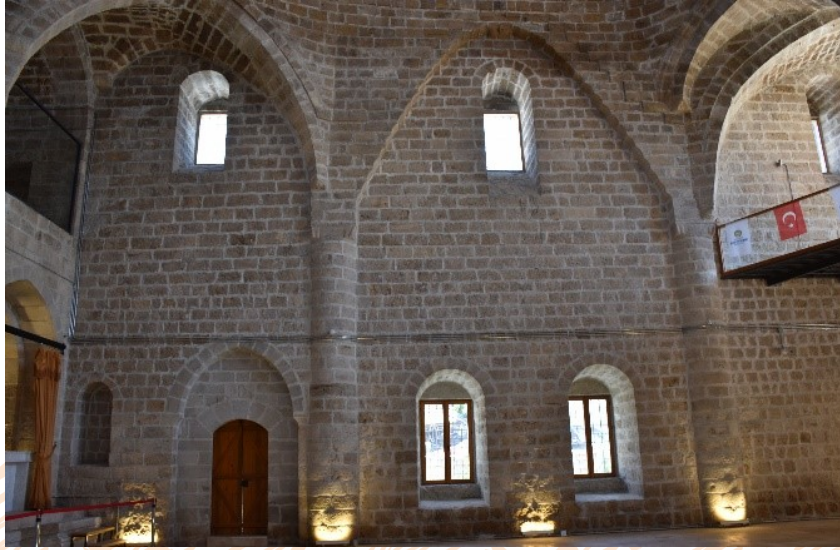
Görsel 5: Taşhoron Kilisesi Sağ Duvar Fil Ayak Kesiti

Batı cephesinden girişte iki adet ve ana giriş kapısının tam karşısında iki adet fil ayak yer almaktadır (Görsel 5). Bunlar dışında iç mekandaki mevcut dört adet taşıyıcı ayak, kuzey-güney cephedeki duvarlara gömülü haldedir. Böylelikle kilisenin taşıyıcı sistemi sekiz adet ayak üzerindedir.