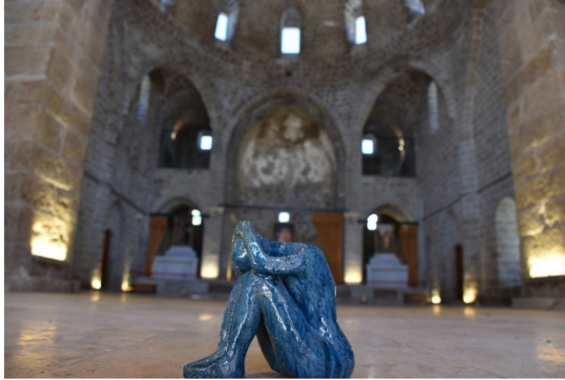
Görsel 9: Fatma Berna AKALIN, Görmedim-Duymadım- Bilmiyorum I, Şamot Çamuru, Elle Şekillendirme, 15x15 cm, 2019

İnsan, doğası gereği konuşmak ve paylaşmak ister. Yaşadığı toplumda özgürce düşüncesini ifade edemeyen, dini inanışını gizleyen, hatta ismini bile değiştirmek zorunda kalan insanlar, korkuyla yaşamaya, zamanla içinde yaşadığı ortamdan uzaklaşarak iletişim sağlamamaya başlar ve içine kapanır. Bu insanların ruh halini göz önünde bulundurarak pişmiş şamot çamuru ile şekillendirilen heykel formları, 1050 ° C sırlı pişirim yapılmıştır (Görsel 9-10).