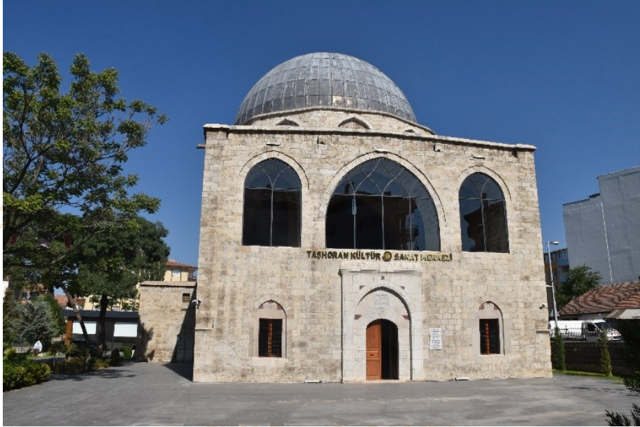
Görsel 2: Taşorun Kilisesi Ön Cephe

1335 m 2 alan üzerine kurulu kilise, 15,90 x 26,40 metre boyutunda, bazilika planlı dikdörtgen bir yapıdır. Taşıyıcı duvarları kesme taştan, dolgu duvarları ise moloz taştan yapılan kilise, Anadolu'daki tek kubbeli kiliselerin önemli örneklerinden biridir (Görsel 2). Ana giriş kapısı batı cephesinde yer almaktadır ve mermerle süslenmiştir. Kapı üstüne ise yine mermerden yazılmış bir kitabe yerleştirilmiştir (Görsel 4). Ayrıca güney cephesinde iki adet, kuzey cephesinde bir adet, yapıya sonradan eklenen vaftiz odasının batı cephesinde bir adet daha kapı yer almaktadır. Kiliseden bağımsız olarak kuzeydoğuda, bahçeye, modern bir mimariye sahip kafe de inşa edilmiştir.