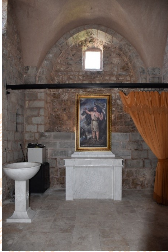
Görsel 8: Taşhoron Kilisesi Vaftiz Odası

Hem içerden hem de dışarıdan giriş yapılabilen, aydınlatması tepe pencerelerden sağlanan en büyük oda mahiyetindeki vaftiz odasına, vaftiz havuzu yerleştirilerek kilisede tüm ritüellerin yapılabilmesine olanak sağlanmıştır (Görsel 8).