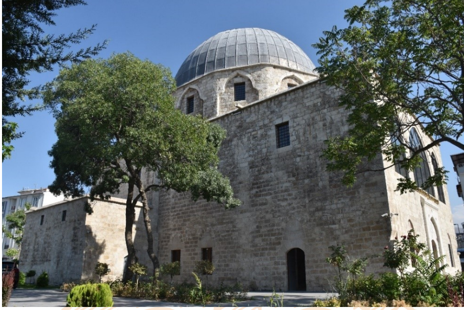
Görsel 3: Taşhoron Kilisesi Arka Cephe