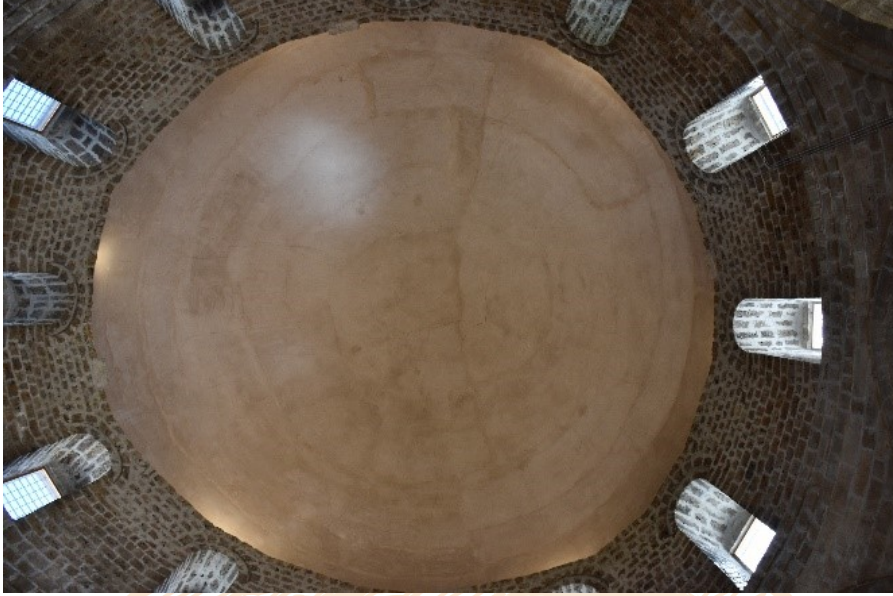
Görsel 6: Taşhoron Kilisesi Kubbe Pencereleeri

Batı cephesindeki ana giriş kapısının tam karşısında yer alan bema bölümü zemin kotundan yüksekte yer almaktadır ve ön kısmı bitkisel bezeme motifli taş bloklarla süslenmiştir. Bema bölümünün sağ ve solunda, odalara çıkmayı sağlayan birer taş merdiven vardır (Görsel 7).