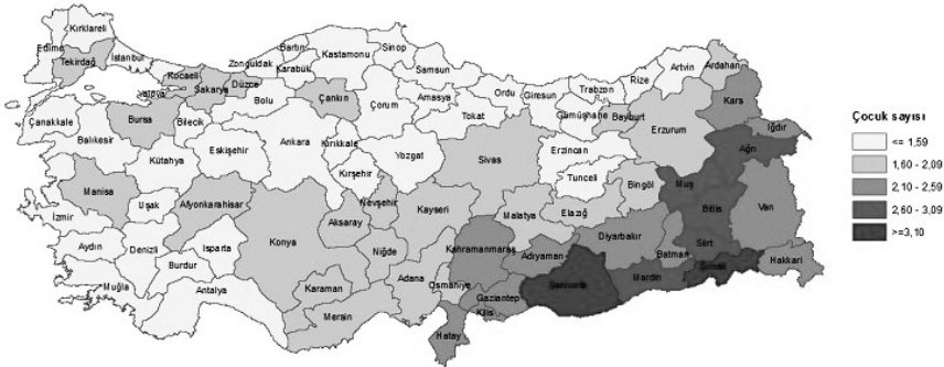
Şekil-2: İllere Göre Toplam Doğurganlık Hızı, 2020

(Türkiye İstatistik Kurumu, 2021, https://data.tuik.gov.tr/Bulten/Index?p=Dogum-Istatistikleri-2020-37229 , 22.05.2022)