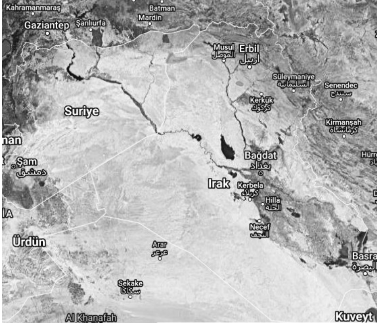
Şekil – 1: PKK'nın Irak'taki Kampları ve Suriye'de Sağladığı Alan Hakimiyeti

(ConflictTR.com, https://umap.openstreetmap.fr/tr/map/conflictr-com_510972#6/34.678/44.077,25.05.2022 )