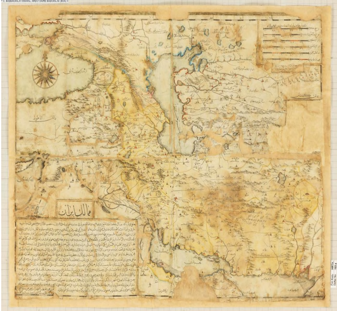
BOA, HRT.h.,103/1 (29 Z 1142/15 Temmuz 1730)