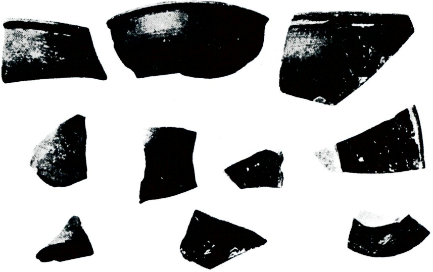
Res. 5 — Heraeum? yerleşme yeri Keramikleri.