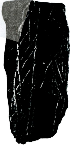
Res. 2 — Silitvri - Kanallı Köprü Kalkolitik'ine ait bezekli büyükce bir çanak'ın parçaları.