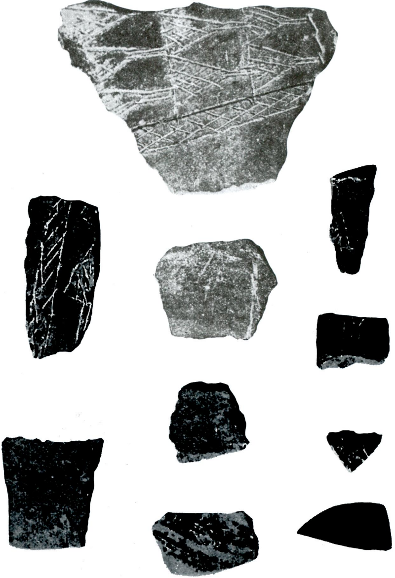
Res. 3 — Silivri - Kanallı Köprü höyüğüne ait 2. Resimde görülen bezekli kramiklerden başka düz, siyah, grimsi, kırmızımtrak, elle yapılmış parçalar ve Helenistik devre ait bir parça.