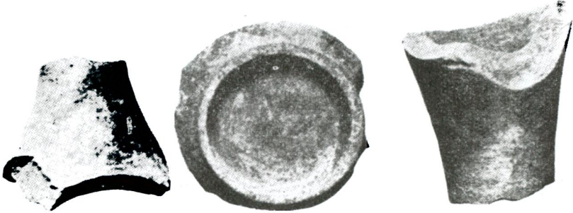
Res. 6 — Heraeum? yerleşme yeri Keramikleri