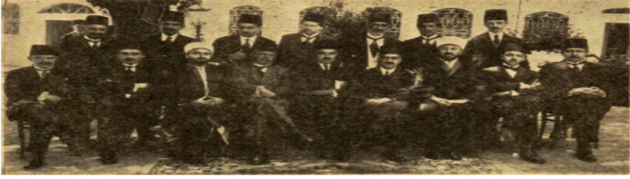
1338 — 1339 (1922 — 1923) Ders Yılı Öğretim Üyelerinden Bir Grup Sineklibakkal'daki MÜLKİYE MEKTEBİ Bahçesinde