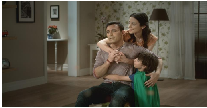
Resim:1 Kısa Film (Emniyet Kemeri)

https://www.youtube.com/watch?v=eEtAKJvD_1U