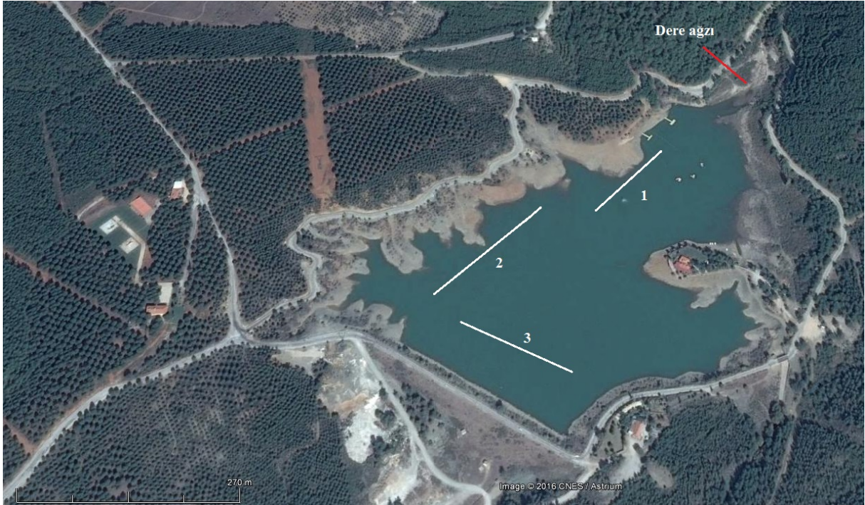
Şekil 1. Ula Göleti (Örnekleme bölgeleri numaralandırılmış beyaz çizgilerle gösterilmiştir) ( https://earth.google.com/ ).

Ula Göleti Muğla ili sınırları içerisinde olup, 1987 yılında sulama amaçlı olarak yapılmıştır. 645 m rakımlı göletin havzası 9.750 km 2 , çevresi 2,5 km ve en derin yeri 20 m'dir (Küçükçe, 1999; Önsoy vd., 2011). Ula Göleti Akarca Çayı adı verilen küçük bir dereден beslenir. Gölet aynı zamanda yangın helikopterleri için de su kaynağı olarak kullanılmaktadır (Önsoy vd., 2011).