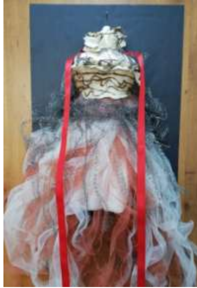
Görsel 10-Tasarım II

Gelinliği temsilen kullanılan kil bulaşık teli ile birleştirilerek kullanılmış geline yakılan kınanın renginin hayatın içindeki pek çok süreçte farklı biçimde karşımıza çıktığı buradaki lekelenmelerin evlilik hayatında kişilere bıraktığı olumlu/olumsuz tüm izlerle benzerliğine atıfta bulunulmuştur (Görsel 9).