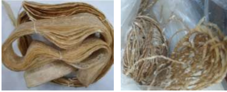
Görsel 3- Bağırsak ve Bağırsaktan Oluşturulan İplik

Hayvansal kaynaklı lifler ve yüzeyler yüzyıllardır insanoğlunun temel ihtiyacı olan giyinme ve yeme içme ihtiyacını karşılamaktadır. Hayvan derileri giyimde, hayvan yünleri lif/ipliğe dönüştürülerek giyim kuşam ve ev donatılarında kullanılmaktadır. Hayvansal dokulardan biri olan ve genellikle sucuk yapımında kullanılan bağırsak boyuna 0.5 cm genişliğinde kesilerek geleneksel ip eğirme yöntemiyle eğirilerek ip oluşturmuş ve dokuma olabileceği kanaatine ulaşılmıştır (Görsel 3).