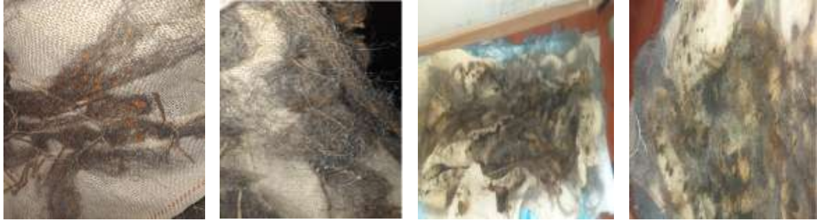
Görsel 7- Bulaşık Telinin Kumaşta Küflendirilmesi

Tasarım için pamuklu, krem renkli, düz dokuma bir yüzey seçilmiş düzensiz biçimde yüzeye yerleştirilen bulaşık teli sıcak su ile düzensiz aralıklarla sulanmış evlilik sürecinin belirsizliğinde olduğu gibi zamanla aldığı şekil gözlemlenmiştir. Evlilikte de olduğu gibi yüzeyde de zamanla birikim olmuş küflenmeler meydana gelmiş yüzeye ve tellerin birbirine tutunması hem evlenen kişilerin aralarındaki bağlanmaya benzer bulunurken zaman içindeki eskime eskidikçe yeni formlar olarak yeni kalmaya da atıf yapılmıştır (Görsel 7).