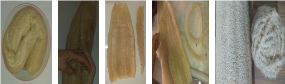
Görsel 4- Kabak Lifi ve Kabak Lifinden İplik