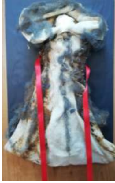
Görsel 8-Tasarım I