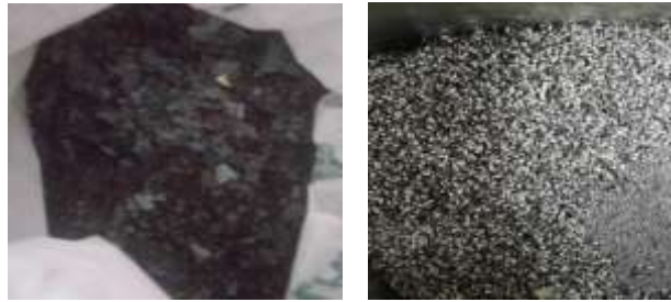
Görsel 2- Demir Cürufu ve Çelik Talaşı

Düğün merasiminin bir parçası olan kına gecesinde gelinin ve damadın eline yakılan/sürülen “kına rengini” elde etmek amacıyla demir cüruf ve çelik talaş su içinde bekletilerek oksitlendirilmeye çalışılmıştır. Bu materyaller suda bırakılarak renk araştırılması yapılmış fakat herhangi bir renk elde edilememiştir. Bu malzemede herhangi bir deformasyon