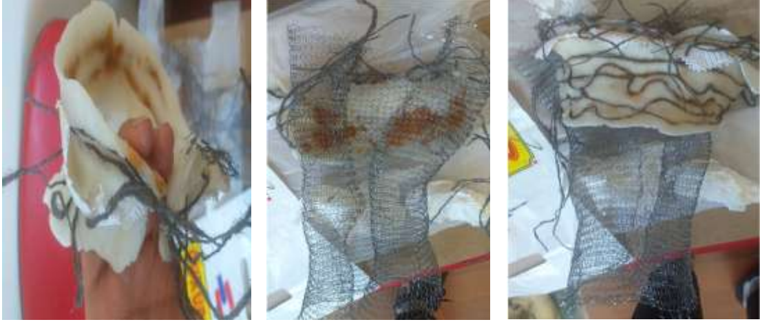
Görsel 9- Bulaşık Teli ve Kilin Birlikte Yorumlanması

Gelinliği temsilen kullanılan kil bulaşık teli ile birleştirilerek kullanılmış geline yakılan kınanın renginin hayatın içindeki pek çok süreçte farklı biçimde karşımıza çıktığı buradaki lekelenmelerin evlilik hayatında kişilere bıraktığı olumlu/olumsuz tüm izlerle benzerliğine atıfta bulunulmuştur (Görsel 9).