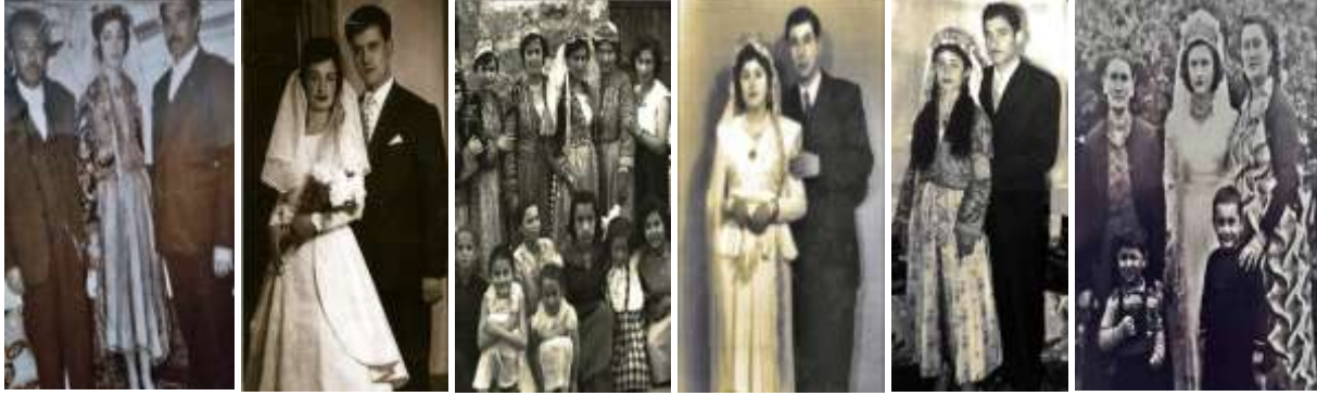
Görsel 1- Gelin Teli Takmış Gelinler

çağına gelen kızlara ucundan bir parça verilir ve bununla kısmetinin açılacağına, bu parça ne kadar kısa olursa o kadar çabuk gelin olunacağına inanılırdı. Gelin başlarının önemli bir parçası olan gelin telinin gri renkte telden hazırlandığı gibi inceltilmiş gümüş levhalardan kesilmiş örneklerine de rastlanmaktadır.