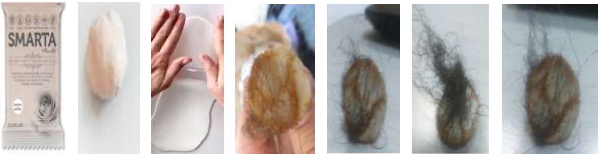
Görsel 6- Smarta Akıllı Kil ile Bulaşık Teli