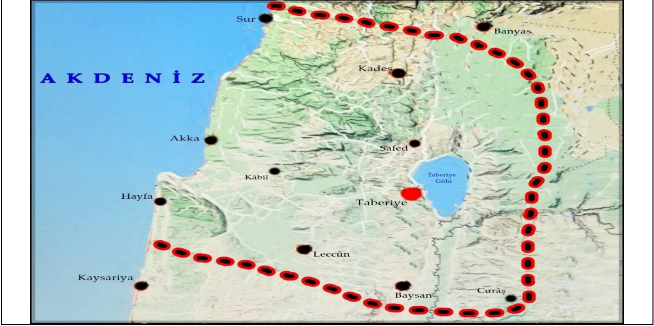
Harita 3. 10 ve 11. Yüzyıllarda Ürdün Cündü (Google, 2023), (Düzenleyen: Zafer ÖZDEMİR).

gösterildiği de olmuştur. Kaynaklarda 10. yüzyılın başlarında bölgeden yıllık olarak toplanan vergilerin araziler dışında ortalama 100 bin dinar civarında olması bölgenin alan ve nüfus açısından diğer cünd merkezlerinden daha küçük olduğunu gösteren bir delildir (Kudâme b. Cafer, 2018, s. 153; Yakûbî, 2021, s. 142). Genel anlamda ise bölgenin batısında Rum denizi (Akdeniz), doğusunda ve kuzeyinde Dimaşk cündü şehirleri, güneyinde ise Filistin bölgesi yer almaktadır. Bölgenin önemli şehirleri ise; Taberiye, Sur, Akka, Tibnîn, Safed, Aclun, Fihl, Beysan, Kâbil, Curâş ve Sevâd şehirleri olarak zikredilmiştir (Ciner, 2018, s. 162; İbn Havkal, 2021, s. 152; Opçin, 2015, s. 150; Ya'kûbî, 2021, s. 141). Sırası ile bu şehirlerden önemli olanları ise şu şekildedir.