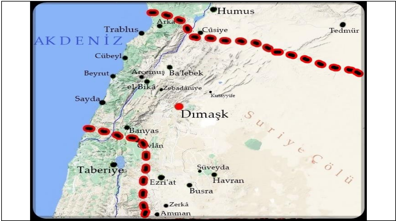
Harita 2. 10 ve 11. Yüzyıllarda Dimaşk Cündü (Google, 2023), (Düzenleyen: Zafer ÖZDEMİR.

İslam coğrafyacıları Şam bölgesinin merkezinin Dimaşk olduğunu belirtmişlerdir. Bu eyalet merkezi, kuzey güney yönünde bölgenin orta noktasında olup kuzeyinde Humus cündü, güney batısında Ürdün cündü ve güneyinde ise Filistin cündü bulunmaktadır. Doğusu ise kırsal olup çöllerin yaygın olduğu bir alandır. Dimaşk cündünün şehirleri ise; Guta ovasında bulunan Dimaşk , deniz kenarında bulunan Sayda , Beyrut , Trablus/Atrablus şehirleri, Arka/Irka , Cübeyl ; Bika' kırsal bölgesinin şehirleri olan Ba'lebek , Kâmid , Arcemuş , Zebedânî ; Havrân kırsal bölgesinin şehri olan Busra ve Sarhad ; Beseniyye kırsal bölgesinin şehri olan Ezri'ât , Belkâ kırsal bölgesinin merkez şehri olan Amman , Cibâl kırsal bölgesinin şehri olan Arendel ve Cevlân kırsal bölgesinin şehri olan Baniyâs şehirleridir (Ciner, 2018, s. 162; İbn Hurdazbih, 2019, s. 74; Ya'kûbi, 2021, s. 143). İslam coğrafyacılarının eserlerinde yukarıda sayılan şehirlerden bazıları hakkında verdikleri bilgiler ise şu şekildedir.