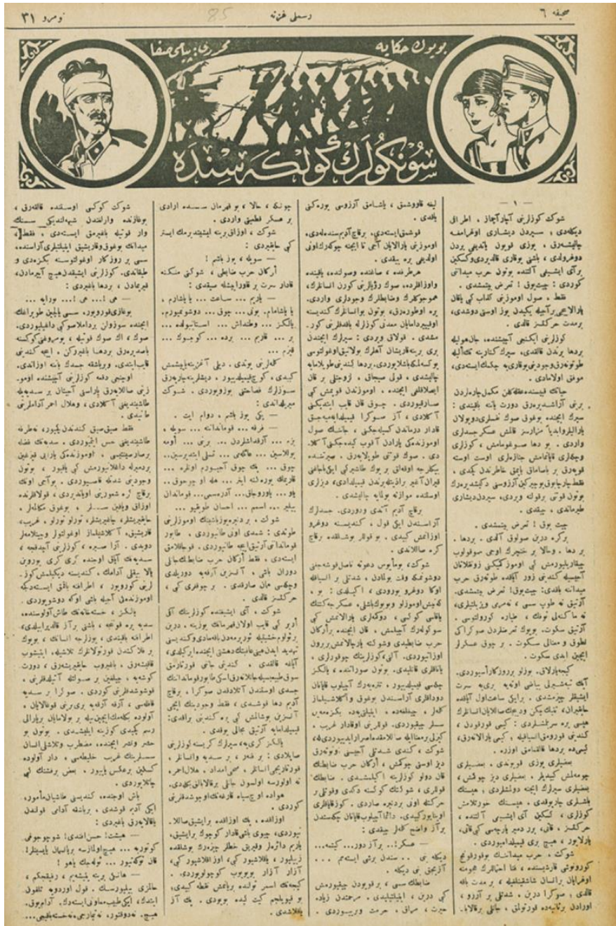
Tefrikanın 5 Nisan 1340 tarihli Resimli Gazete'deki ilk sayfası