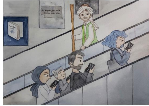
Görsel 6: Öğrenci Ürünü

Reyhan teknolojinin toplumun yapısını değiştirdiğine yönelik görüşlerini anlatan illüstrasyon çalışmasında (Görsel 5 ve 6) açıklayıcı metin olarak şu bilgileri vermiştir: