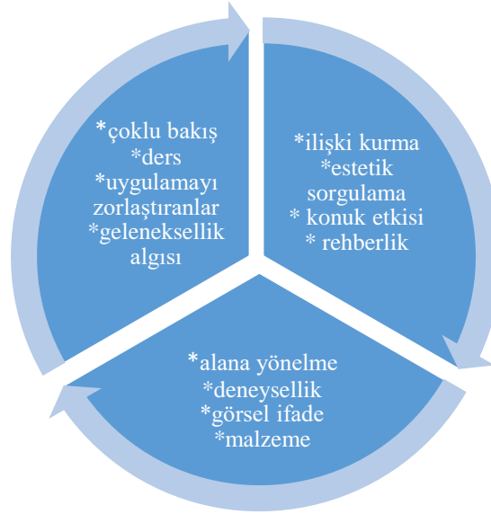
Şekil 1: Temaların Bulgulara Göre Dağılımı