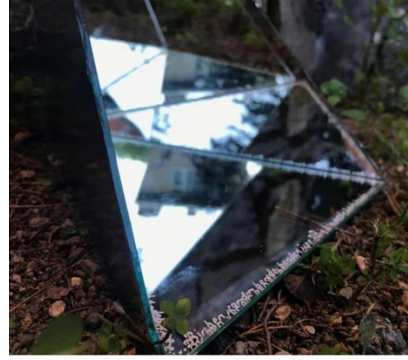
Görsel 1: Öğrenci Ürünü Görsel 2: Öğrenci Ürünü

Katılımcılardan Esen'nin temayı "bizden biri" ifadesiyle kendi deneyimiyle ilişkilendirmeye çalıştığı ve bu durumu görsel olarak mekânın ve tekniğin kullanımıyla da harmanladığı (Görsel 3) söylenebilir: