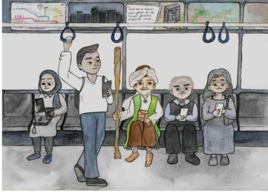
Görsel 5: Öğrenci Ürünü

“Hani geleneksel diye bize verilen şey kopyalamak, hani birebir kopyalamak, almak. Onu hatta malzeme anlamında da dediğim hani mimaride çünkü eseri gösteren ya da mimari yapıyı gösteren o estetik duruşu bir taraftan da malzeme sağlar. [...] bunu doğru kullanıp bir de üstüne o malzemeleri, o işte günümüzün getirdiği teknolojiyle bakalım nasıl bir araya getirebiliriz? Birebir kullanmak değil de esinlenmek belki bunun ikisini bir araya getirerek bir harmoni kazandırmak aslında “ (G2).