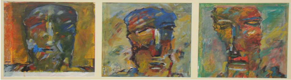
Resim 11: Ahmad Raid Mohammad, İsimli (Anonymous), Kâğıt Üzerine Akrilik Boya, 2010..

1977 yılında Suriye'nin Halep kentinde dünyaya gelen sanatçı Mohammed Fa-tih Güzel Sanatlar Merkezi'nde eğitimini tamamlamıştır (Röportaj, 2019). 2013 yılında Türkiye'ye göç eden sanatçının savaş öncesi eserlerinde insan, eserlerinin ana temasıdır. Savaş öncesi dönemde insan figürünü portreci bir anlayışta aktarmıştır. Eserlerinde siyah, sarı, mavi ve kırmızı renk tonları ile soyut ekspresyonist (Res. 11) çalışmalar yaptığı görülmekle birlikte bu dönemde yaptığı portre çalışmaları Suriye modern sanatın önemli temsilcilerinden biri olan Fateh Moudarres'in portreleriyle benzerlik göstermektedir. Savaş sonrası eserlerinde yağlı boya tekniği kullanan sanatçı, mekân kaygısı gütmeyen yoğun olarak sinirli, mutsuz ve hüzünlü insanları yalnız ya da grup çalışmaları içinde betimlemiştir. Ayrıca sanatçının az sayıda natüremort eseri de vardır.