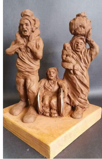
Resim 6: Akram Saffan, İsimsiz (Anonymous), Kil ve Metal, 2018. (Akram Saffan'ın Arşivinden, 2019).

Sanatçı, Türkiye'ye gelmeden önce mermer ve kil ağırlıklı malzeme ile çalışırken Türkiye'ye geldikten sonra kil ve ahşap malzemenin öne çıktığı eserler verdiği görülmektedir. Ayrıca sanatçının bazı eserlerini boya kullanarak renklendirme yapması