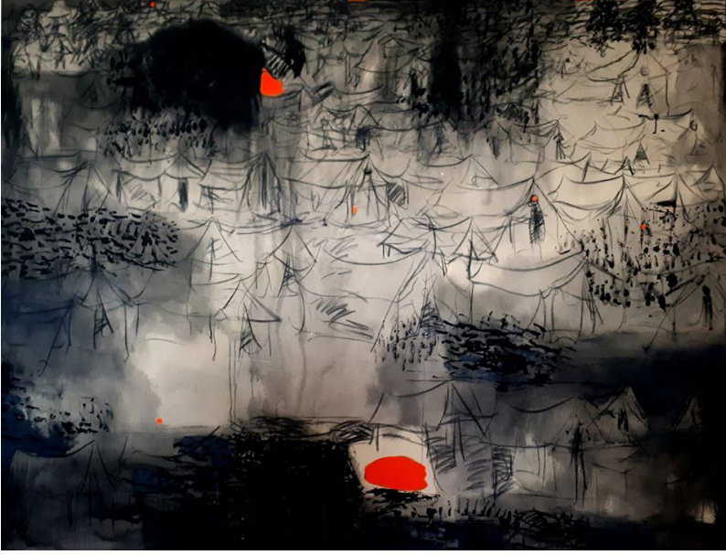
Resim 9: İbrahim Alhassoun, İsimless (Anonymous), Mixed Media on Canvas, 2020. (İbrahim Alhassoun'un Arşivinden, 2020).