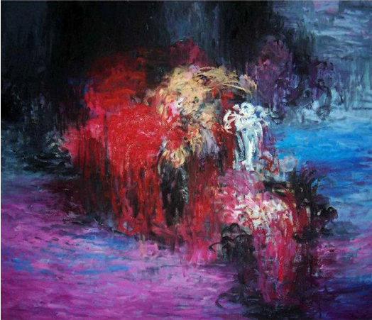
Resim 18: Khayyam Zedan, Çöp (Rubbish), Tuval Üzerine Yağlı Boya, 150x185 cm., 2010.

1983 yılında Suriye'nin Salamiyah kentinde dünyaya gelen Khayyam Zedan lisans ve yüksek lisans eğitimini Şam Üniversitesi Güzel Sanatlar Fakültesi Resim Bölümü'nde tamamlamıştır. Sanatçı 2009-2015 yılları arasında da aynı üniversitede akademisyen olarak çalışmıştır (Röportaj, 2019). 2016 yılında Türkiye'ye göç eden sanatçı savaş öncesi dönemde yoğun olarak siyah, mavi ve pembe renk tonları ile ekspresyonist ve soyut ekspresyonist (Res. 18) çalışmalar yapmıştır. Bu dönemde teknik olarak tuval üzeri yağlı boya çalışan sanatçı soyut figüratif çalışmalar yapan ve konu olarak eserlerinde soyut bir mekân kurgusu içerisinde insanların ruhsal durumlarını irdelemiştir.