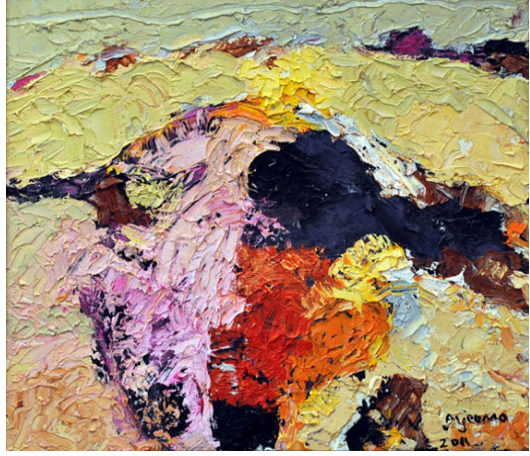
Resim 1: Abd Allatif Aljeemo, İsimiz (Anonymous), Tuval Üzerine Akrilik Boya, 2011. (Abd Allatif Aljeemo'nun Arşivinden, 2019).

Bu dönem eserlerinde de teknik olarak çeşitliliğe yönelen sanatçı konu olarak 2016 yılından itibaren özellikle figüratif çalışmalarda