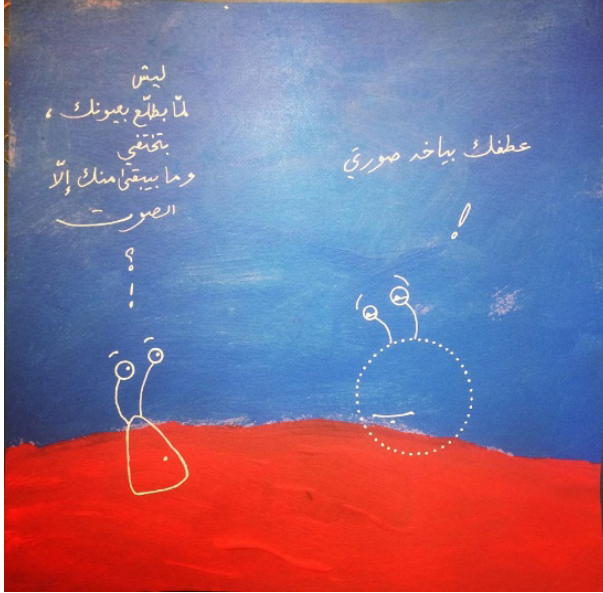
Resim 23: Zolfaqar Shaarani, Bir ve Sıfır Diyalogları (One&Zero Dialogues), Kâğıt Üzerine Karışık Teknik, 30x30 cm., 2019. (Zolfaqar Shaarani'in Arşivinden, 2019).