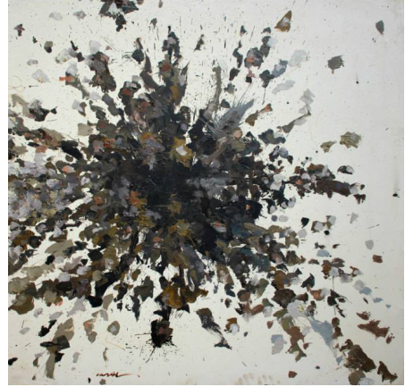
Resim 14: İmad Habbab, İmparatorluk Patlaması (The Imperial Explosion), Tuval Üzerine Yağlı Boya, 120x120 cm., 2012. (İmad Habbab'ın Arşivinden, 2019).