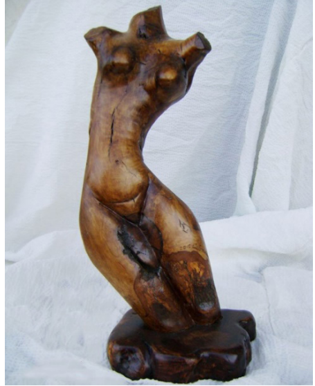
Resim 16.: Mustafa Teet, İsimsiz (Anonymous), Zeytin Ağacı, 55x12x5 cm., 2010. (Mustafa Teet'in Arşivinden, 2019).

Sanatçı savaş sonrası dönemlerde ise metal, polyester gibi malzemeler ile soyut eserler (Res. 17) vermeye devam etmiştir. Kullandığı malzemeleri özellikle savaş ve sonrası dönemde boya yardımı ile de renklendirmeyi tercih eden sanatçı, soyutlamacı yaklaşımla üretmeyi sürdürmüştür. Bu dönem eserlerinde konu olarak savaş ortamını ve bundan etkilenen insanları işlemiştir.