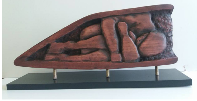
Resim 7: Akram Saffan, İsimsiz (Anonymous), Ahşap, 2017. (Akram Saffan'ın Arşivinden, 2019).

dikkat çeken bir unsur olarak karşımıza çıkmaktadır. Bu dönemlerde portre çalışmaya devam eden sanatçının yaptığı portreler, portre ve mekân sentezi olarak karşımıza çıkarken genellikle tema olarak savaş esnasında yaşanan zulüm ve göç yolundaki olaylar işlenmiştir.