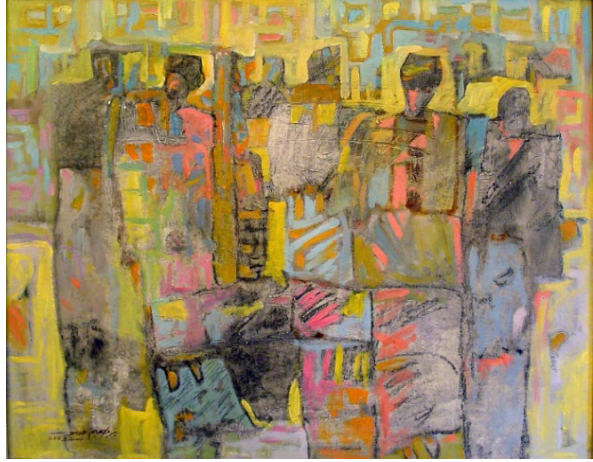
Resim 8: İbrahim Alhassoun, İsimsiz (Anonymous), Tuval Üzerine Yağlı Boya, 2003. (İbrahim Alhassoun'un Arşivinden, 2019).

1972 yılında Suriye'nin Halep kentinde dünyaya gelen İbrahim Alhassoun lisans ve yüksek lisans eğitimini Şam Üniversitesi Güzel Sanatlar Fakültesi Resim Bölümü'nde tamamlamıştır (Röportaj, 2019). 2014 yılında Türkiye'ye göç eden sanatçı savaş öncesi dönemde genel olarak sarı, mavi ve turuncu renk tonları ile kübik çalışmalar yapmıştır. Bu dönemde tuval üzerine yağlı boya tekniği kullanan sanatçı konu olarak figür ve kent betimlemeleri (Res. 8) resmetmiştir.