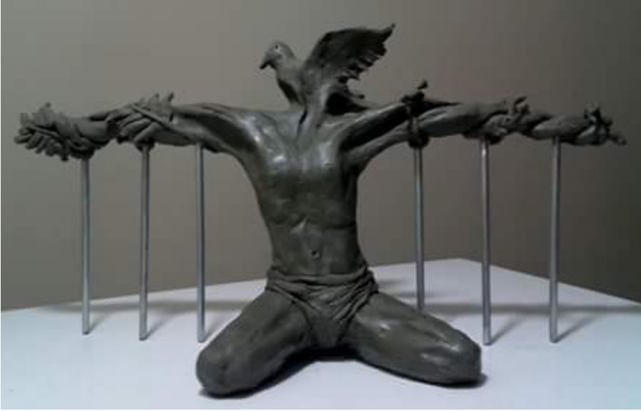
Resim 5: Akram Saffan, İsimsiz (Anonymous), Kil ve Metal Çubuk, 2015. (Akram Saffan'ın Arşivinden, 2019).

Türkiye'ye sığındıktan sonra yine insan figürünü merkezine alan veya kent ve insanı bir arada işlediği eserlerinde acı, kaos, tükenmişlik, yıkım vb. duyguları çok daha keskin bir ifadeyle dışavurumcu bir anlatımla sergilemiştir.