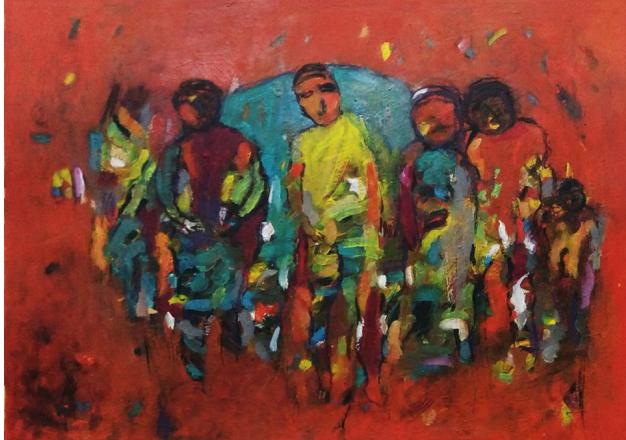
Resim 12: Ahmad Raid Mohammad, İsimli (Anonymous), Kâğıt Üzerine Karışık Teknik, 56X76 cm., 2018. (Ahmad Raid Mohammad'ın Arşivinden, 2019).

Ahmad Raid Mo-hamad savaş sonrası eserlerinde ise daha önce tercih ettiği renkleri daha koyu tonlarda kullanarak soyut ekspresyonist eserler ver-meye devam etmiş olup malzeme olarak akrilik boya ve karışık teknik kullanmıştır. Sanatçı, bu dönemde portre yapımına da devam etmiş ve genel olarak belli belirsiz mekânlar içinde figüratif resimler yapmıştır. Bu eserler detaylı incelendiğinde konu olarak savaş ortamının işlendiği görülmektedir. Ancak sanatçı sanat hayatı boyunca aynı renkleri kul-