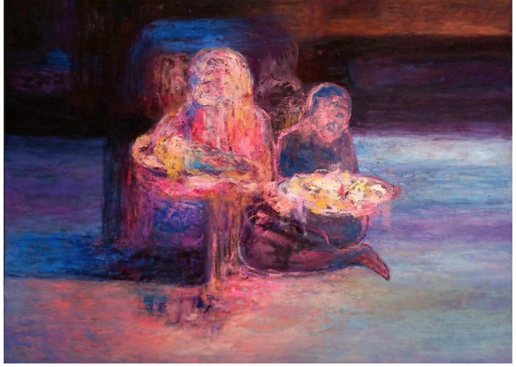
Resim 19: Khayyam Zedan, İsimsiz (Anonymous), Tuval Üzerine Yağlı Boya, 150x185.5 cm., 2015.