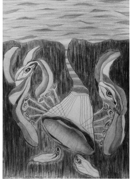
Resim 25: Ahmad Haj Omar, Biçimlendirmek (Form Into), Kâğıt Üzerine Karakalem Tekniği, 35x50 cm., 2016. (Ahmad Haj Omar'ın Arşivinden, 2019).

Sanatçı savaş ve sonrasındaki dönemlerde ise yoğun olarak mor tonlar kullanmış, yer yer kara kelem tekniği ile sürrealist eserler üretmiştir. Türkiye'deki çalışmalarında, özellikle 2016 yılından itibaren olan eserlerinde göz çizimlerinin bir insanı (Res. 25) nitelediği açıkça görülmektedir. 2015 yılından sonraki eserlerde mor dışındaki renklerin canlı tonlarını kullanması savaşın insan psikolojisi üzerinde bıraktığı olumsuz etkiden kaynaklı olduğu değerlendirilebilir.