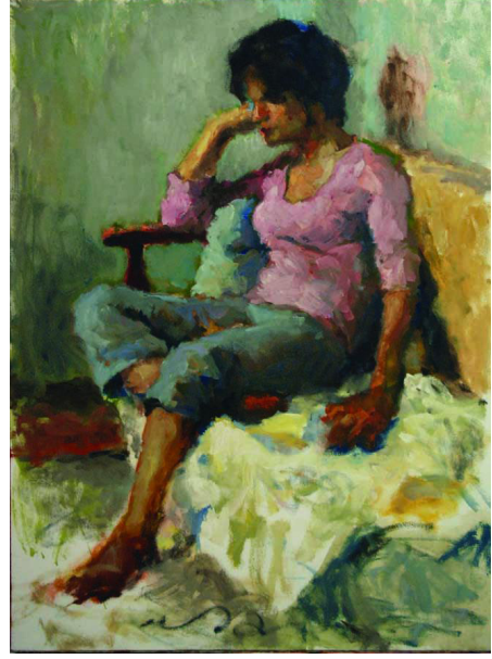
Resim 13: İmad Habbab, O Bir Film İzliyordu (She Was Watching a Movie), Tuval Üzerine Yağlı Boya, 90x120 cm., 2011. (İmad Habbab'ın Arşivinden, 2019).

Savaş sonrası dönemde ise sanatçı siyah, sarı, yeşil, turuncu ve kahverengi tonları ile post-empresyonist, ekspresyonist ve soyut ekspresyonist eserler vermeye devam etmiştir (Res. 13-14). Habbab bu dönem çalışmalarında çeşitli tekniklere yönelmiştir. Bu yönelim sonrası kâğıt ve tuval üzerine tükenmez kalem, mürekkep ve suluboya eserler üretmiştir. Sanatçı konu olarak savaş esnasında maruz kaldığı patlamaları (Res. 14) soyut bir dille eserlerine taşımıştır. Sanatçı 2019 yılına kadar portreleri kent görünümleri ile birleştirirken daha sonraki yıllarda empresyonist bir tavırla kent ve doğa betimlemeleri resmetmiştir. Aynı zamanda 2019 yılından sonra sürrealist sanat anlayışını benimsemiş ve buna paralel olarak görmüş olduğu rüyaları eserlerine konu olarak taşımıştır (Res. 15). Bütün bu çıkarımların yanı sıra sanatçının