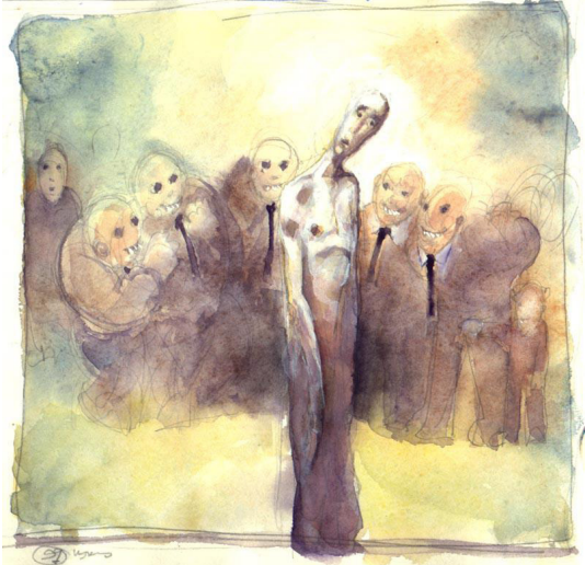
Resim 20: Eyas Jaafar, Tek Başına (Alone), Kâğıt Üzerine Suluboya, 21x29,7 cm., 1991.

Sanatçının savaş sonrası dönemlerde ise siyah, mavi ve kırmızı renk tonları ile ekspresyonist (Res. 20) ve romantik eserler verdiği görülmektedir. Teknik olarak çoğunlukla kâğıt ve tuval üzerine karakalem, suluboya, akrilik boya ve yağlı boya ile çalışmalar yapan sanatçının, konu olarak savaş sebebi ile hissettiği yal-