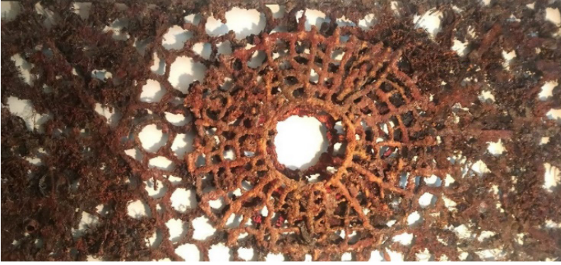
Resim 17: Mustafa Teet, Kavrulmuş Şehir (Roasted City), Metal, 200x100 cm., 2019.