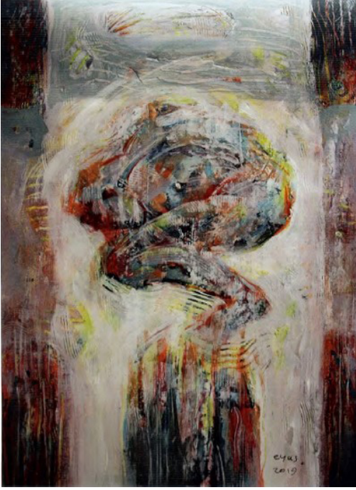
Resim 21: Eyas Jaafar, Acının Zirvesi (Peak of Pain), Tuval Üzerine Akrilik Boya, 29,7x42 cm. 2019. (Eyas Jaafar'ın Arşivinden, 2019).

nızlığı ve mutsuzluğu resmettiği gözlemlenmektedir (Res. 21). Ayrıca toplu taşıma seyahatleri sırasında çok sayıda anlık eskiz yapmış, insanların ruh halleri ve yüz ifadeleri üzerine yoğunlaşmıştır. Sanatçının bu dönem eserlerinde mavi başta olmak üzere birçok rengin koyu tonlarını kullanılması savaşın sanatçı üzerindeki psikolojik etkisinin bir yansıması olarak karşımıza çıkar.