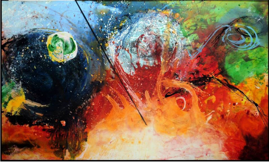
Resim 22: Zolfaqar Shaarani (Anonymous), İsimli, Tuval Üzerine Karışık Teknik, 210x150 cm. 2013. (Zolfaqar Shaarani'in Arşivinden, 2019).