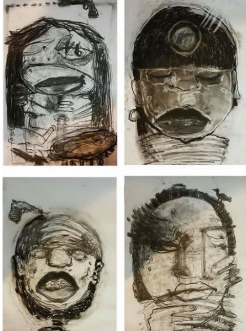
Resim 2: Abd Allatif Aljeemo, Dörtlü Portre (Quad Portrait), Kâğıt Üzerine Kömür, 2016.