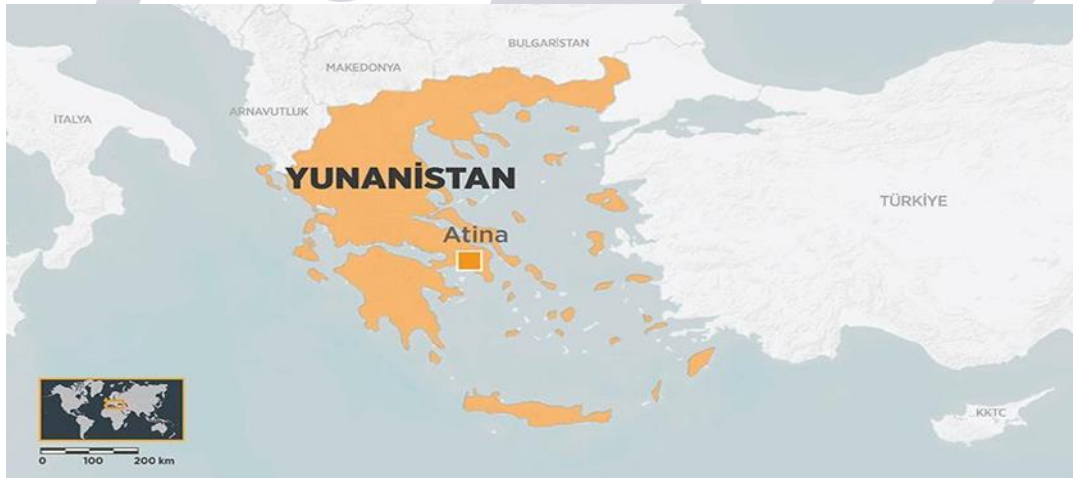
Harita 1: Türkiye ve Yunanistan'ın Birbirlerine Göre Coğrafi Konumları

Bilindiği üzere Türkiye ve Yunanistan'ın kuruluşlarından itibaren yaşadıkları sorunların pek çoğu coğrafi yakınlıktan kaynaklanmaktadır. Bu iki sınırdaş ülke kara, hava ve deniz sınırlarını paylaşmaktadır. Kara hariç diğer sınırlar tartışmalıdır ve bugün dahi yaşanan sorunların (Ege ve Doğu Akdeniz'de) en önemli amilleridir. Harita 1'de de görüldüğü gibi Yunanistan'ın birçok adası Türkiye kara sınırına oldukça yakındır. Deniz yetki alanlarının bir antlaşma yoluyla sınırlandırılmaması böylesi bir topoğrafyada bugünkü sorunların en önemli nedenlerindedir. Başka bir ifadeyle iki ülkenin deniz yetki alanlarının sınırlandırılmaması, bu coğrafi yakınlıktan kaynaklı sürekli sorun ve tehdit algılamalarına yol açmaktadır. Tabii olarak Doğu Akdeniz'de bulunması beklenen enerji kaynakları halihazırda var olan sorunları ve tehdit algısını derinleştirmektedir.