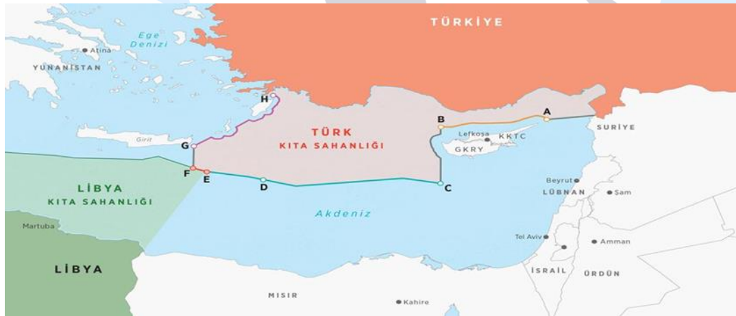
Harita 3: Türkiye-Libya arasında Deniz Yetki Alanlarının Sınırlandırılması Anlaşmasına göre Türkiye'nin Deniz Yetki Alanı