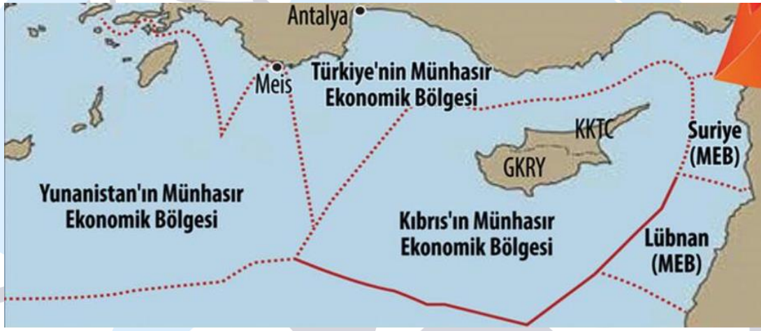
Harita 2: Yunanistan'a göre Deniz Yetki Alanları

Türkiye'nin Kaş açıklarındaki Yunanistan'a ait küçük Meis adasını gerekçe gösteren Yunanistan Doğu Akdeniz'de büyük bir bölgede Münhasır Ekonomik Bölge (MEB) ve kıta sahanlığı iddiasında bulunmaktadır. Yunan tarafı, Akdeniz'in bu bölgelerinin, Girit ve Rodos adalarının devamı olarak Kıbrıs adasının deniz yetki alanlarına kadar olan kısmının, kendisine ait olduğunu iddia etmektedir. Söz konusu bu alan Türkiye'nin Libya ile imzaladığı Deniz Yetki Alanı anlaşmasının sınırları ile çakışmakta (bkz. Harita 2 ve 3) ve Yunanistan buradaki (yatay düzlemde) bazı alanların kendine ait olduğunu ifade etmektedir. Bu iddia Türkiye'nin Akdeniz'de Antalya ve Mersin körfezlerine sıkışması anlamına gelmektedir (Çelikkol, 2018). Türkiye ise söz konusu alanların kendi deniz yetki alanları olduğunu iddia etmekte ve bu alanda MEB ilân ederek doğalgaz aramaları yapmaktadır. Her iki ülkenin de bölgede savaş gemilerini bulundurması bu coğrafi alanda tehdit algılamasını artırmaktadır.